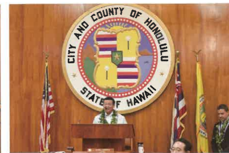
▲挨拶を述べる仲間町長