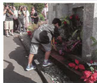
▲献花を行う雄飛太鼓の代表