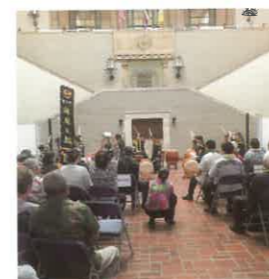
▲記念レセプションの様子