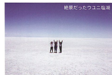
絶景だったウユニ塩湖