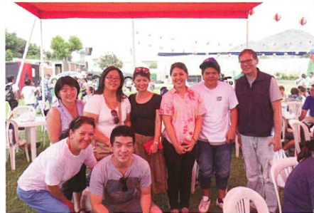
▲ペルーで開催された沖縄まつりにて