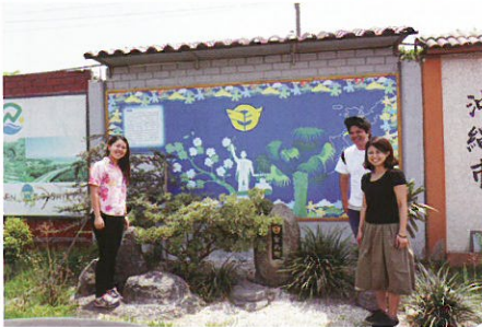
▲ペルー沖縄県人会館の敷地内にある、金武町モニュメント前で