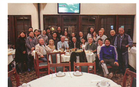
▲歓迎会にて北米金武クラブの皆さんと