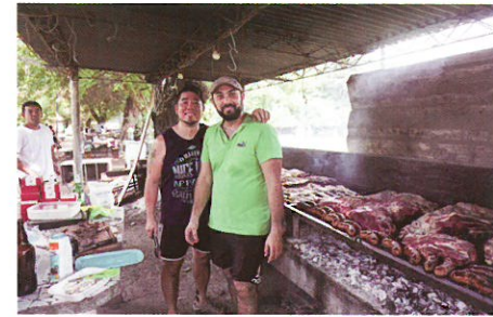
▲アルゼンチン金武町人会の皆さんと（うるま園） ▲ピンクハウス～カサ・ロサダ(アルゼンチン大統領官邸) ▲町人会の新年会で料理を担当する金武町の元研修生