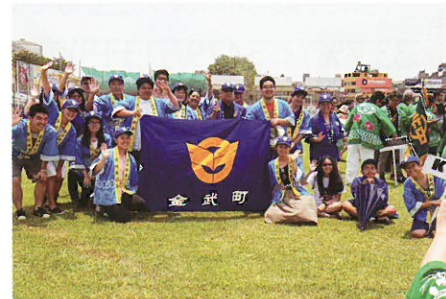
▲沖縄まつりのパレードに金武町人会の一員として参加