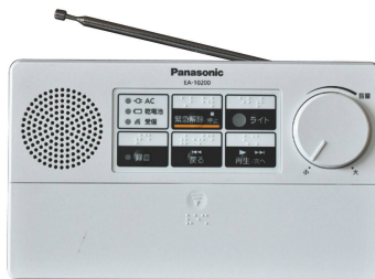
取付予定の 戸別受信機

現在、町では有線放送電話を廃止（廃止は令和4年9月以降）し、戸別受信機設置のため、設置に伴う同意確認を行っております。以下のとおり、工事業者が各家庭を訪問しますので、町民の皆さまのご対応・ご協力よろしくをお願いします。予め、設置箇所の検討をよろしくをお願いします。