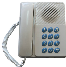
有線放送電話 (令和4年度以降廃止)

金武町において地震や風水害等の緊急時に町民の生命及び財産の安全を守るために、町内全域への迅速かつ的確な情報発信手段を確保するために、有線放送電話を廃止して、新たに戸別受信システムの整備を進めていくこととしています。