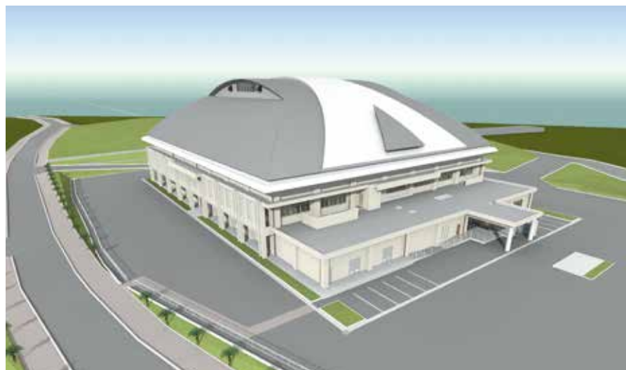
▲金武町多目的屋内運動場施設イメージ図