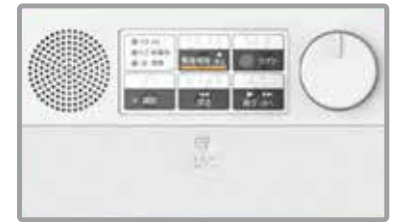
導入機器（イメージ）