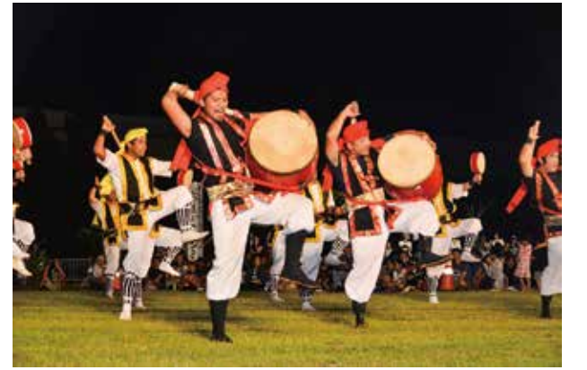
▲躍動感あふれる中川区青年会