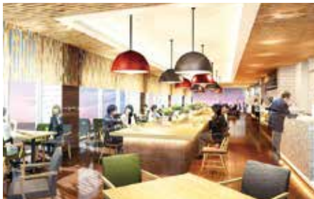
▲6階のレストランのイメージ

開業予定は、平成31年末頃を目標にしています。運営計画では、ホテルや温泉施設の運営実績がある(株)レンブラントホテルディングス(神奈川県)に運営管理を委託する予定で、開業5年目の温泉利用者見込みが約13万人、ホテル宿泊者が約7万7千人となっています。雇用計画は80〜100人程度となっています。