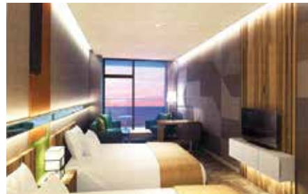
▲2〜5階の客室のイメージ