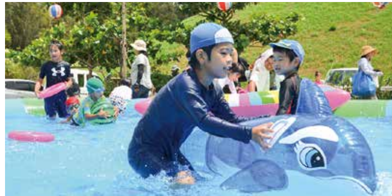
▲大きなプールで水遊び

7月22日、金武ダム施設内で第4回金武ダムまつりが開催されました。 12種類の多彩な体験イベントコーナーでは、「ステンドグラス工作」や「島ぞうりアート体験」など、多くの子どもたちがオリジナルの作品づくりに夢中になっていました。また、ダム湖面を利用した「カヌー体験」や、毎年大人気の「ウナギつかみ取り競争」などのイベントでは、町内外から訪れた沢山の参加者が水とふれあう体験で涼しんできました。