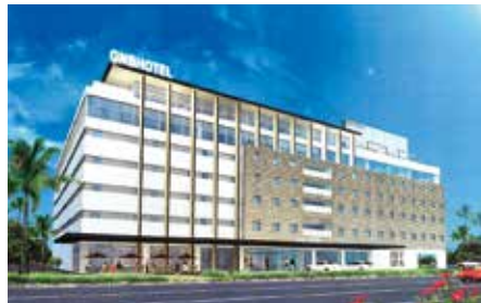
▲温泉・ホテル外観のイメージ

町がギンバル訓練場跡地利用の一環として進めてきた民設民営による温泉施設の導入が、去る金武町議会(嘉数義光議長)6月定例会で決まりました。これは、同跡地内の町有地の貸付に係る議案「財産の貸付について」が可決されたもので、施設整備を行う(株)アイロムPM(東京都)に、町有地を30年間貸し付けるものとなっています。町では平成26年度にギンバル訓練場跡地内で源泉を掘り当て、その活用を図ってきたものです。