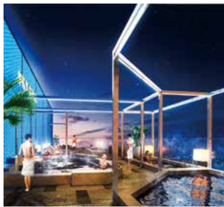
▲7階露天風呂のイメージ