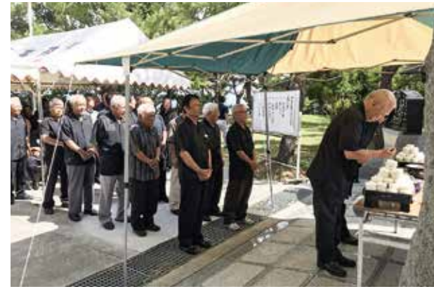
▲平和の塔前で御霊に焼香をあげる参列者