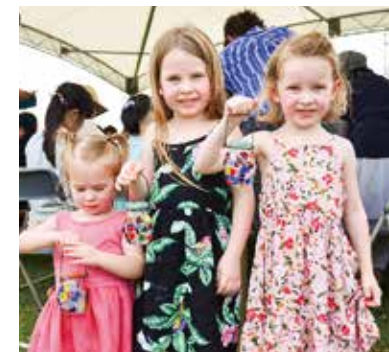
▲ステンドグラス工作で手作りランタン