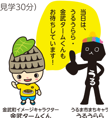
金武町イメージキャラクター 金武タムくん うるま市まちキャラ うるうらら

問 うるま市役所 産業政策課 産業政策係 ☎ sangyou-ka@city.uruma.lg.jp ☎ 923-7611 FAX 923-7623