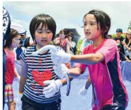
▲大盛り上がりのウナギつかみ取り競争