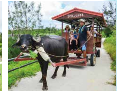
▲水牛車体験でゆったり散策