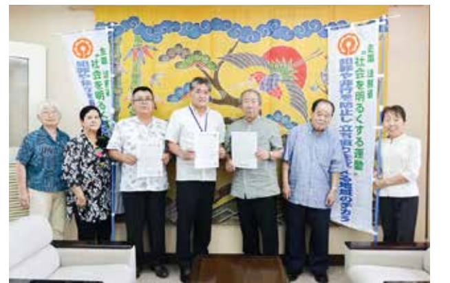
▲社会を明るくする運動を呼びかける中部北保護区保護司ら

町内各区の青年会が個性あふれる演舞を披露。日々の練習の成果を存分に発揮し、熱の入った演舞で観客を魅了しました。最後は、350発の打ち上げ花火と会場全体でカチャーシーを踊り、まつりを盛り上げました。