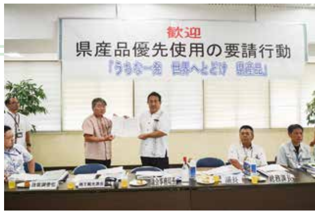
▲嘉数議長へ要請書を手交