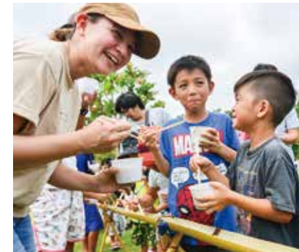
▲金武町産の流しもずく