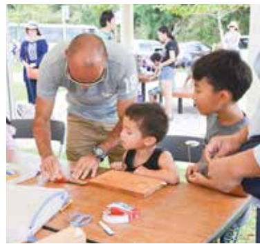
▲竹トンボ作り体験