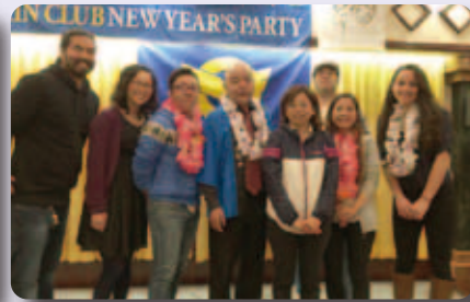
▲金武町人会新年会にて