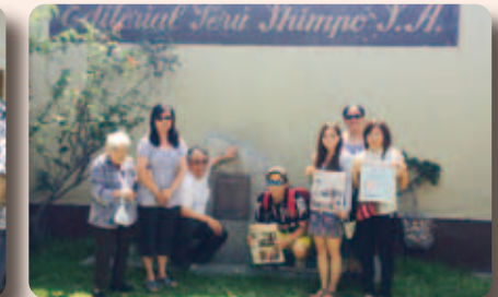
▲ペルー新報ではペルーや沖縄についてインタビューを受けました。ペルー新報は日本語とスペイン語で書かれていて、私たちでも読むことができました。