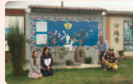
▲沖縄県人会館の庭園付き金武町コーナー