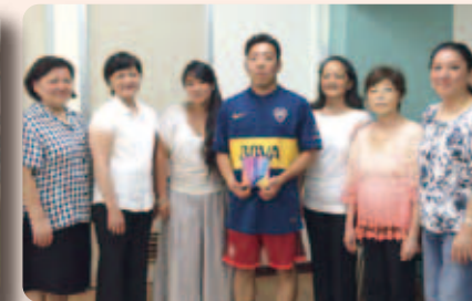
▲新年会で、ペルーの親戚に初めて会うことができました。親戚の方達に温かく迎えられて、嬉しかったです。