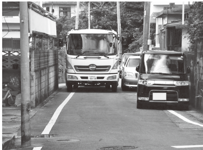
▲路上駐車でごく細くなった道をごみ収集車が通る様子