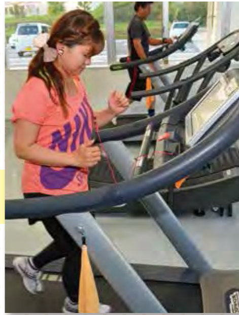
▲ランニングマシン