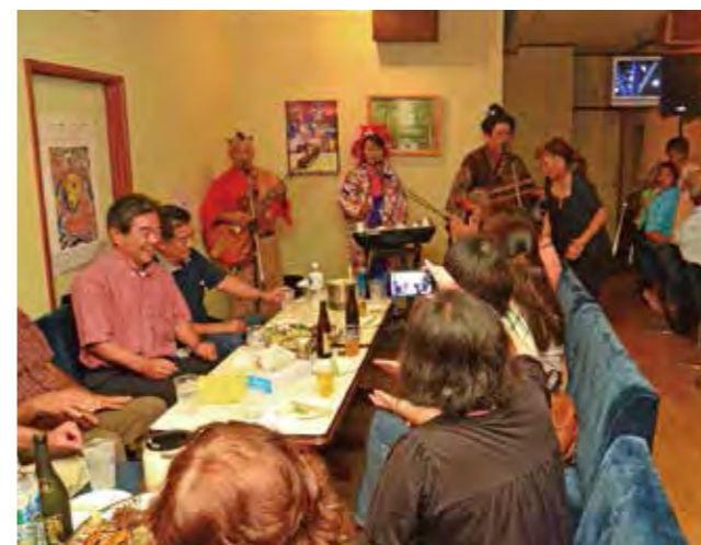
▲面白さとうまさが絶妙

アーティスト達が熱唱!! 第2回新開地ライブまつり第1弾 6月14日にキャンプ・ハンセン第1ゲート前の社交街「新開地」にて、第2回新開地ライブまつり第1弾(主催・同実行委員会)が行われました。新開地で営業する飲食店8店舗が会場となり、全国で活躍するMOOMINなど豪華なアーティスト達が、お笑いや民謡、懐メロバンドなどのライブパフォーマンスで会場を盛り上げました。 同ライブまつりは第2弾目があり、次回は8月29日(金)の19時から開催を予定しています。