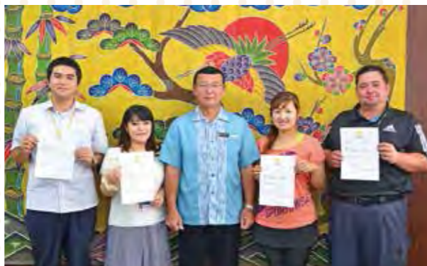
▲肉体改善の誓いをたてる4名の職員と町長

モニターテストに参加することになった職員は「フィットネスジムで理想の体を手に入れてやる!」と、トレーニングへの意気込みを語っていました。 これから平成27年3月31日までジムでのトレーニングを行い、定期的に経過観察し、広報に報告していきます。