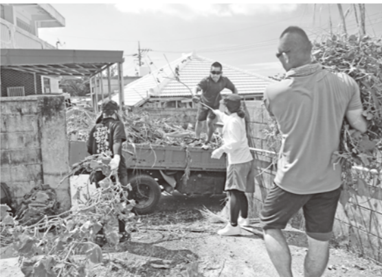
▶自衛隊員との草刈共同作業の様子

今回初めての参加となる自衛隊員との草刈り共同作業では、青年会の若い力と、自衛隊員の日頃から鍛えてきた体をいかに発揮し、あつという間に庭はきれいになり、高齢者は大感激。蒸し暑い夏にも、高齢者宅に涼しい風が入るようになりました。