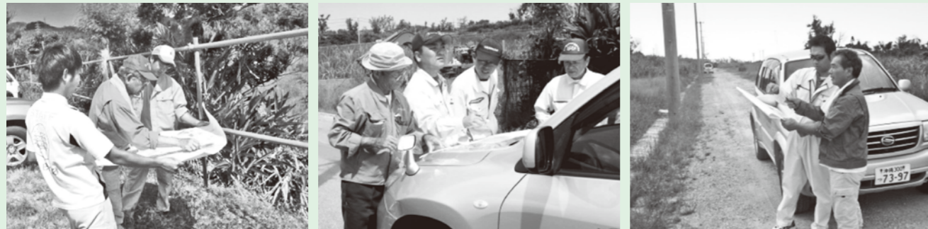
(昨年の農地利用状況調査実施の様子)

農業委員会では、毎年、農業委員を中心に町内全農地の遊休農地及び作付作物調査を行っております。今年は8月に調査を予定しております。遊休農地の所有者や借受者の方については、今後、指導や通知をしていきます。指導対象者とならないよう、農地を適正に管理・耕作を行ってください。