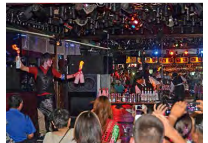
▲息をのむパフォーマンスが続く