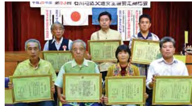
▲交通安全功労者等被表彰者の皆さん(表彰式出席者のみ)

6月3日、恩納村コミュニティセンターで行われた石川地区防犯協会定期総会で、防犯功労者・団体などとして町内から3個人・1団体が表彰を受けました。 また、6月11日に同所で行われた石川地区交通安全協会定期総会では、交通安全功労者、優良事業所などとして、7個人・3団体が表彰を受けました。