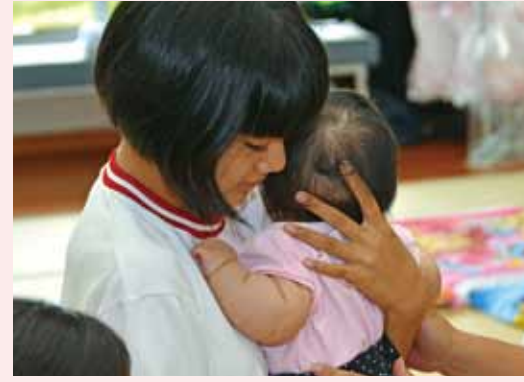
▲赤ちゃんを大事に抱きかかえる生徒

処法に困りましたが、付添いのお母さんから抱き方のコツやなだめ方など、赤ちゃんとのコミュニケーションセッション方法を学び、実践していました。 生徒たちは「毛が薄くて可愛かった」、「力強く暴れて大変だった」、「意外と重かった」など、小さな命の生きる強さを肌で感じていました。