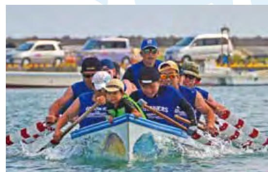
▲統率のとれた漕ぎかたをする「ガナーズ」