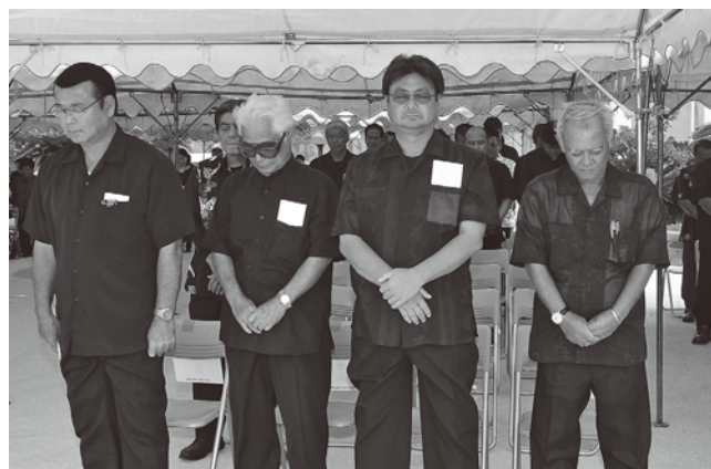
▼戦没者へ黙とうをささげる

6月14日に伊芸区のさくまつ公園にある平和の塔前で、同区戦没者を弔う慰霊祭が執り行われました。区長や区戦没者遺族会長のほか雨の中、多くの区民が参列し、戦禍の犠牲となった慰霊碑にまつられた76柱の御霊を慰めました。