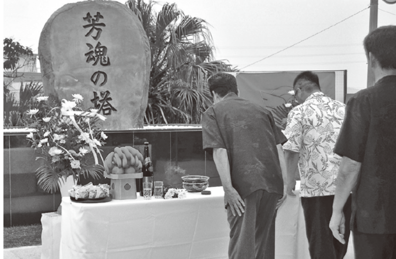
▲芳魂の塔で焼香を上げる様子

町出身の戦没者をまつる「芳魂の塔」で6月5日、金武町戦没者追悼式が執り行われ、戦没者の遺族らや町関係者、児童・生徒の代表などが参列し、焼香を上げ、御霊を慰めるとともに、平和への誓いを新たにしました。