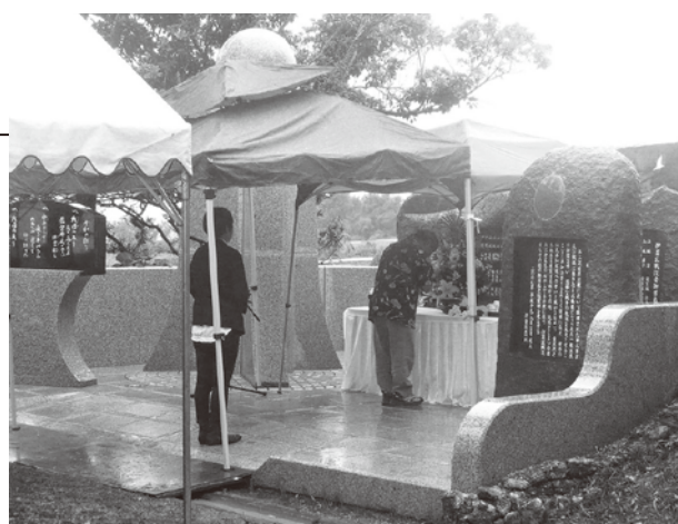
▲雨のなか多くの参列者が焼香を上げた

6月14日に伊芸区のさくまつ公園にある平和の塔前で、同区戦没者を弔う慰霊祭が執り行われました。区長や区戦没者遺族会長のほか雨の中、多くの区民が参列し、戦禍の犠牲となった慰霊碑にまつられた76柱の御霊を慰めました。