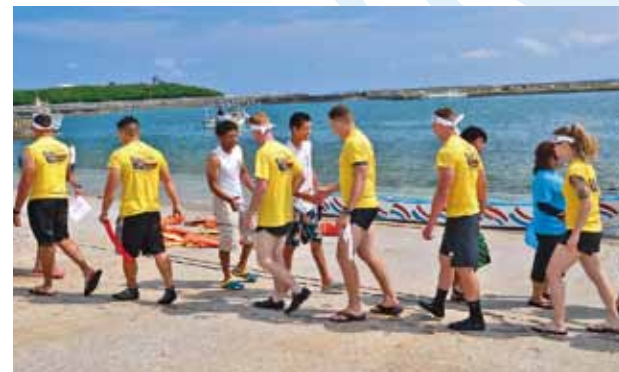
▲お互いの健闘を讃え選手同士握手