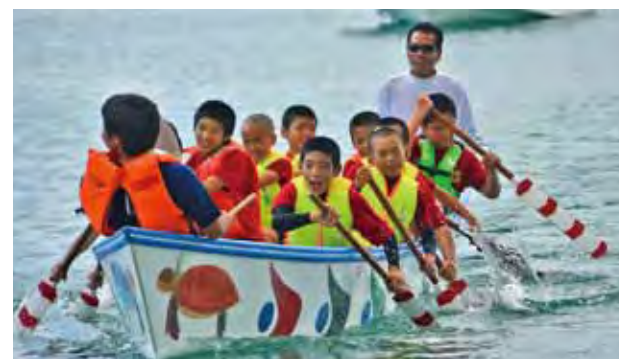
▲子ども会によるハーリー