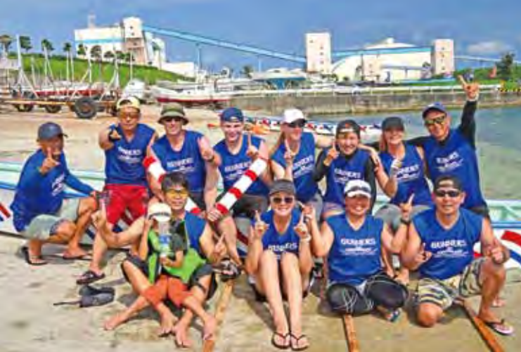
▲優勝チームの「ガナーズ」

また、今回は子ども会のハーリー大会も並行して行われ、子どもたちは、爬竜船を漕ぐことの難しさやチームワークを体験し、ゴールしたときの充実感と達成感を感じていました。