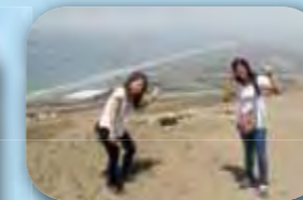
▲砂漠の山から見える海