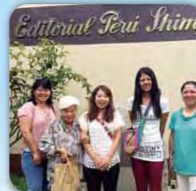
▲日系新聞ペルー新報の前にて

ペルーは海・山・砂漠と1つの国で複数の自然を感じられる国でした。また日系人が運営している施設が多くあり、日系人の活躍を見ることもできました。