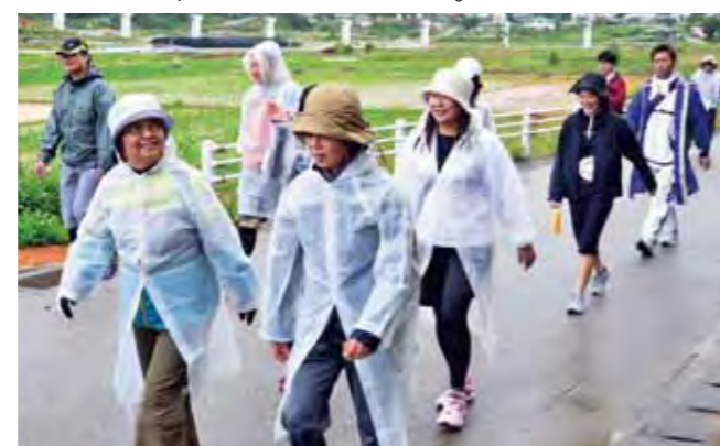
▲田園風景を楽しみながらウォーキング

3月9日、第6回環金武湾ウォーキングフェスタゆいゆいウォーク(主催・同実行委員会)が開催されました。94人の参加者が町陸上競技場から宜野座村農村公園までの26キロの道のりを歩きました。 コースは金武観音寺や金武大川、田芋畑、億首川マングローブなど金武の景勝地を通るよう設定されており、町内外からの参加者たちは、金武町の風景を楽しみながらさわやかな汗を流していました。