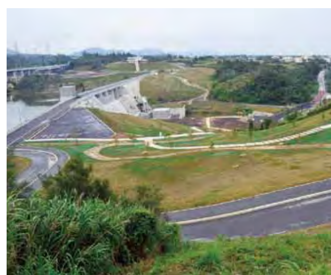
▲ダム周辺には散歩が楽しめる歩道が整備されている

この事業に関する問い合わせは、北部ダム事務所 億首出張所(NTT098015213872)まで。