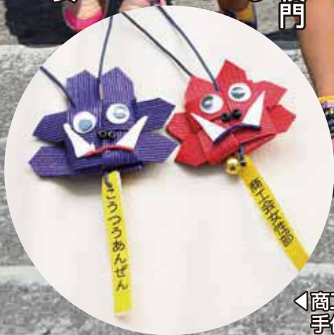
◀商工会女性部の皆さんが手作りした交通安全お守り

嘉芸小学校・幼稚園で4月10日、石川警察署と石川地区交通安全協会による交通安全教室が開催されました。 1年生と幼稚園生は、校門前の国道で横断歩道を渡る練習を行いました。 商工会女性部は1年生に手作りの交通安全お守りをプレゼント。 金武町の子どもたちが安全に暮らせますように♪