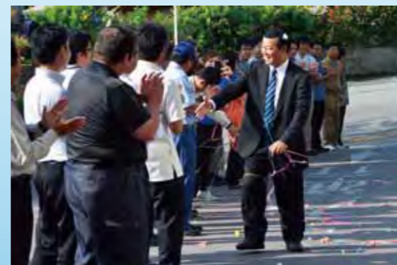
▲4月17日、職員に迎えられ初登庁 職員に向けた訓示では「町民目線で、目くばり・気くばり・心くばりの行政を」と呼び掛けました

「今回の選挙では、多くの町民から叱咤激励と応援を受け当選することができました。今後は、金武町民が心一つにして「心豊かな明るく住みよい活力あるまちづくり」に邁進できるよう、粉骨砕身がんばってまいります」