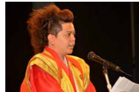
▲新成人代表あいさつ