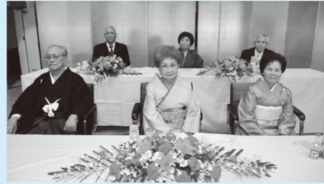
▶伊芸区の生年祝対象者の皆さん

屋嘉区と伊芸区で1月11日、数え年で73歳(昭和17年生まれ)、85歳(昭和5年生まれ)を迎えた午年生まれの方々の生年祝が行われました。お祝いの主役たちは、多くの親族らに囲まれ、料理とステージ余興を楽しんでいました。