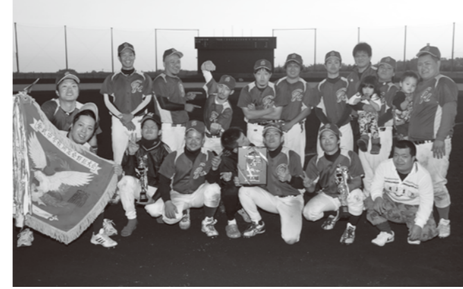
▲優勝旗を手にし笑顔満点の「CH」のメンバーら

元日の恒例行事となっている金武中学校同窓生対抗野球大会が今年も町内各野球場で開催されました。ベースボールスタジアムで行われた決勝戦では、57期生チーム「CH」が昨年優勝の58期生チーム「サザン」を6-5で下し、優勝旗を手にしました。