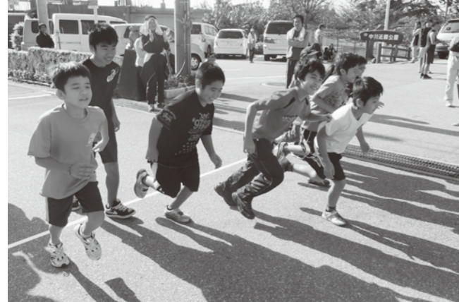
▲新年のさわやかな朝日を浴びて走る