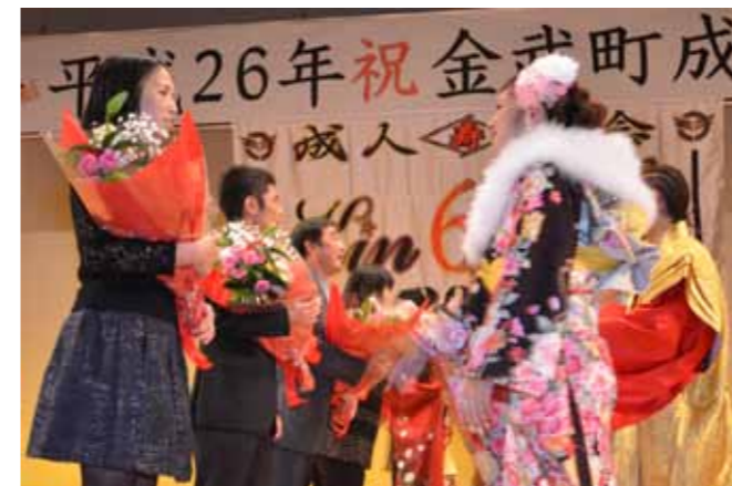
▼お世話になった恩師らに花束贈呈