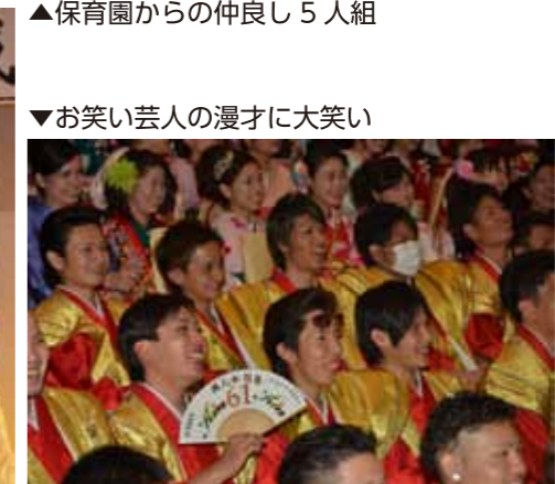
▼お笑い芸人の漫才に大笑い