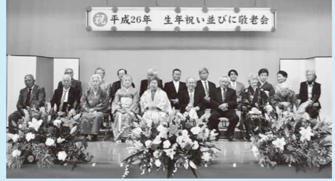
◀屋嘉区の生年祝対象者の皆さん