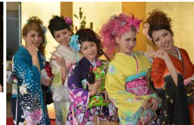
▲保育園からの仲よし5人組