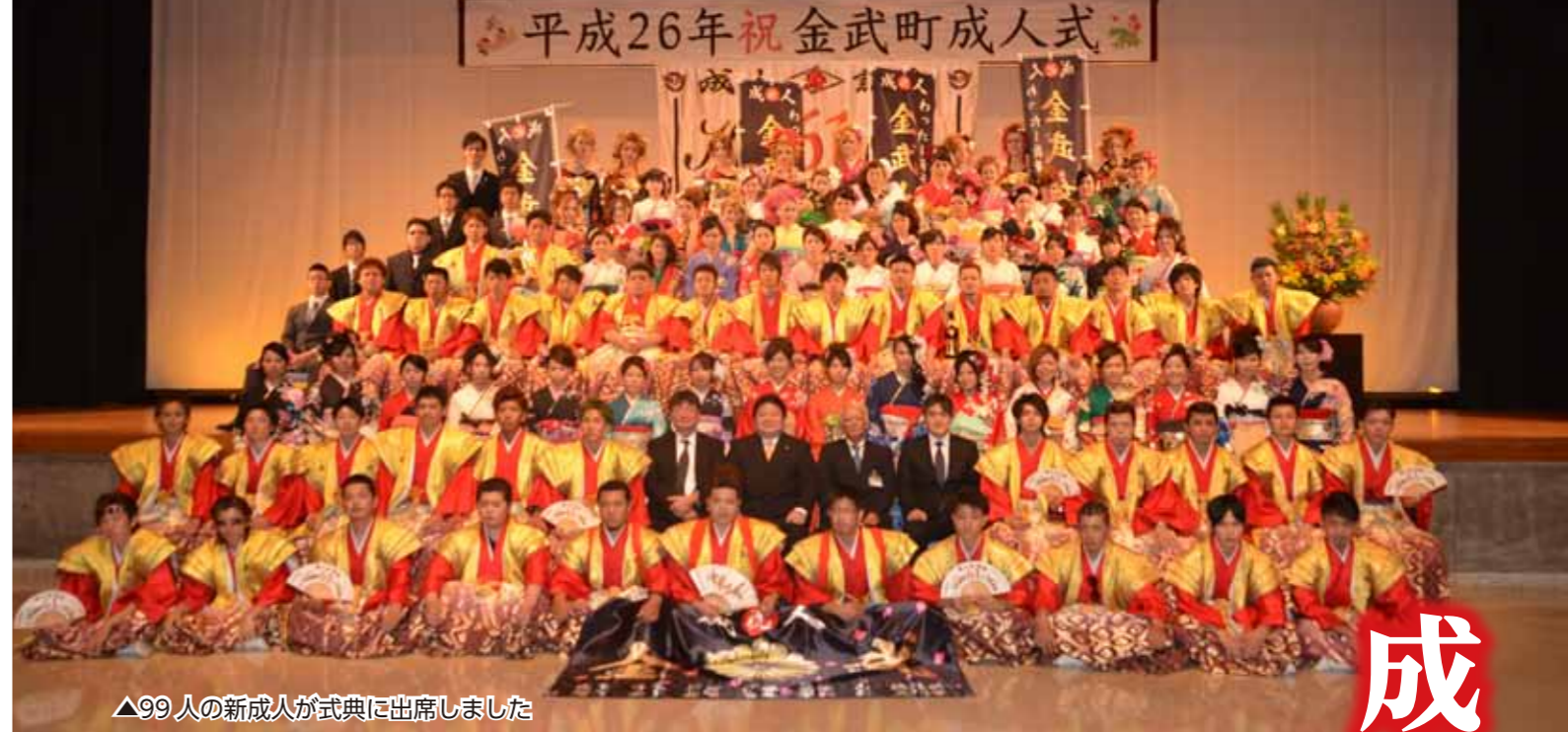
▲99人の新成人が式典に出席しました