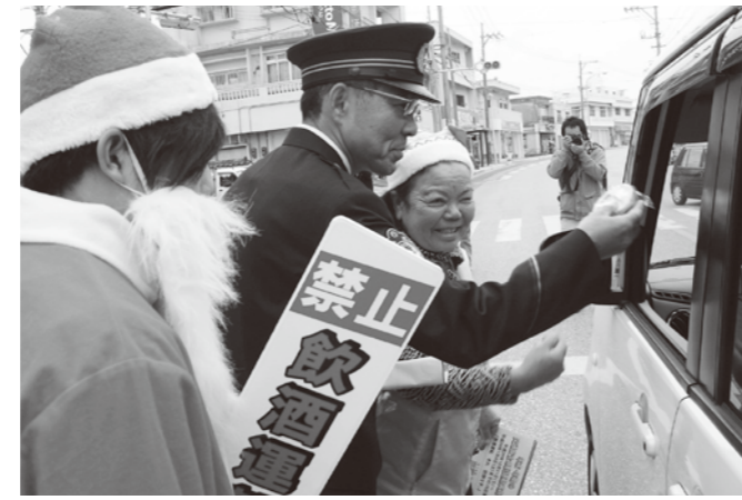
▲町特産の田芋はドライバーにも喜ばれた

12月24日、町交通安全推進協議会・町交通安全の会などのメンバー約20人が、JAおきなわ金武支店前の国道沿いに立ち、信号待ちのドライバーなどに手作りの田芋でんがくを、交通安全を喚起するチラシとともに配布しました。この運動は年末年始の交通安全県民運動の一環として行われたもので、参加者らは年末年始の安全運転や飲酒運転根絶を呼び掛けました。