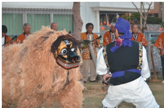
▲ 観月祭の前に行われた獅子舞奉納（金武区）

旧暦8月15日にあたる9月19日、金武区と伊芸区で観月祭、並里区で十五夜村あずびが開催されました。各区とも多数の区民が集まり、それぞれに伝わる伝統芸能などを堪能しました。