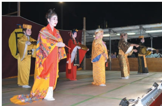
▲ 各種団体長による「かぎやで風」（金武区）