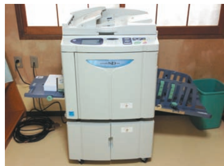
▲金武区に整備された印刷機

平成25年度のコミュニティ助成事業は金武区が対象となり、会議用テーブル・パイプイス・印刷機などのOA機器が整備されました。同事業は、財団法人自治総合センターの助成によるもので、コミュニティ活動の発展と宝くじの普及広報を目的として毎年実施されています。