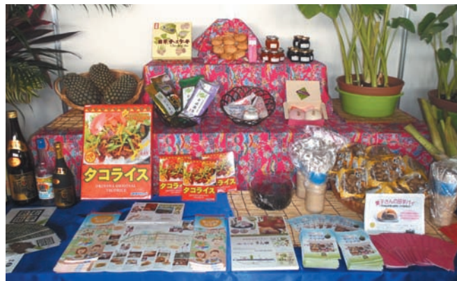
▲金武町のブースで展示された特産品の数々

10月12日・13日の2日にわたり、名護市で第29回やんばるの産業まつり（主催・北部振興会）が開催されました。金武町もブースを構え、田芋スイーツやぶなしめじ、緑茶、泡盛などを展示して、町の特産品をPRしました。まつり会場は来場者でにぎわい、金武町ブースの前でも多くの方が足を止めていました。