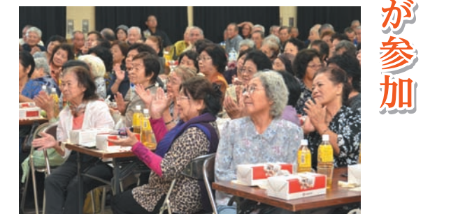
▲ステージの琉球舞踊を堪能する参加者ら

9月26日、金武区敬老会が金武公会堂で行われました。ホールを埋め尽くす約400人の元気なお年寄りが集まり、気心の知れた友人たちとの会話に華を咲かせました。ステージでは、県立芸大OBによる琉球舞踊が披露され、敬老会の参加者たちは、見事な舞を心ゆくまで堪能していました。