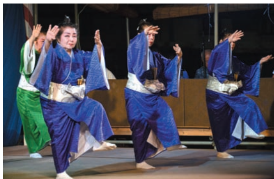
▲ 年季の入った「かたみ節」（並里区）