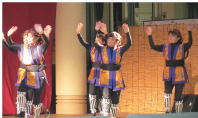
▲婦人会による踊り

中川近隣公園で10月13日、第11回中川まつり（主催・同区）が開催されました。ステージでは、子ども会や婦人会、老人クラブによる踊りや、成人会による寸劇などが披露され、区内外から訪れた来場者を楽しませました。青年会がエイサーを演舞すると、会場は大盛り上がり。最後は出演者・来場者が入り乱れてのカチャーシーで幕を閉じました。