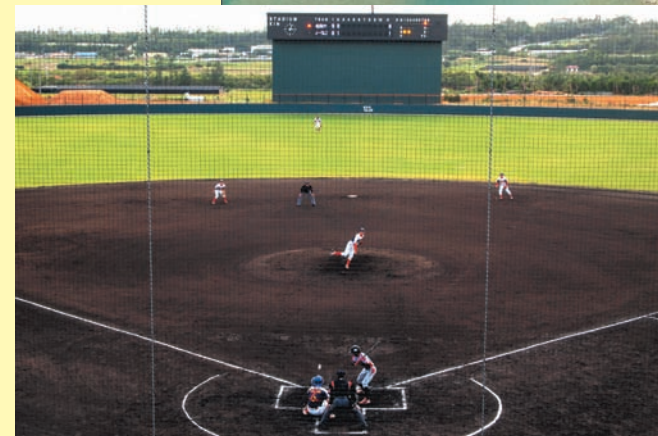
◀多くの町民の要望に応じて建設された金武町ベースボールスタジアム