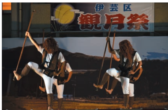
▲ 町無形文化財「南又島」（伊芸区）