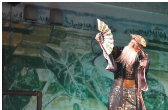
▲ 深い演技で魅せる「長者の大主」（並里区）