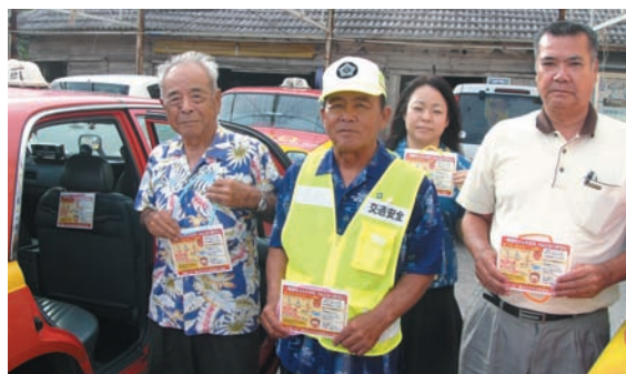
▲ タクシーの座席にシール設置