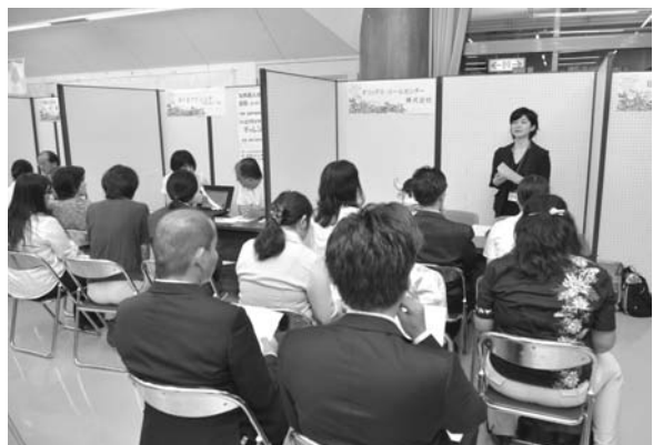
▲採用担当者の話を熱心に聞く参加者ら

企業側は、医療・福祉関係からコールセンター、ホテル・観光関係、建設業まで、幅広い業種の21