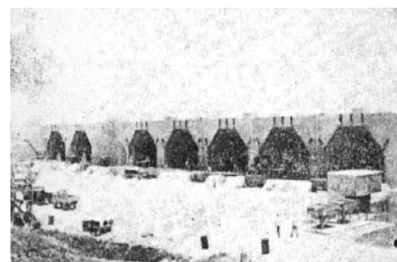
昭和37年撮影