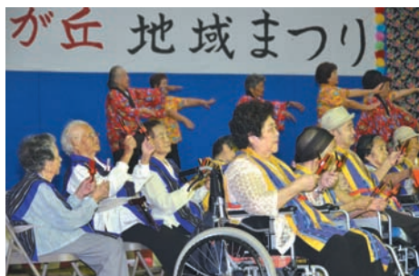
▲余興を披露するデイサービス利用者ら

特別養護老人ホーム光が丘で9月14日、第21回光が丘地域まつり(主催・金武あけぼの会)が催されました。ステージでは、同施設の入所者やデイサービス利用者が歌などの余興を披露し、健康長寿をアピール。 中川区青年会のエイサーがまつりのフィナーレを飾り、「唐船ドリー」の曲に合わせてカチャーシーを踊り出すお年寄りの姿も見られました。