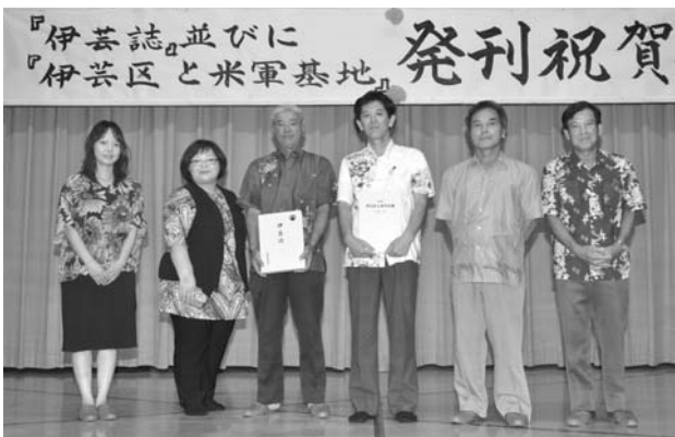
▲伊芸区誌編さん委員会のメンバー