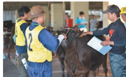
▲厳正な審査の様子

受けました。審査結果は左 表のとおり。 また、会場では、ヤギやア ヒルなどにふれあえるミニ動 物園や、乗馬体験コーナ ーが設けられ、見学に来た子 どもたちの人気を集めてい ました。