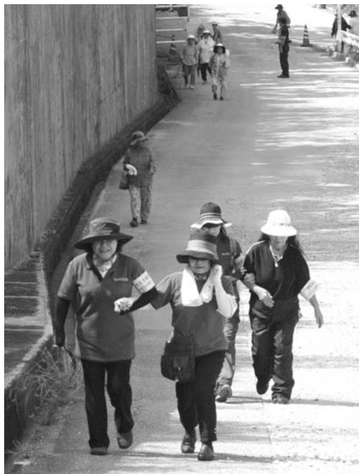
▲伊芸区と屋嘉区では、障がい者の避難を想定し、民生委員が目隠しや車いすで避難場所まで移動する実験を行いました

9月4日、地震と津波を想定した避難訓練が県下一斉に実施されました。 金武町では、学校や福祉施設など34団体2504人、個人参加者433人の合計2937人が訓練に参加しました。訓練は、午前10時に地震が発生したものと想定。町役場からは、10時3分に有線放送やエリアメールで避難開始の合図を发出了しました。 避難の目標時間は、沖縄県が実施した津波被害想定調査（平成25年3月）のシミュレーション結果に基づき、地震発生後、津波が伊芸沿岸に到達するとされている「28分以内」と設定。目標達成率は99・8%でした。