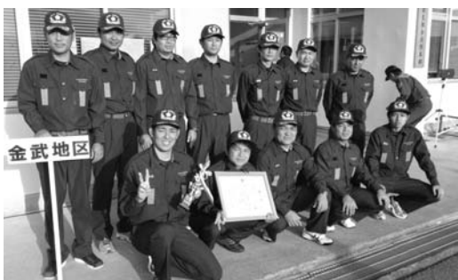
▲金武分団の団員ら

金武地区消防団金武分団は、個人で争う「着装競技」、3人1組で争う「応用操法」に出場。タイムを叩き出し、