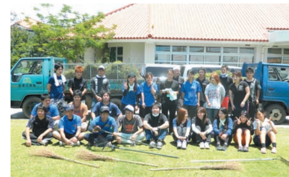
▲作業を終えた青年たち

町社会福祉協議会と町青年団協議会・各区青年会は6月15日、町内の独居高齢者宅5世帯の草刈り作業を行いました。草刈り機などを使ってきばきと作業を進める若者たちに、高