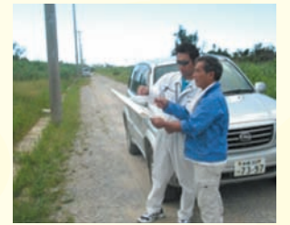
▲ 農地利用状況調査の実施状況