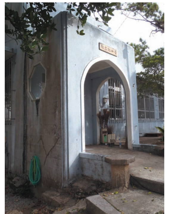
▲モニュメント化が計画されている玄関部分

庁舎増築計画ならびに當山記念館のモニュメント化について、町民の皆さまのご理解を改めてお願いいたします。