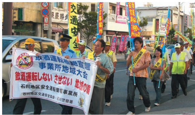
▲飲酒運転根絶を訴えるパレード

石川警察署で7月1日、飲酒運転根絶宣言事業所地域大会が行われました。町内に拠点を構える事業所も複数参加。参加者たちは、石川警察署からタウンプラザかねひで石川店まで国道沿いをパレードし、沿道の人々や通行中のドライバーなどに飲酒運転根絶をPRしました。 毎月1日は飲酒運転根絶の日。地域や職場でも声をかけあって、飲酒運転をなくしましょう。