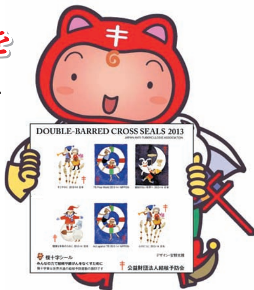
▲ キャンペーンキャラクター「シール坊や」

町内では各地区の班長が各世帯を訪問しますので、結核予防複十字シール募金へのご理解、ご協力をよろしくお願いいたします。