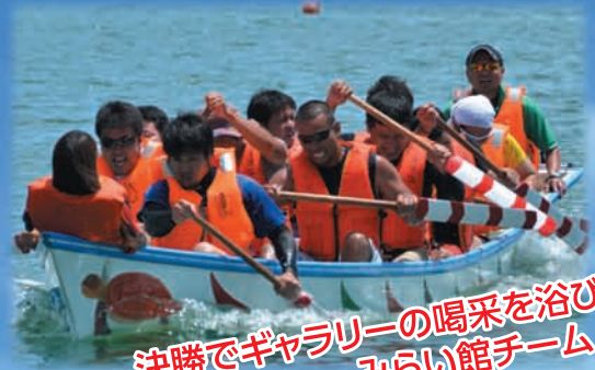
決勝でギャラリーの喝采を浴びた ネイチャーみらい館チーム