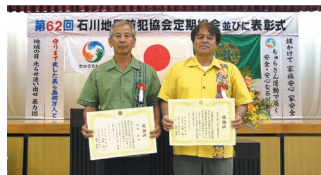
▲ 防犯功労者受賞者