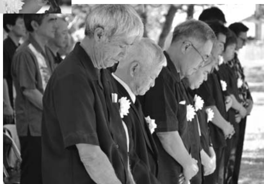
▲黙とうを捧げる参列者ら