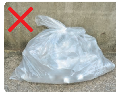
無地のビニール袋