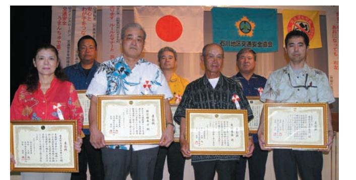
▲ 交通安全功労者等受賞者