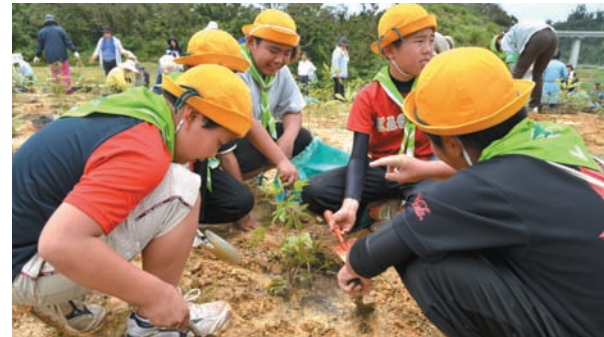
▶ 穴に溜まった水をかき出す作業に四苦八苦

植樹作業の参加者たちは、前日に降った大雨で溜まった水を、苗を植える穴からかき出すのに四苦八苦。それでもサクラなど6千本の苗木を無事植え終え、億首ダムの広場は苗木でいっぱいになりました。