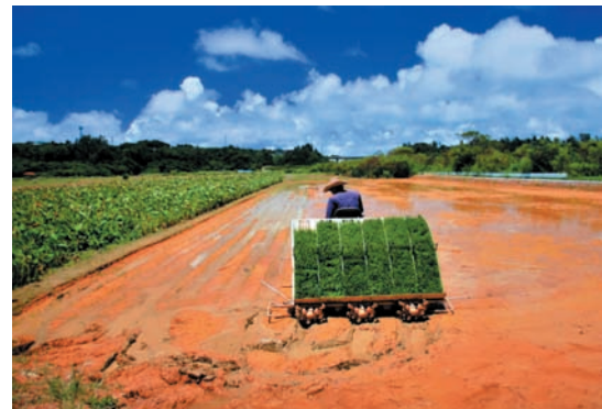
▲ 昨年の大賞受賞作品 (宮城米子「豊かな実りを願って」)