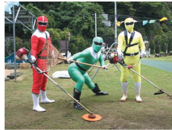
▲ ヒーローにふんじた大豊建設社員ら

大豊建設と仲間組は5月24日と6月6日、町立4保育所（金武・並里・浜田・嘉芸）園庭の草刈り作業をボランティアで実施しました。 大豊建設の社員らは特撮ヒーローの衣装を着て作業を行い、園児たちに大うけ。「がんばれー!」という声援を受け、炎天の下でも張り切って作業を行っていました。