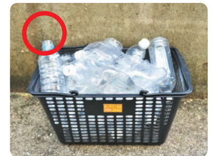
かご・バケツ・箱に入れる