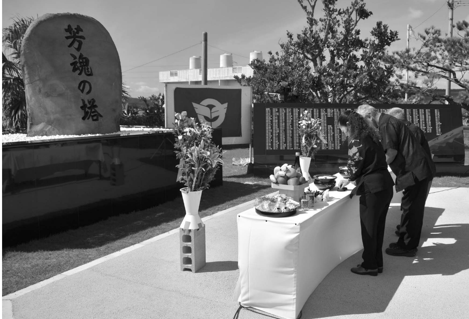
▲追加刻銘され台座も新しくなった芳魂の塔で焼香を 上げる参列者ら