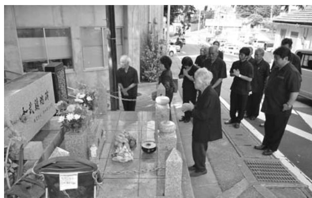
▲金武鎮魂碑前で手を合わせる関係者ら

を享受することができるのも御霊の尊い犠牲の上に築かれていることを忘れてはならない。国際社会においては、今なお地域紛争やテロが絶えず、