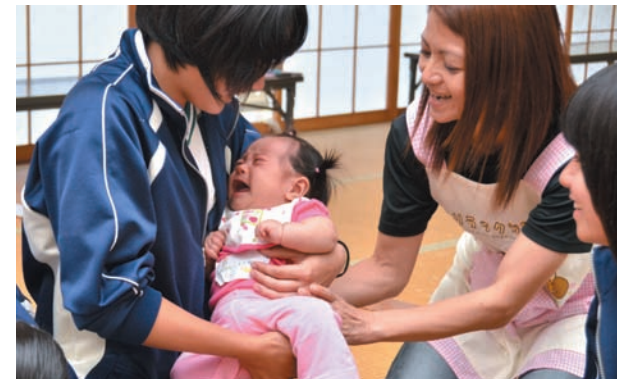
▲ 抱っこしながら赤ちゃんをなだめる生徒

この事業は、町と同中学校が共同で行っているもので、赤ちゃんとのふれあいや母親へのインタビューをとおして