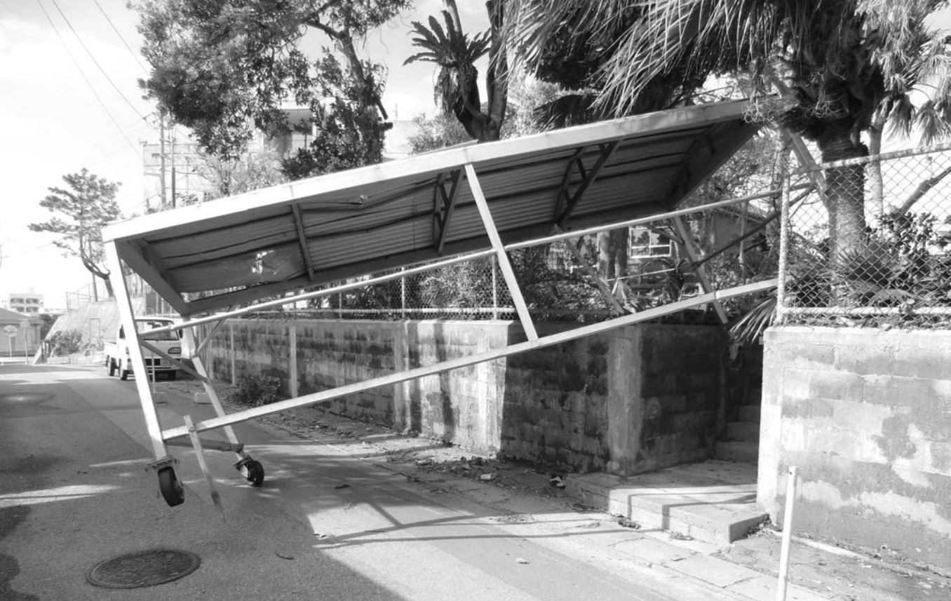
▶平成24年台風第16号の突風で飛ばされた伊芸地区グラウンドのベンチ屋根（平成24年9月17日撮影）

屋外に設置した鉢植えや農機具、看板など、風で飛ばされるおそれのある物は風が強くなる前に 屋内に移動 しましょう。移動できない場合は、 しっかりと固定 するなど十分な対策をとりましょう。また、敷地内の 樹木の剪定 も済ませておきましょう。