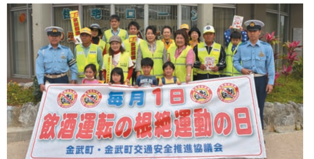
▲ 飲酒運転を私たちは絶対に許しません！

毎月1日の「飲酒運転根絶の日」にちなみ、5月1日、町交通安全推進協議会と町交通安全母の会、石川警察署、石川地区交通安全協会のメンバーらが、JAおきなわ金武支店前で街頭PRを行いました。 メンバーらは、沿道で横断幕を掲げたほか、信号待ちのドライバーらに飲酒運転の危険を訴えるパンフレットの配布を行いました。