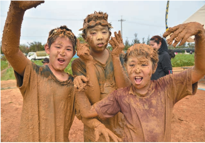
▲ たんぼ遊び体験で全身泥まみれになった男の子たち

ネイチャーみらい館のゴールデンウィークイベントとしてすっかり定着した金武町たんぼまつり。5月3日に開催された今年は天気にも恵まれ、会場は訪れた親子連れなどでにぎわいました。