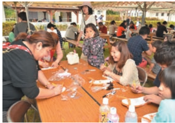
▲ 島ぞうり彫り込み体験