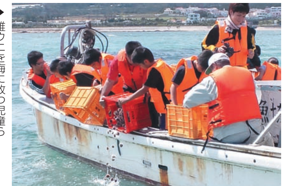
▶稚ウニを海に放つ児童ら

5月14日、漁獲高の増加を目的に町が毎年実施している稚魚放流事業が行われました。中川小学校6年生の9人も船に乗り込み、社会学習として同事業に参加しました。船は金武漁港を出港し、屋嘉沖・伊芸沖の藻場でシラヒゲウニの稚ウニを5千匹ずつ（合計1万匹）放流しました。放流に参加した児童らは、初めての作業に戸惑いながらも、最終笑顔で取り組んでいました。