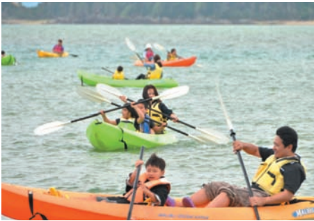
▲ 親子でぶかぶか、カヌー体験

看板プログラムの「たんぼ遊び体験」のほかにも、カヌー体験、流しそうめん体験、耕作体験など、用意されたプログラムは多種多様。参加者らはこのイベントでしか味わえない体験でゴールデンウィークを満喫していました。