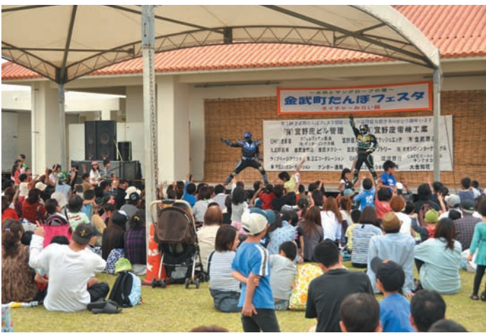
▲ 大盛況の龍神マブヤーショー