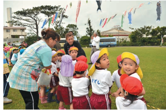
▲ロープを引っ張ってこいのぼりを掲げる子どもたち

5月1日、総合保健福祉センター中庭でこいのぼり掲揚式が行われました。ときおり小雨がぱらつくあいにくの天気でしたが、「こいのぼり」の歌を歌う保育園児たちの元気な声は、お厚い雲を吹き飛ばすかのようでした。