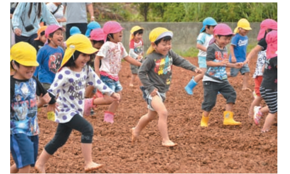
▲先生たちが種を植えた土の上を走って踏み固める

みんなで歌いながらロープを引っ張ると、ひととき大きなこいのぼりが総合保健福祉センターの屋根に高く上がりました。こいのぼり掲揚の後、子どもたちはふれあい福祉農園に移動し、ひまわりの種まきを行いました。