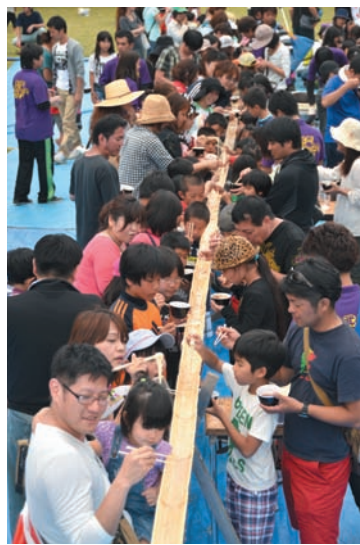
▲ 全長50メートルの流しそうめん!

YouTube 金武町公式 YouTube「雄飛チャンネル」で動画をご覧になれます。 http://www.youtube.com/user/kintown11