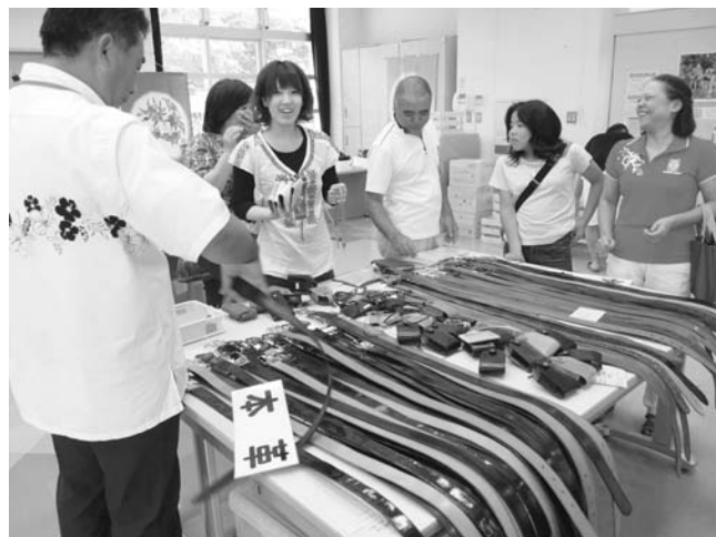
▲ 昨年の矯正展の様子