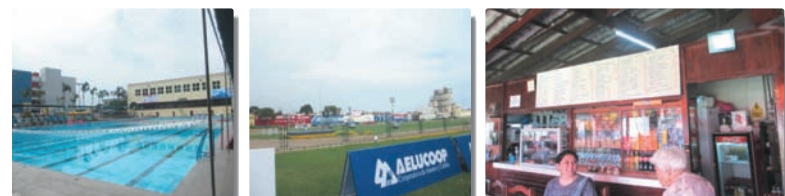
▲AERU。日系人だけが利用できる施設。学校、球場、プール等がある。