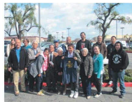
▲金武町人会の皆さんと

ペルー ペルーでは4日間と短い滞在期間でしたが、充実した日々を過ごすことができました。ペルーで感じたことは、海、山、街の3つを同時に感じる事ができるということでした。また、日系人会館や沖縄県人会館でも充実しているなど感じましたが、それ以上にAERU(左の写真参照)には圧倒され、日系人の凄さと活躍が感じられました。ペルーでの市街見学では歴史や文化を学ぶことができました。