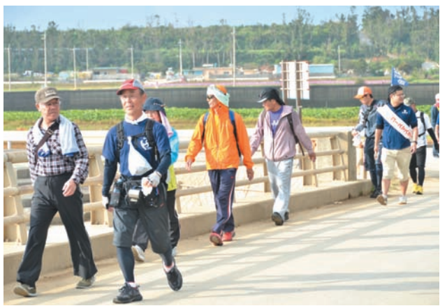
▲ 田芋畑を背に億首川のマングローブを眺めながらウォーク

8種類設定されたコースのうち、金武町を通過したのは「金武湾北部ルート・田芋畑とマングローブや海岸線を楽しむコース」。26キロの同コースには76人がエントリーし、金武町の風景を楽しみながら心地よい汗を流しました。