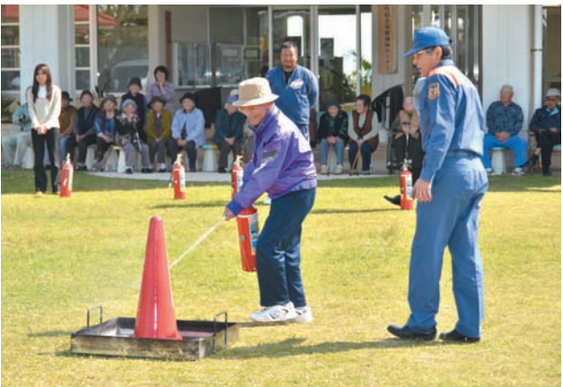
▲ 消防士から消火器の使い方を教わる利用者

大きなジャガイモを見つけると、「すごい！」「おっきい！」と大はしゃぎ。収穫がすべて終わると、ちょうどお昼時。子どもたちは総合保健福祉センター中庭に移動して、収穫したジャガイモを使ったカレーライスを青空の下ではおぼり、おともだち同士で収穫の喜びを分かちあいました。