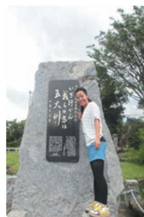
▲ブラジル沖縄文化センター100周年記念石碑前にて

私が移民や南米に興味をもったきっかけは、祖母がペルー生まれであることや、中学2年生の時に参加した移民体験航海事業、そしてこれまでの海外での経験があったからです。 また、平成23年度に金武町役場企画課で働く機会をいただき、世界のウチナーンチュ大会や町主催のシマヌチュ大に携わるなかで、海外移住者子弟等研修生とも関わる事ができて、さらに南米や南米の移民事情などに深く興味をもつようになりました。 この事業に参加できたことにとても感謝しています。この経験を活かし、海外との懸け橋になれるような人になりたいです。