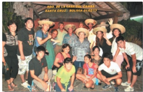
▲ボリビア町人会のみなさんと

ボリビア ボリビアにある「コロニアオキナワ」では、「沖縄」を感じることができました。日本語教育が行われていることから、若い世代にも日本語が通じ、中には方言を理解できる人もいました。