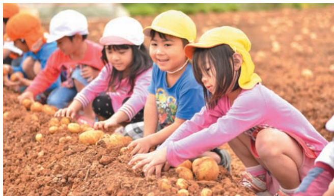
▲ 大きいジャガイモ見つかるかな？

子どもたちは、トラクターが土の中から掘り起こしたジャガイモを、両腕で抱えるように拾い集めました。