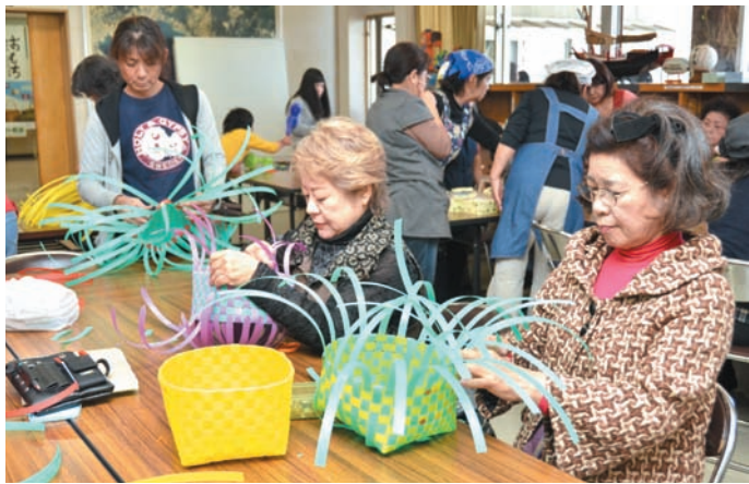
▲ PPバンドでかごを作る女性ら

館内では、同区の学童や婦人会が制作した書道や紅型などの作品展示が行われたほか、コサージュ作り教室やクラフトかご作り教室が行われ、熱中する女性らの姿が見られました。