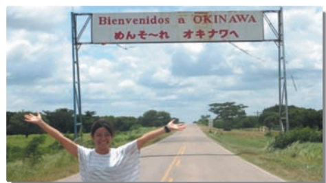
▲もう一つのオキナワに到着！

ボリビア ボリビアにある「コロニアオキナワ」では、「沖縄」を感じることができました。日本語教育が行われていることから、若い世代にも日本語が通じ、中には方言を理解できる人もいました。