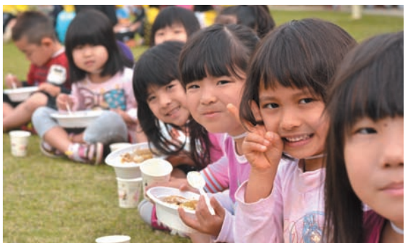
▲ カレーをほおぼる子どもたち

大きなジャガイモを見つけると、「すごい！」「おっきい！」と大はしゃぎ。収穫がすべて終わると、ちょうどお昼時。子どもたちは総合保健福祉センター中庭に移動して、収穫したジャガイモを使ったカレーライスを青空の下ではおぼり、おともだち同士で収穫の喜びを分かちあいました。