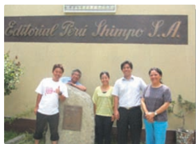
▲日系新聞「ペルー新報」にて

ペルー ペルーでは4日間と短い滞在期間でしたが、充実した日々を過ごすことができました。ペルーで感じたことは、海、山、街の3つを同時に感じる事ができるということでした。また、日系人会館や沖縄県人会館でも充実しているなど感じましたが、それ以上にAERU(左の写真参照)には圧倒され、日系人の凄さと活躍が感じられました。ペルーでの市街見学では歴史や文化を学ぶことができました。