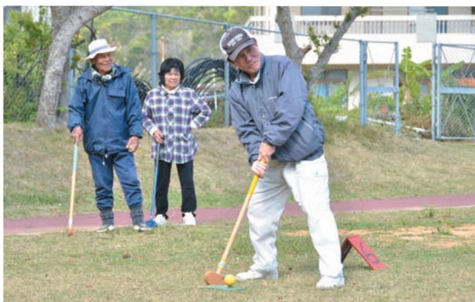
▲ グラウンドゴルフに興じる区民ら

同区では、災害発生後に公民館を避難所として利用することを想定し、老人会・婦人会・成人会・青年会・子ども会が、雑炊やすいなどの炊き出しを行うといった独自の取り組みを行いました。館内では、正しい姿勢で歩くことによりエクササイズにもなるという「ポスチュアウォーキング」の体験