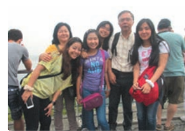
▲ブラジルで会った親戚の皆さん