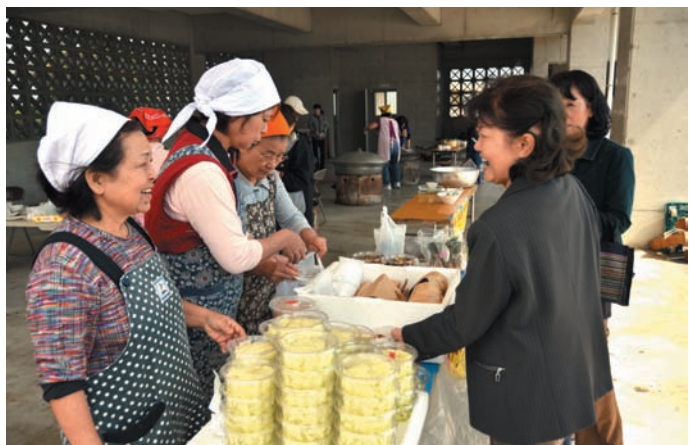
▲ 手作りの漬物などを販売した婦人会

教室が行われました。幅広い年齢層の男女が参加し、講師の指導を受けながら心地よい汗を流しました。