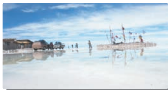
▲「世界最大の鏡」ウユニ塩湖

三線やエイサーをしている若者も多く、ウチナーンチュであることに誇りをもち、沖縄の言語や文化、伝統が世代を超えても引き継がれていることを感じました。