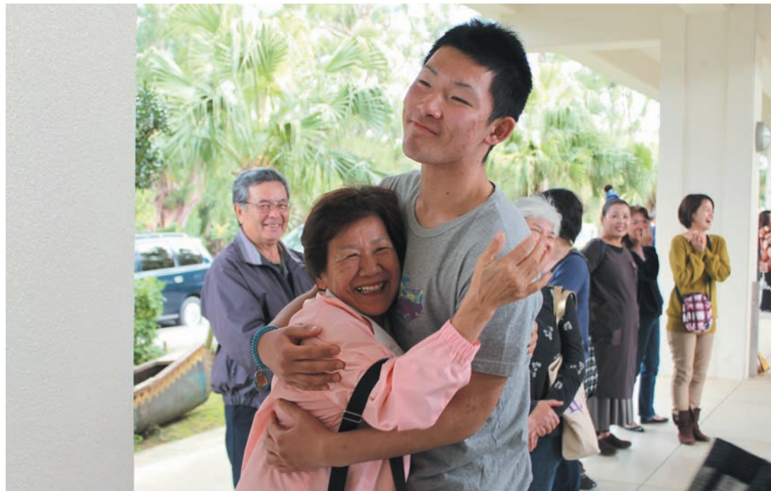
▲修了式で受け入れ民家のお母さんと抱き合い、別れを惜しむ生徒