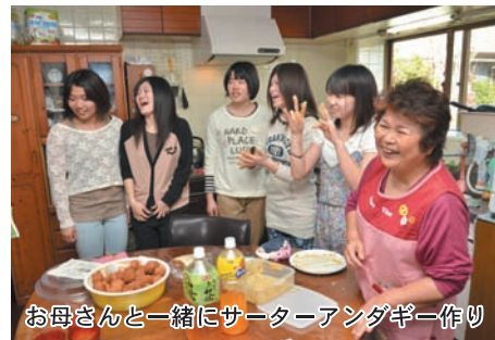
お母さんと一緒にサターアングギー作り