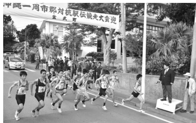
▲初日後半、中学生勝負となる9区のスタート

1月26日と27日の両日、第36回沖縄一周市郡対抗駅伝競走大会(主催:沖縄陸上競技協会)が開催されました。初日前半のゴール地点と後半のスタート地点となった町役場前は、選手らを応援しようと集まった人でにぎわいました。 町役場前に張られたテープをトップで切ったのは八重山郡チーム。背後から距離を詰める国頭郡チームを振り切り、ゴールすると同時にその場に倒れ込みました。 国頭郡チームは、その後も八重山郡チームと熱戦を繰り広げ、初日後半をトップで終えましたが、2日目に八重山郡チームに逆転され、惜しくも2位となりました。