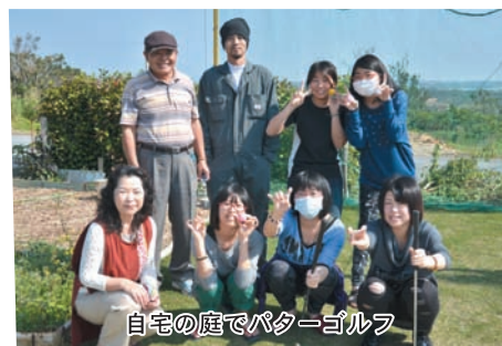
自宅の庭でバタゴルフ