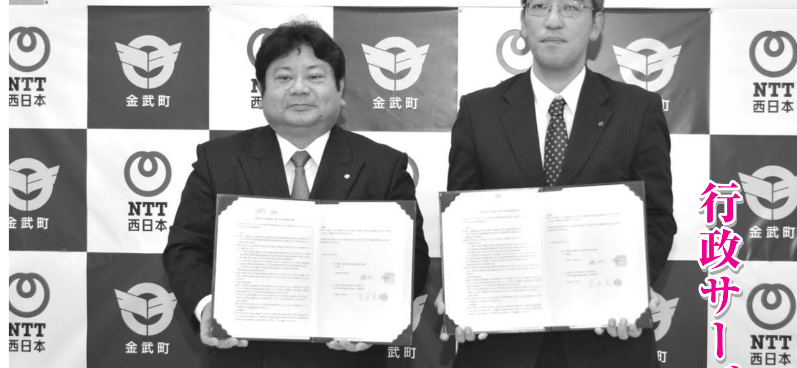
▲ 協定書に署名・捺印した儀武町長と兒玉支店長