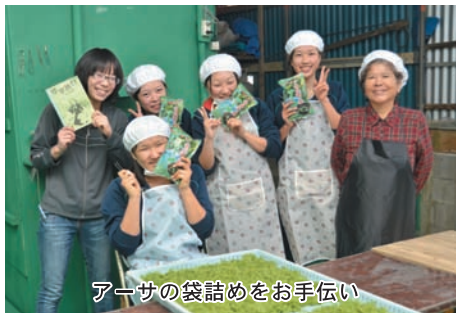
アサの袋詰めをお手伝い