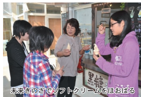
未来ぎのぎでソフトクリームをほおぼる