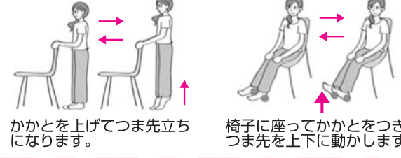
かかとを上げてつま先立ちになります。椅子に座ってかかとをつき、つま先を上下に動かします。

各区公民館では、毎日を元気に過ごすための健康教室（ちゃ〜がんじゅう教室）で筋力トレーニング、認知症予防の体操等を行っています。興味のある方は下記までお気軽にご連絡ください。