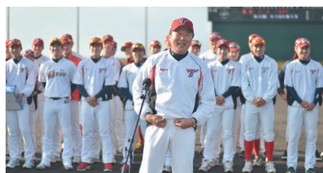
▲ 歓迎セレモニーで顔をほころばせるソン監督

数々のプロ球団がキャンプで来沖する2月。町にも阪神タイガース(2月1日〜10日)、韓国の起亜タイガース(2月11日〜15日)、楽天イーグルス(2月16日〜24日)が続々と訪れ、金武町ベースボールスタジアムで練習を行いました。2月12日には、起亜タイガースの歓迎セレモニー