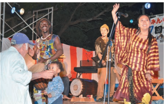
▲ アフリカ民族音楽で会場はヒートアップ!

金武大橋下(旧国道沿い)の桜並木で2月2日、第7回億首サクラ祭り(主催・同実行委員会)が開催されました。同祭りは毎年、金武中学校22期生が中心となって企画運営を行っているイベント。特設ステージでは、琉球舞踊からオペラ、バンド演奏にアフリカ民族音楽まで、バリエーション豊かなパフォーマンスが披露され、訪れた人々を楽しませました。