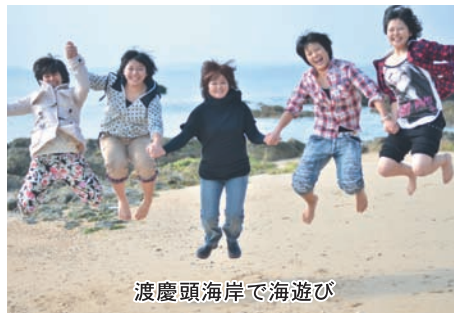
渡慶頭海岸で海遊び