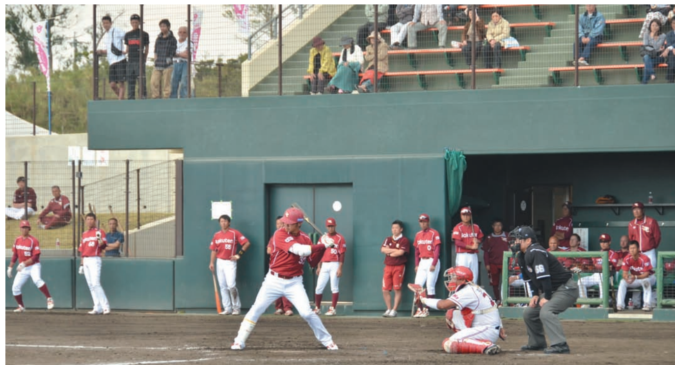
▲ 多くの野球ファンが見守った楽天イーグルスと起亜タイガースの練習試合(2月21日)

YouTube 金武町公式YouTube「雄飛チャンネル」で動画をご覧になれます。 http://www.youtube.com/user/kintown11