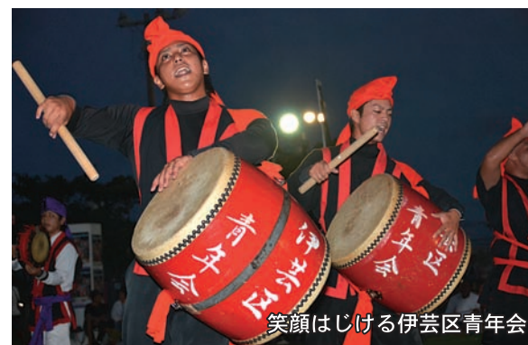
笑顔はじける伊芸区青年会