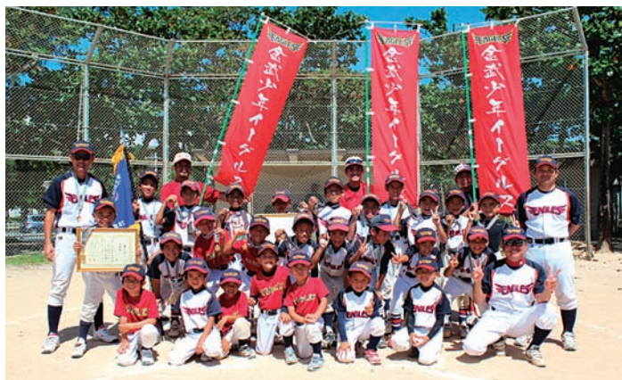
▲誇らしげに優勝旗を掲げる金武少年イーグルスの選手たち

月8日、名護少年野球場で行われた第1回北部地区学童ジュニア軟式野球大会（琉球セメント旗争奪軟式野球大会）で、金武少年イーグルスが宜野座フアイターズとの決勝戦を2-0で制し、記念すべき初代チャ