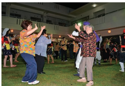
▲「唐船ドーイ」に合わせてカチャーシー

さん（94）は、「子どもの頃に村のお年寄りから習った」という金武・並里の民謡「ムスナイナイ」を見事に歌い上げ、会場を大いに沸かせました。同まつりは金武区青年会のエイサーで締めくくられました。最後の曲「唐船ドーイ」が鳴らされると、思わず立ち上がってカチャーシーを舞う元気なお年寄りの姿も見られました。