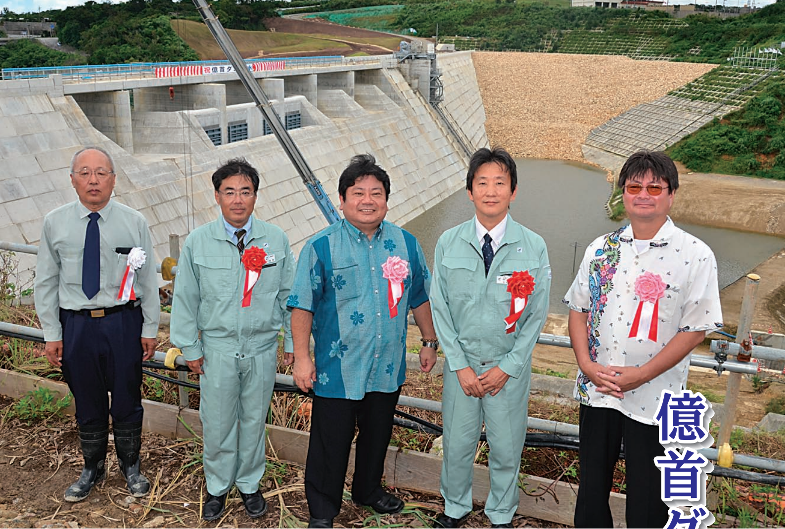
▲水がたまり始めた億首ダムを背に、福原JV所長・安仁屋北部ダム事務所副所長・儀武町長・北牧北部ダム事務所所長・仲里議長（左から）