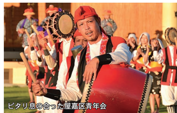
ピタリ息の合った屋嘉区青年会

第13回金武町青年エイサーまつり 中川地区公民館隣の中川近隣公園で9月2日、第13回金武町青年エイサーまつり(主催・町青年団協議会)が開催され、町内外から多くの観客が詰め掛けました。出演した各団体は、それぞれ個性あふれるエイサーを披露し、会場を沸かせました。