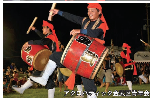
アクロバティック金武区青年会