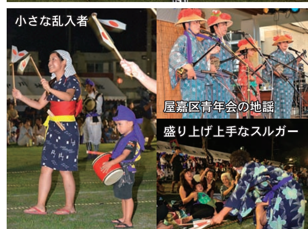
小さな乱入者 屋嘉区青年会の地謡 盛り上げ上手なスルガー