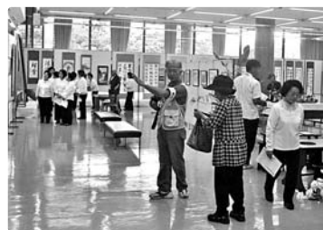
▲展示会場の様子(昨年度)