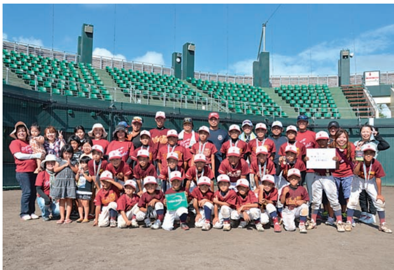
▲優勝メダルを手に笑顔の金武ヴィクトリーキッズの選手たち