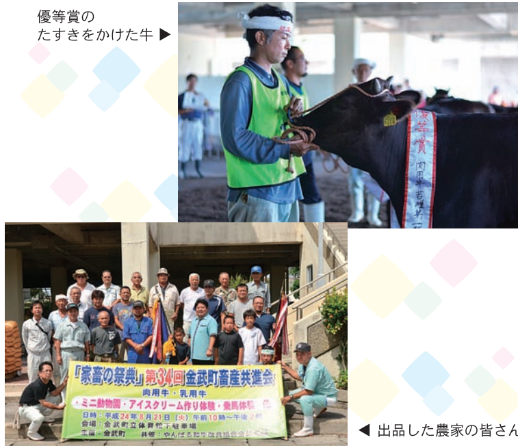
◀出品した農家の皆さん

44頭が集められ、その発育具合などを競い合いました。また会場では、ヤギやウサギなどに触れるミニ動物園も設けられ、訪れた子どもたちを喜ばせていました。