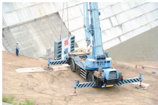
▲仮排水口のふたを閉じるクレーン