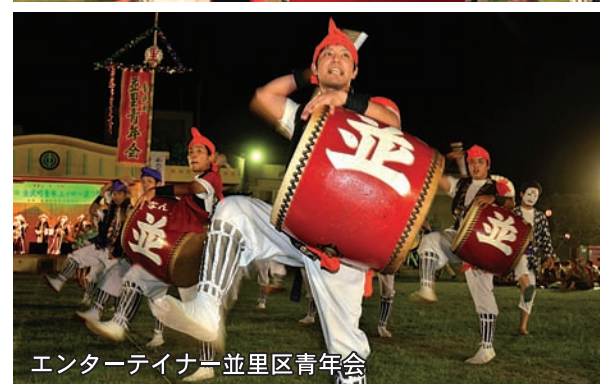
エンターティナー並里区青年会