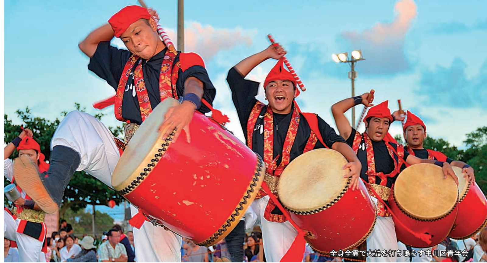
全身全霊で太鼓を打ち鳴らす中川区青年会

族から沖縄のことを聞き、行きたいと思っていたのと、もううれしい」とふるさと「金武町を初めて訪れた喜びを語りました。研修生たちはそれぞれの親族が待つテーブルに就き、祖父母の話などに花を咲かせていました。