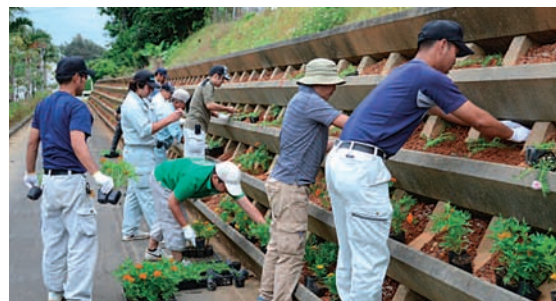
▲ 作業の様子（金武町斎斎場前花壇）

もし、町内でタイワンスジオを見つけたら、町役場住民生活課環境係（NTT 968-2460・有線 8-2460）までご連絡を！