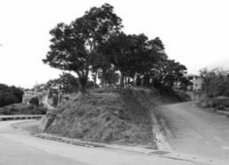
▲ 牛納棒 (並里区)