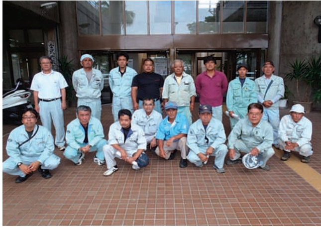
▲ ボランティアに参加した水道事業者の皆さん

町役場および町社会福祉協議会の協力のもと、町内に一人で暮らすお年寄り9世帯に出向き、水道施設の点検・補修を無料で行ったこの活動には、次の水道事業者が参加しました。