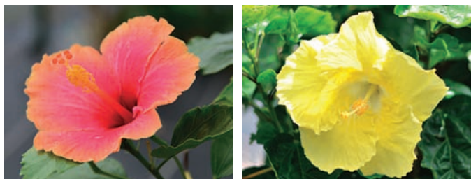
▲ さまざまな品種のハイビスカスなどが見られる