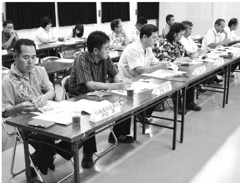
▲ 町職員と意見を交わす地域の皆さん（金武区）

長、行政委員、各種団体等）と町長、町役場の職員とが話し合う場です。以下に、各区で話し合われた内容の主なものを掲載します。