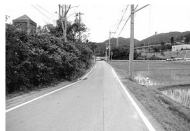
▲町道屋嘉9号（屋嘉区）

④県からの調査関係について 【屋嘉区】県からの調査ものが直接区へ依頼されることがある。どのような方法で調査を行っているのか、どのような内容を調査しているのか分からないことがあるので対応策を伺いたい。 【町】役場で調査内容を把握し、区へ説明して調査するよう対応していく。 ⑤屋嘉第2団地付近の沿道の木について 【屋嘉区】屋嘉第2団地付近の道路沿いに木が植えられているが、伸び放題になっっており景観が悪いため対応してほしい。 【町】剪定を行っていく。