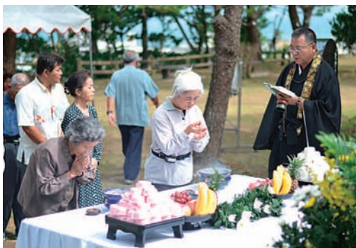
▲ 伊芸区戦没者慰霊祭 平和への思いは一つ…

伊芸区では6月16日、さくまつ公園にある平和の塔前で戦没者慰霊祭が執り行われました。区長や各団体のほか、多くの区民が参列し、戦禍の犠牲となった76人の区出身者の魂を慰めました。