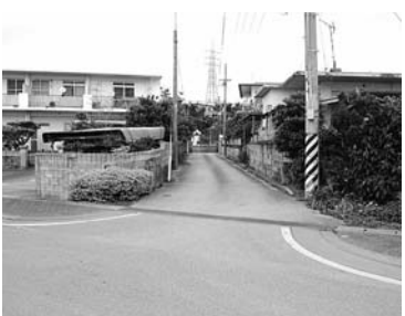
▲ 浜田排水路 (金武区)