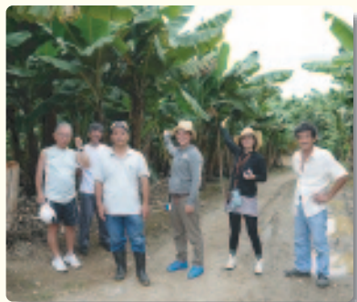
▲バナナ農園にて (サンパウロから車で約3時間)