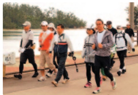
▲ 億首川沿いを歩く参加者ら

金武湾北部ルートには、7歳から76歳まで、両日合わせてのべ109人のエントリーがありました。参加者たちは、福花原の田園風景や億首川マングローブなど、水と緑豊かな金武町の観光資源を楽しみながらさわやかな汗を流しました。