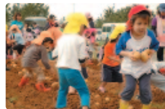
▲ ジャガイモを拾い集める子どもたち

収穫後は、同農園で収穫されたジャガイモを使ったカレーライスが振る舞われ、園児たちは自分たちが植えたジャガイモを満足そうにほおばっていました。