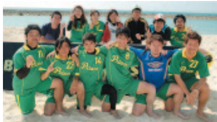
▲ 金武町からは「プリンス」がエンジョイクラスに出場