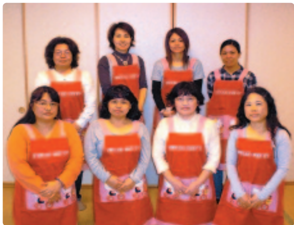
▲ 私たちが母子推進員です!