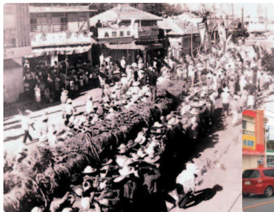
▲ 記念通りに向かう金武区陣営