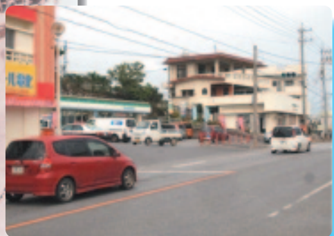
▲ 同じ場所の現在の街並み

昭和47(1972)年8月27日、沖縄の本土復帰を記念した金武・並里大綱引きが9年ぶりに行われました。