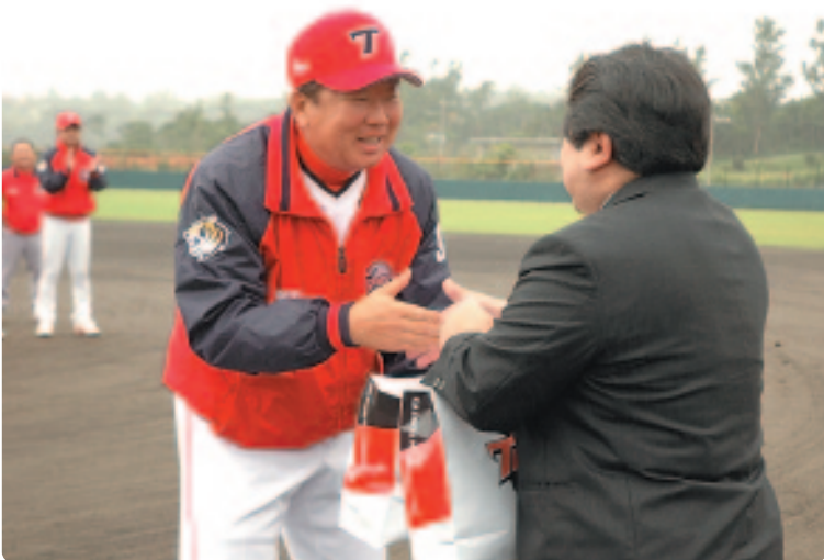
▲ 儀武町長と握手を交わすソン監督