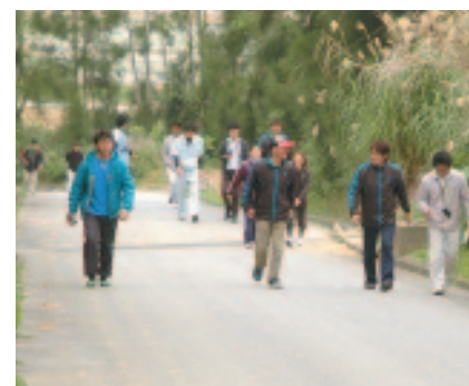
▲ 高台へ避難するスタッフら

津波警報等が発令された場合などに滞在中の利用客を安全に避難させるため、同施設スタッフを対象とした避難訓練が行われました。訓練は、金武町で震度6弱の地震が発生し、30分後に高さ5層の津波が沿岸に到達するものと想定。避難を促す館内放送が流れると、スタッフらは利用客にふんじた他のスタッフを広場に誘導。徒歩班と車両班に分かれて約800以上の高台