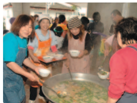
▲ 婦人会の炊き出し

また、区民自らが講師となつて、ハーブ石けん作りや竹とんぼ作りなどの体験教室も開かれました。