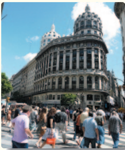
▲ブエノスアイレス市内にて

アルゼンチン ブエノスアイレス市内の沖縄県人会館では、空手や琉舞、日本語、三味線等様々な沖縄文化に関わる講座があるそうです。 また、アルゼンチンはヨーロッパのような町並みで建物全てがおしゃれでした。ブラジルで「アルゼンチンのお肉はすごいぞー」という噂は聞いていましたが、想像をはるかに上回るお肉の大きさ、厚さ、豪快さに開いた口がふさがりませんでした。