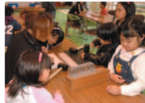
▲ 革細工づくり体験

同日には並里区でも公民館まつりが開催されました。婦人会の田芋汁、青年会のゆし豆腐、子ども会のピフシチュー、つきたてのお餅など、バラエティーに富んだメニューが振る舞われました。 また、区内の新1年生には與那城区長からランドセルがプレゼントされました。子どもたちはピカピカのランドセルをうれしそうに受け取っていました。