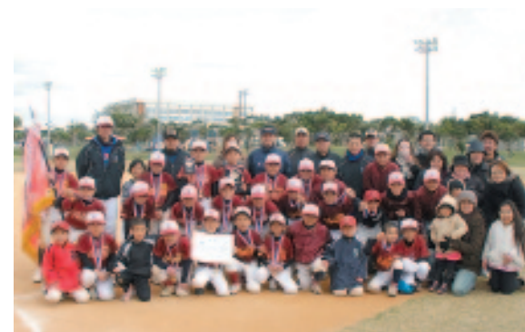
▲ 優勝旗を掲げる選手たちと父兄

2月12日、18日、19日に金武町ベースボールスタジアムを主会場に行われた「沖縄県軟式少年野球大会 第57回北部地区南ブロック予選大会」で、4区の金武ヴィクトリーキッズが優勝しました。