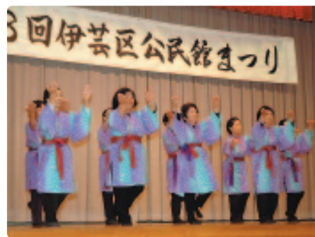
▲ 老人会の舞台発表