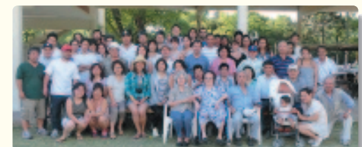
▲新年会 アルゼンチン金武町人会の皆さんと