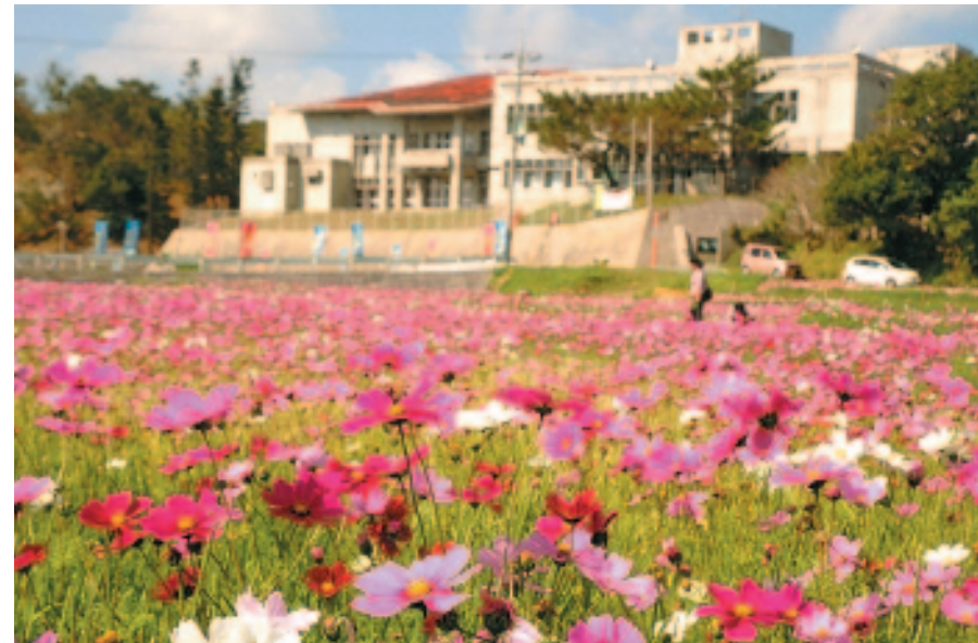
▲ 水田の土壌づくりにも貢献しているコスモス

毎年冬の風物詩となっている伊芸区のコスモスが今年も満開となりました。同区の名物となっているコスモス畑を見学しようと、町内外から今年も多くの人々が訪れました。