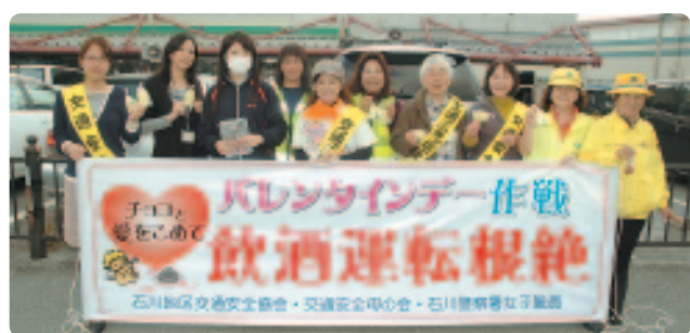
▲ バレンタインデー作戦に参加したメンバー

メンバーらが「安全運転をお願いします」と声を掛けながらチョコレートを手渡すと、ドライバーらは「ありがとう、頑張って」と応じました。