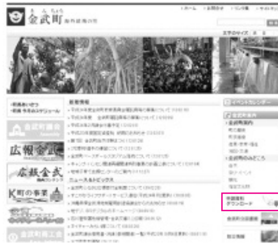
様式のダウンロードはこちらをクリック

金武町公式ホームページ ( http://www.town.kin-okinawa.jp/ )