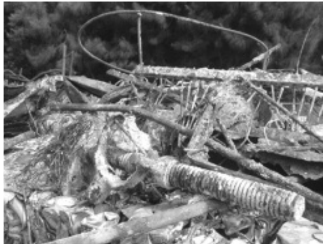
▲ 燃やせるごみの中に入っていた金属類。機械故障の原因になります

清掃センターへ持ち込まれた可燃ごみに分別がされていないごみが混入し、機械の故障の原因となっています。修理にかかる費用は町民の皆さまの大切な税金から支出されることとなります。ごみの出し方を今一度確認し、正しく分別して出してください。