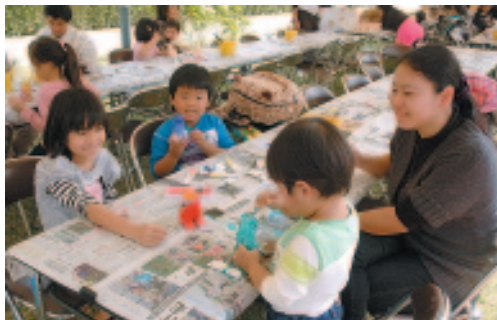
▲ シーサー色付け体験

「田芋をもっと知りタイモん」のキャッチコピーを冠した同まつりでは、田芋汁や田芋空揚げなどの料理が販売されたほか、田んぼに入って田芋を収穫する体験が行われるなど、町特産の田芋をアピールするイベントが行われました。