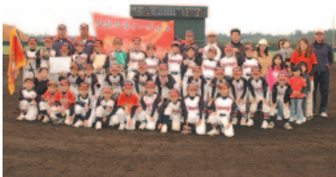
▲優勝した金武少年イーグルスの選手たちと父兄

決勝では金武少年イーグルスと金武ヴィクトリーキッズが対戦。接戦の末、3-2で決勝を制し、町内6チームの頂点に立ったのは少年イーグルスでした。