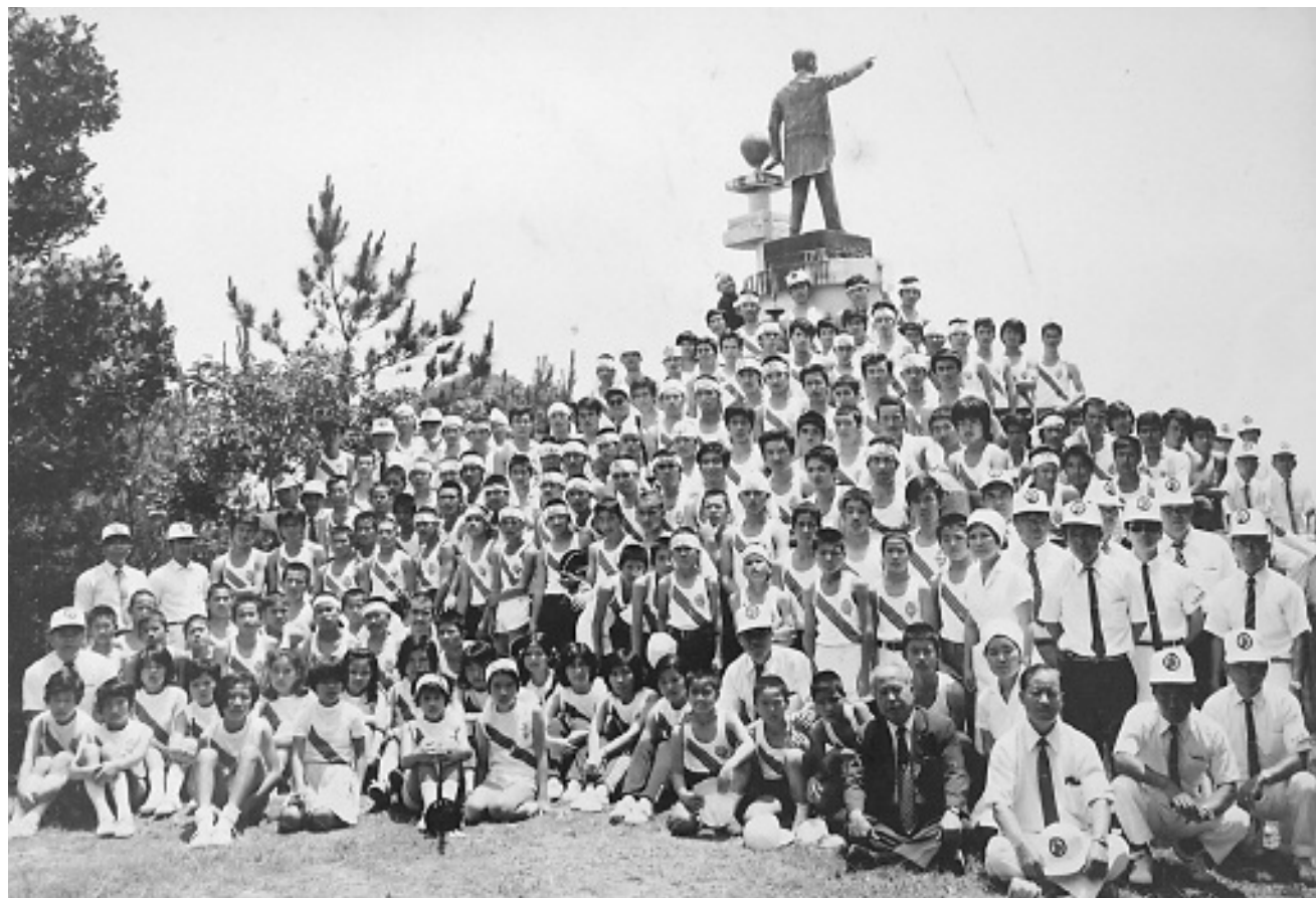
▲ 若夏国体炬火リレー（屋嘉～中川区間）に参加したランナーたち

この国体の開会に先立ち、炬火リレーが行われ、同年4月28日に金武村を通過しました。のりレーに参加したのは、村内の中学生以上の若者たちで、屋嘉の村境から中川の村境まで、たいまつを走りました。