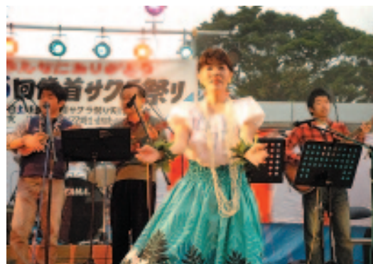
▲ハワイアン生演奏によるフラダンス