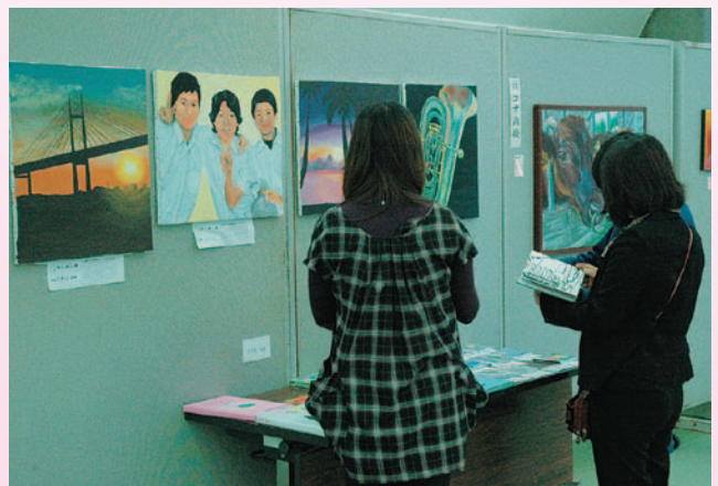
▲真剣な表情で作品を見つめる来場者