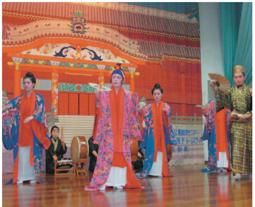
▲新年会でかぎやで風を披露した元研修生のみなさん