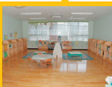
えほんのへや(幼稚園)