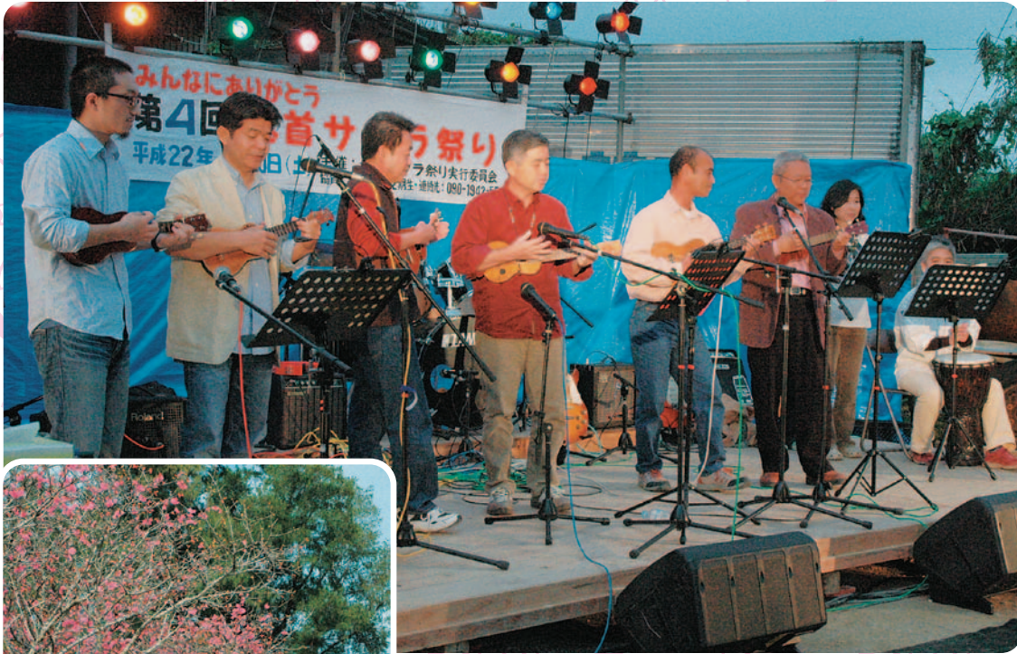
▲舞台上披露されたウクレレ演奏