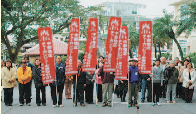
▲役場駐車場で行われた車両パレード受け入れセレモニー

2月18日、中部地区チャーガンジューおきなわ21推進大会が催され、車両パレードが実施されました。