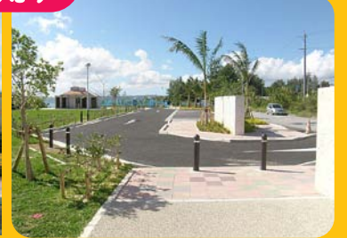
駐車スペース・トイレもあります