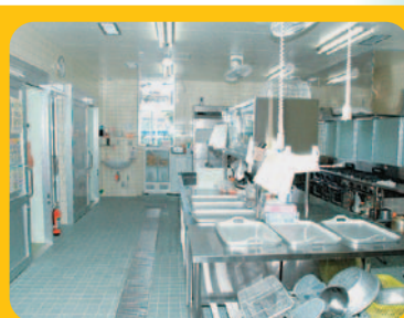
おいしい給食がつけられています