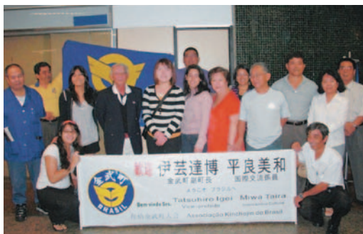
▲空港でたくさんの方が歓迎してくれました

二十四日の町人会主催の新年会では、約二百人の町人が集まり、過去の研修生によるかぎやで風や、貫花、三線演奏、ライブ等、青年部が中心となって会場を盛り上げました。