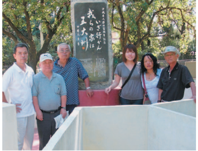
▲アルゼンチンに贈られた移住百周年記念記念石碑