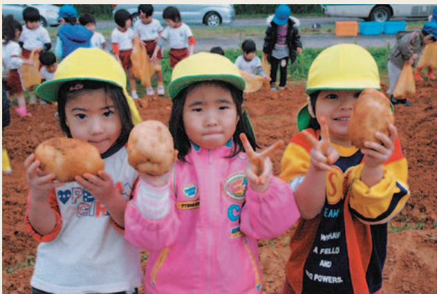
▲おっきいじゃがいも発見!

収穫後には町総合福祉センターで農園で収穫したじゃがいもを使用し、作られたカレーライスが用意され、園児らはおいしそうに食べて笑顔を見せていました。