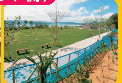
海を見ながらひなたぼっこ…