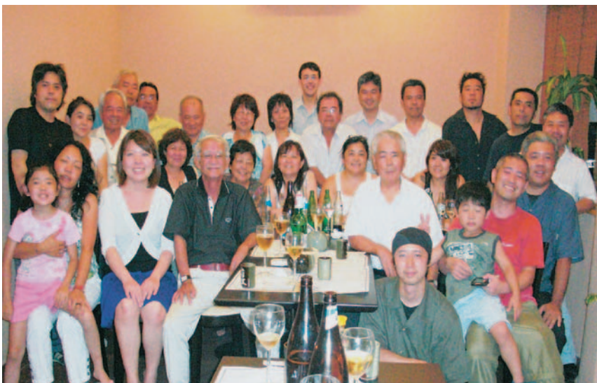
▲アルゼンチン金武町人会のみなさんと