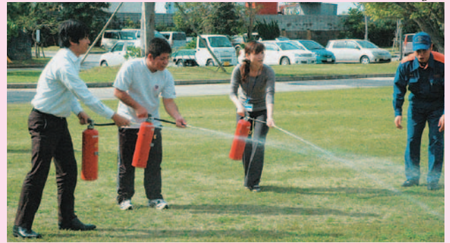
▲消火器を使用するの初期消火訓練

一月九日、町総合保健福祉センターで職員、利用者者を対象とした防災避難訓練が行われました。今回は二階調理室で火災が発生したことを想定に行われ、火災報知機が作動するのを合図に職員が火災現場を確認、初期消火を試みるが断念し、職員及び利用者者を安全な場所まで避難誘導する一連の作業が確認されました。避難後には金武地区消防衛生組合による消火器や消火栓の使用方法の講習が行われ、職員が火災を想定し実践しました。参加した職員は「実際に火災が起きた場合、落ち着いて対応できるように訓練を継続したい。利用者者に安心して利用してもらえぬ環境をつくりたい」と語りました。