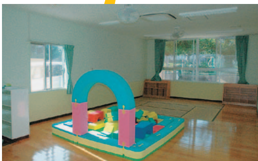
子育て支援センターも併設