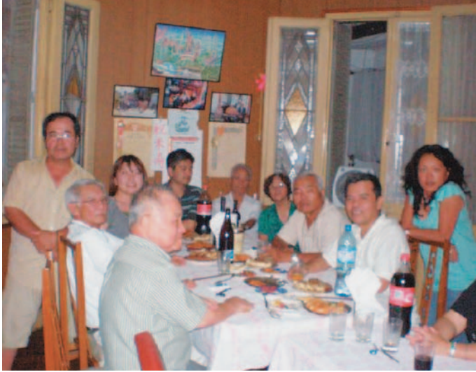
▲仲間さん宅にてアルゼンチン料理のおもてなし