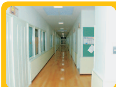
幼稚園から保育所までのなが～いろうか