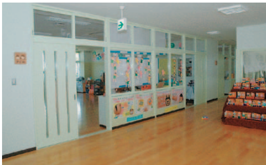
広々とした入口ホールと教室

昨年十二月に完成した金武保育所と金武幼稚園が併設された幼保一体施設をご紹介します。