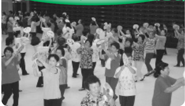
▲うちわを手に踊りを楽しむ参加者ら