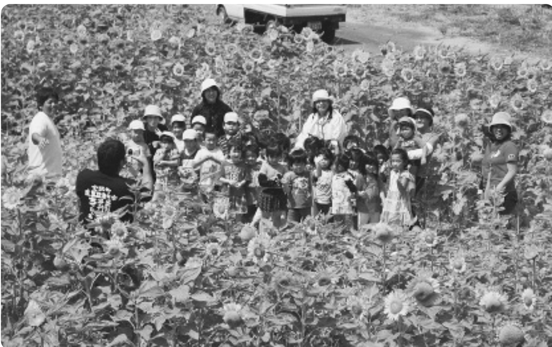
▲ひまわり畑の中の園児たち

七月二十二日、町内の保育園児を集めて、ひまわり鑑賞会(主催:町社会福祉協議会)が、ふれあい福祉農園で行われました。 ひまわりは夏の太陽の日差しを受けて、いつの間にか園児たちの背を追い越し、太陽に向かって大きな花を咲かせていました。 園児たちは農園に作られた「ひまわりの迷路」の中を駆け回り、中には行き止まりに当たってしまう園児の姿もありました。 迷路で遊んだ後には、抱えきれないほどのひまわりを保育園に持ち帰りました。