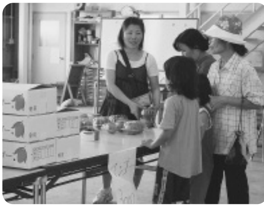
▲美味しそうな農産物を品定めするお客さん