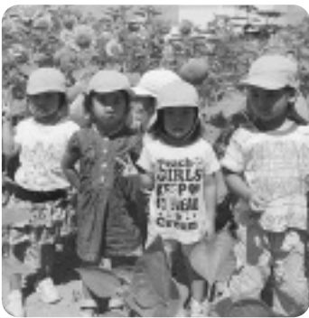
▲ひまわりみたいに大きくなります!