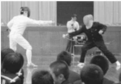
▲フェンシング体験をする生徒

宜野座高校・沖縄工業高校・南部商業高校の教諭が講師として学校訪問し、競技種目・剣の種類と有効面の違いなどの紹介をしました。