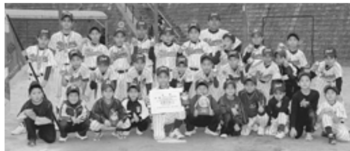
▲優勝した金武ジュニアスターズ