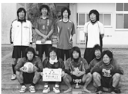
▲優勝した宜野座高校