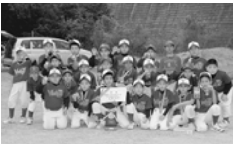
▲準優勝 金武ヴィクトリーキッズ