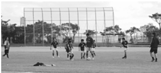
▲小学生チーム対一般チームのデモンストレーション