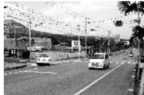
▲信号が設置されたサンヒルズ屋嘉前交差点