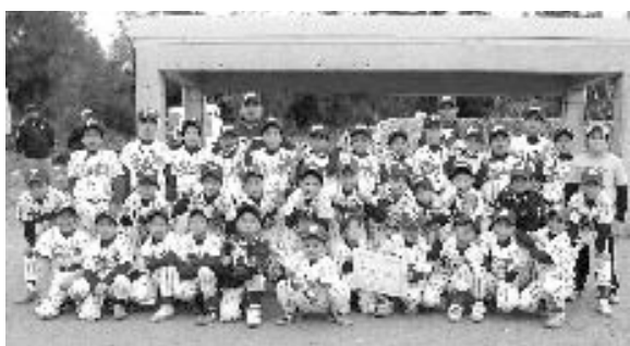
準優勝のジュニアスターズ