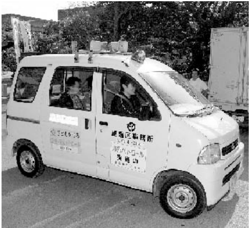
▲青色回転灯を装備した車両

登下校時における通学路の安全対策の一環として、青色回転灯装備車両の出発式(主催:屋嘉区事務所ほか)が三月三日、嘉芸小学校で行われました。 これは、回転灯を車両等に装備することにより、住民に自主