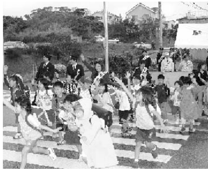
▲渡り初めを行う嘉芸小学校児童のみなさん

三月九日、金武町字屋嘉のサンヒルズ交差点前に交通信号が設置され同日、点灯式が行われました。交通信号が設置されたのは、金武町字屋嘉一七三九の二ゴールデン・サンビーチホテル西方サンヒルズ屋嘉団地入口交差点です。同交差点は、朝夕のラッシュアワーの際、サンヒルズ方面から国道に車が出にくい状態が続いているとともに、住民の増加によって歩行者の安全を確保するため強い要望で設置されたものです。点灯式では、嘉芸小学校の児童が信号の渡り初めを行い、新しい信号機の設置を歓迎しました。