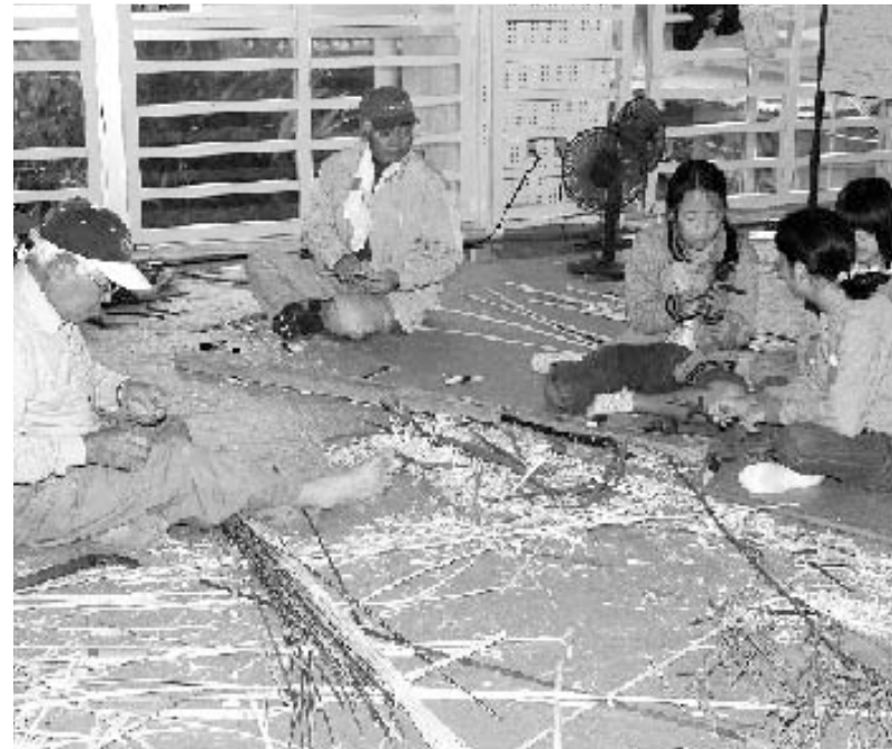
▲老人会によるパーキづくり

第十八回並里区公民館まつり(主催:同区事務所)が二月二十六日、同区公民館で行われました。会場では、子ども会による田芋販売コーナー・ふかしいも試食コーナーや婦人会による試食・販売コーナー、青年会による海水を使った豆腐づくりなど様々なコーナーが設けられました。また、駐車場では、マグロの解体ショーも行われ、解体されたマグロは区民に振る舞われました。体育館では、各種団体の一年間の活動写真や作品が展示されました。また、老人会によるパーキづくり・親子竹とんぼづくりなども設けられ、老人から子どもまで熱心に作品をつくる光景がみられました。