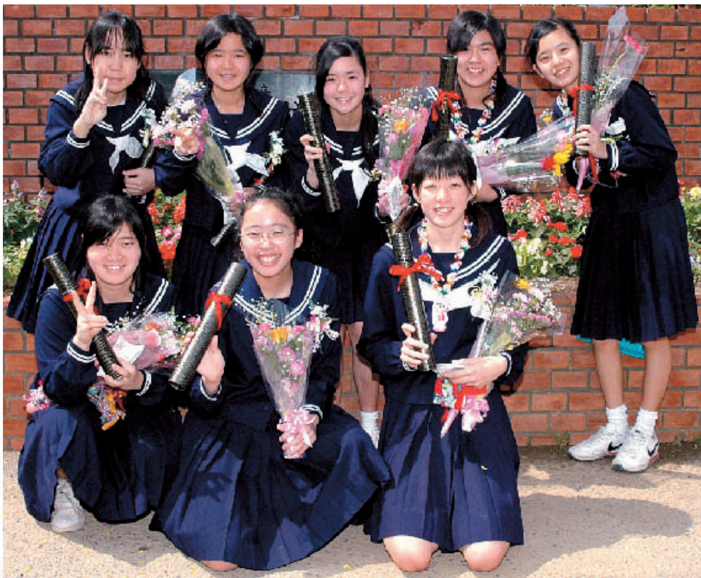
▲金武中学校の卒業式

3月は卒業シーズンです。町内の小・中学校でも卒業式が行われました。金武中学校が100名、金武小学校が73名、中川小学校が17名、嘉芸小学校が41名の児童・生徒が学び舎をあとにしました。希望を胸に母校を巣立っていく児童・生徒のスナップ集です。