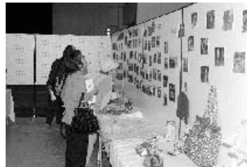
▲各団体の活動写真を見る区民

第十八回並里区公民館まつり(主催:同区事務所)が二月二十六日、同区公民館で行われました。会場では、子ども会による田芋販売コーナー・ふかしいも試食コーナーや婦人会による試食・販売コーナー、青年会による海水を使った豆腐づくりなど様々なコーナーが設けられました。また、駐車場では、マグロの解体ショーも行われ、解体されたマグロは区民に振る舞われました。体育館では、各種団体の一年間の活動写真や作品が展示されました。また、老人会によるパーキづくり・親子竹とんぼづくりなども設けられ、老人から子どもまで熱心に作品をつくる光景がみられました。