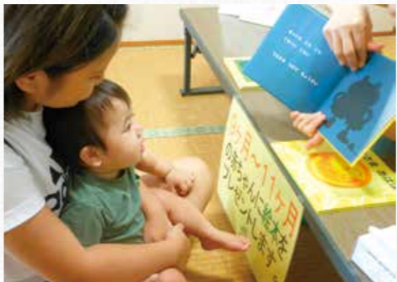
▲9~11ヶ月の赤ちゃんへ絵本を一冊プレゼント(ブックスタート事業)

一方で、昨年はウイルスに悩まされた年でした。一月八日に県内で三十三年振りに豚熱が発生し、本町においても家畜の移動制限や搬出制限により畜産農家の経営に影響を及ぼしました。その対策として現地対策本部を設置し、町役場農林水産課職員で町内養豚場周辺の消毒や、消毒ポイントの設置等を行い、町内では感染が確認されることなく沖縄県から豚熱の収束宣言が出され、感染拡大防止に貢献したとして玉城県知事より