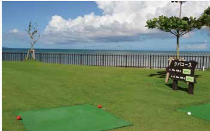
▲金武タームパークゴルフ場

今後もし引き続き町独自の子育て支援として、「子育て激励金」や「虫歯予防奨励金」の支給、乳児検診時に絵本を一冊プレゼントするブックスタート、給食費の無料化等を実施し、子どもを産み育てやすい町づくりに努めてまいります。