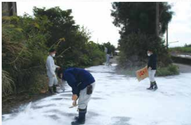
▲豚舎周辺の感染予防対策の様子

感謝状を頂きました。今後も豚熱のワクチン接種を続け、畜産業界の経営再建に取り組んでいきたいと思えます。