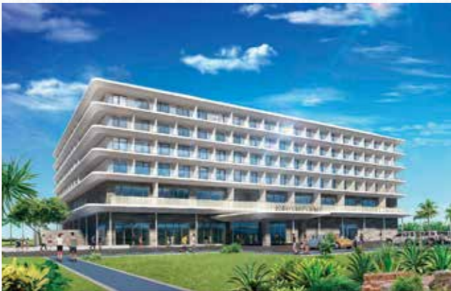
▲(仮称)金武ギンバル温泉宿泊施設

ルの建設工事が着工しています。ギンバル温泉施設が、医療・スポーツツーリズムの中心となり、町民や若者の雇用創出に繋がるよう取り組んでいきます。