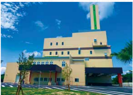
▲金武地区清掃センター

ルの建設工事が着工しています。ギンバル温泉施設が、医療・スポーツツーリズムの中心となり、町民や若者の雇用創出に繋がるよう取り組んでいきます。