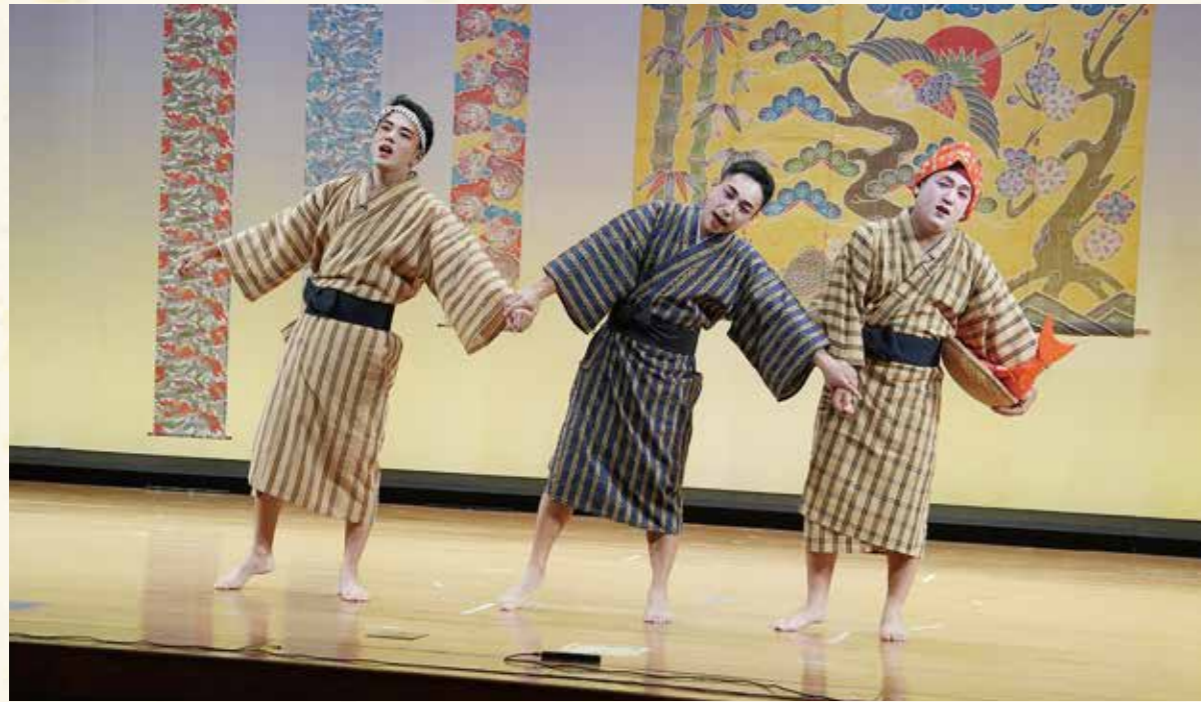
▲並里区「仲直り三良小」

10月28日、町立中央公民館で第30回金武町民俗芸能祭が開催されました。第30回の節目を迎える今回は各区や八重瀬町志多伯獅子舞保存会による演舞に加え、特別企画「映像でふりかえる30年の軌跡」として過去映像をダイジェスト版として上映し、ロビーでは「ポスターでふりかえる30年の軌跡展」を実施しました。大勢の町民が郷土の伝統芸能に触れ親しんだ秋の夕べとなりました。 次回は秋頃に屋嘉区で開催する予定です。