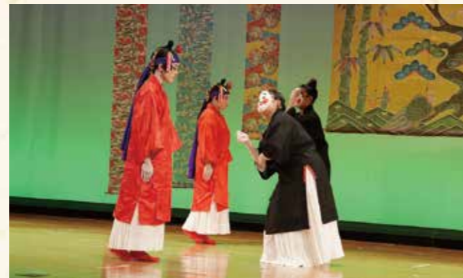
▲屋嘉区「しょんだふ」