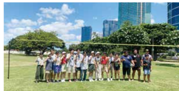
▲ハワイ金武町人会ピクニックにて