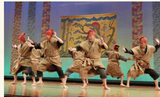
▲八重瀬町志多伯区「汗水節」