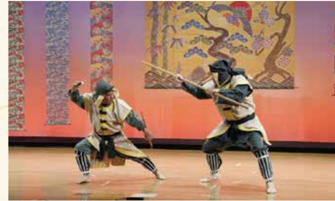
▲八重瀬町志多伯区「武の舞」