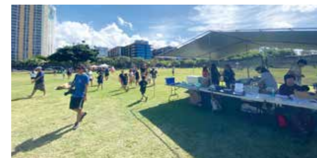
▲ハワイ金武町人会ピクニック風景