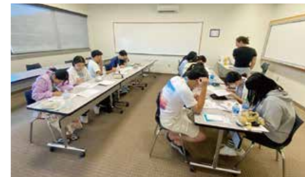
▲ハワイ東海国際大学授業中