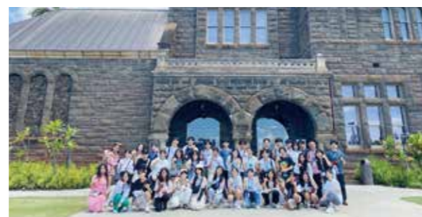
▲ビショップミュージアム前で宜野座村北谷町と