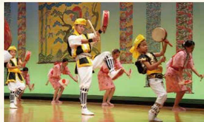
▲中川区「源原エイサー」