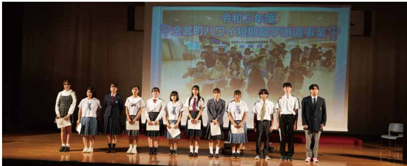
関連(8ページ~11ページ)