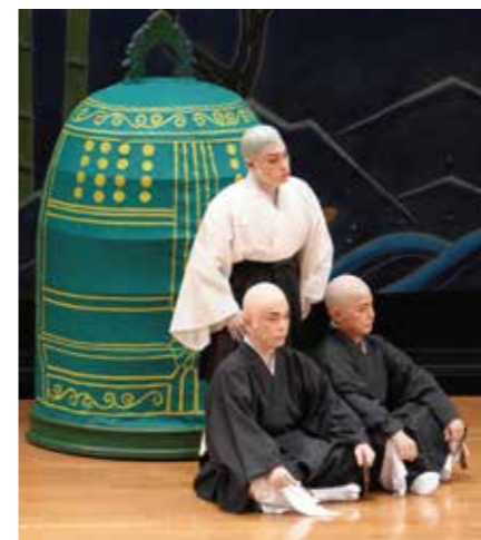
しゅうしんかねいり 【執心鐘入】