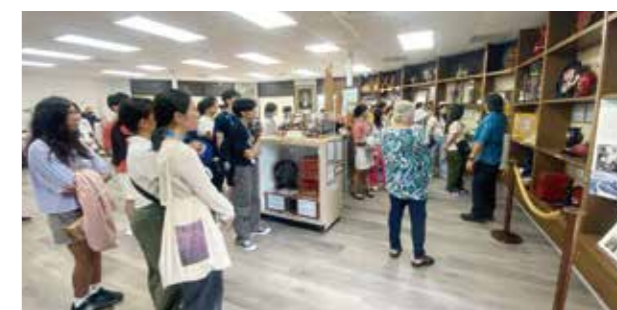
▲ハワイ沖縄センター