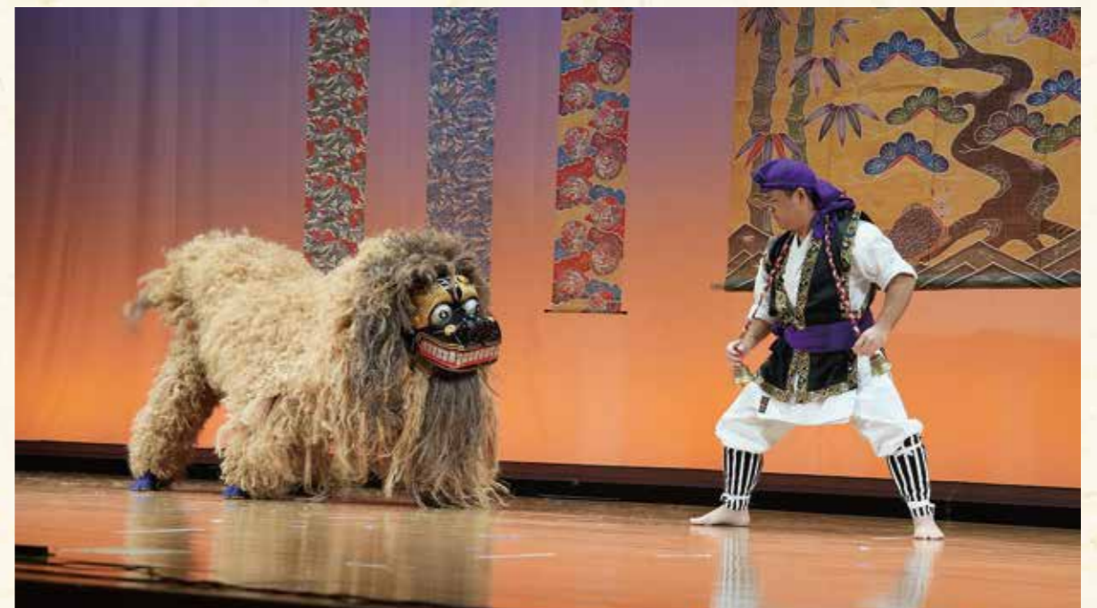
▲金武区「ミルク〜獅子舞」