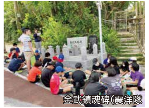
金武鎮魂碑(震洋隊)