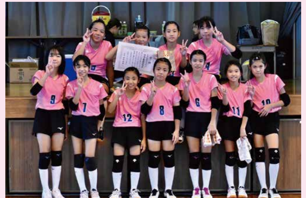
△Cブロックで優勝した金武クラブ

Cブロック決勝では屋部ローリングスAと対戦し、1セット目は19-21で取られたものの、2セット目3セット目を連取し優勝しました。