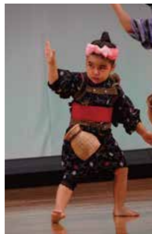
子ども芸能発表会