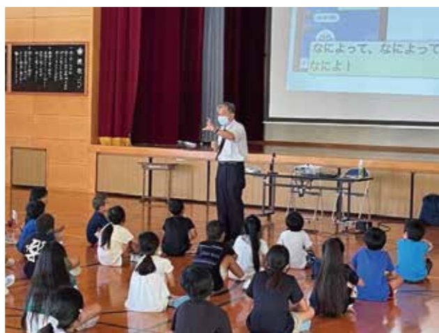
▲中川小学校で講演する様子

また、スマホ等を長時間使用した脳への悪影響を現した状態を図で表し、驚きの声が上がっていました。