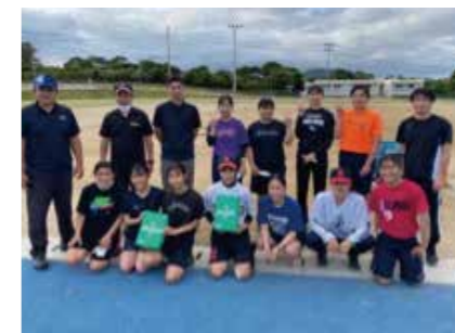
12.宜野座高校・金武中・宜野座中合同ソフトボールチーム