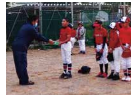
9.金武少年イーグルス