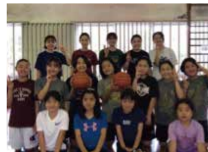
4.嘉芸小ミニバスケット