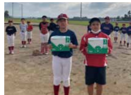
7.金武雄飛 8.金武ヴィクトリーキッズ