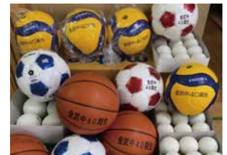
今回寄贈されたボール