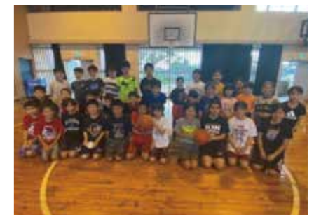
3.金武小ミニバスケット