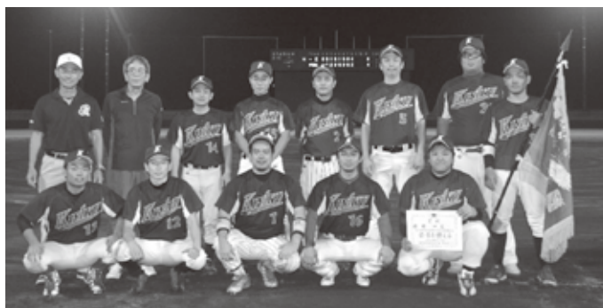
▲優勝の一区チーム

決勝戦に駒を進めた一区チームと伊芸区チームが対戦し延長の末6対4で一区チームが接戦を制し31年ぶり5回目の優勝に輝きました。