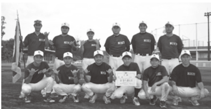
▲優勝の二区チーム

決勝戦は二区対屋嘉区で行われ二区チームが12対2で圧倒的な強さを見せ、2年ぶり18回目の優勝に輝きました。