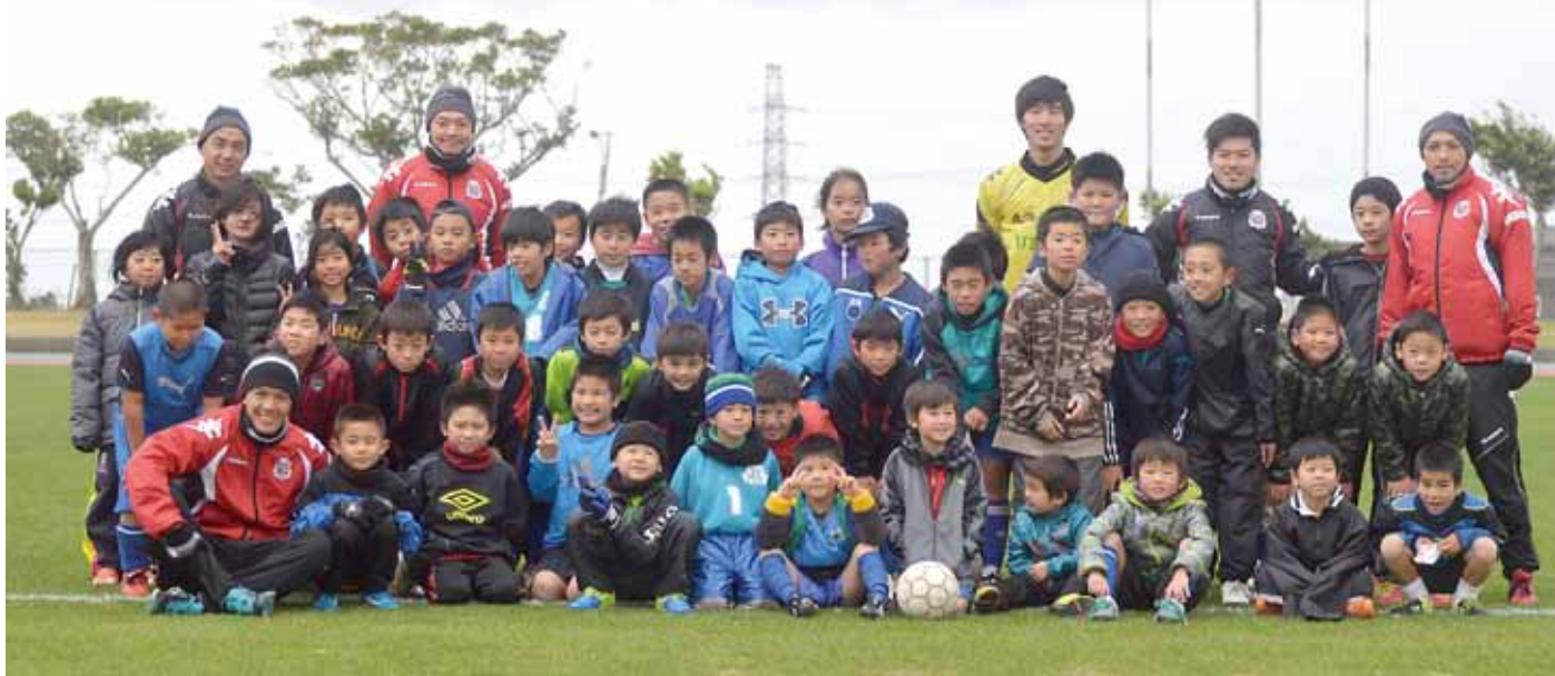
▲サッカー教室に参加した子ども達とコンサドーレ札幌の選手のみなさん

1月24日、町内小学生サッカーチームを対象に、コンサドーレ札幌による少年サッカー教室が開催されました。