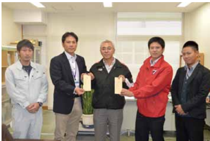
▲寄附を手渡した実行委員会のみなさん