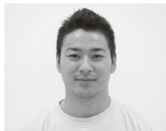
高校総体事務局 平 良 推