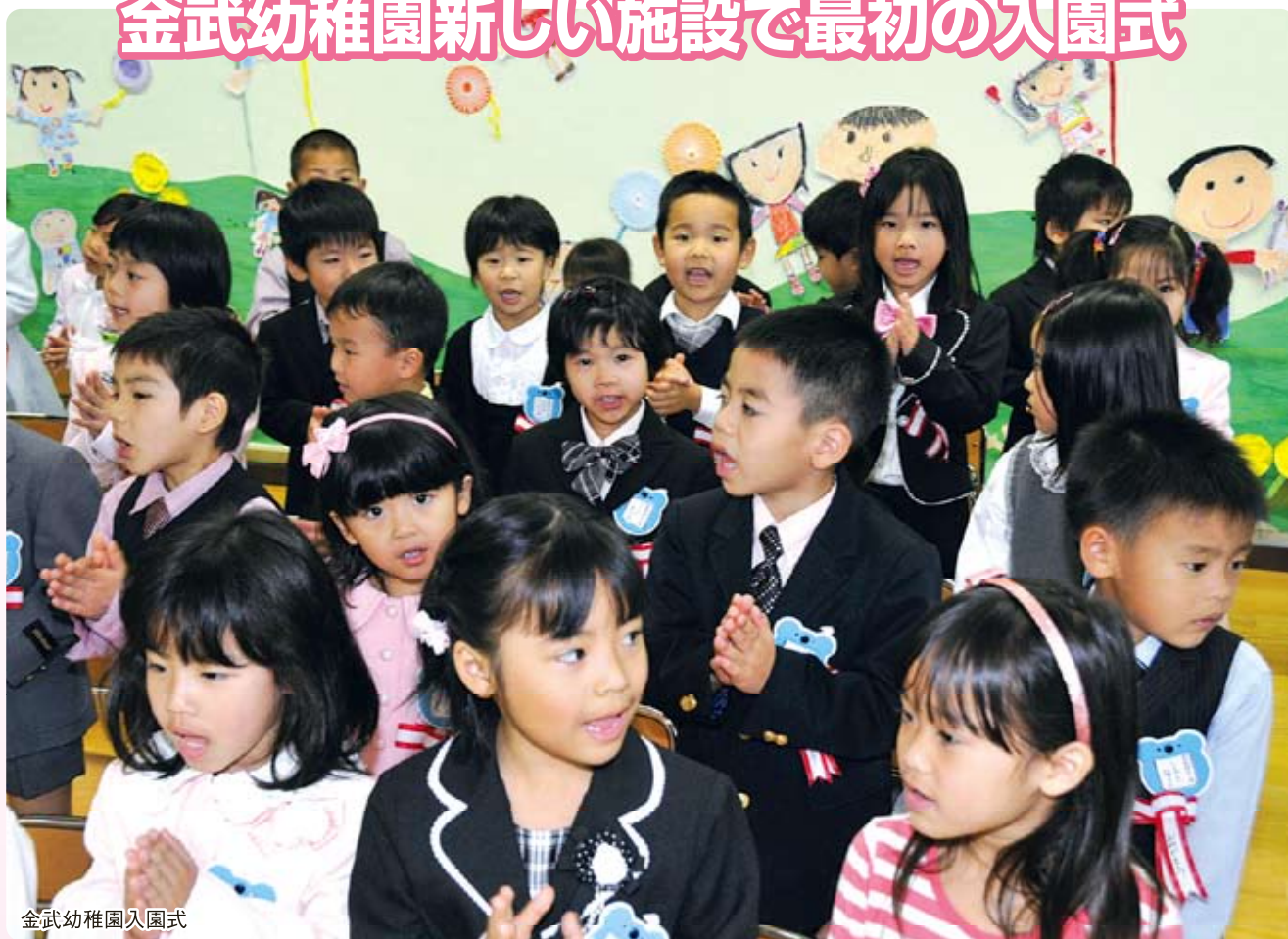
金武幼稚園入園式