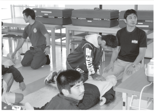
心臓マッサージ練習中

研修には、町内の子ども会から26名の小学5/6年生が参加し、心肺蘇生・物づくり・野外炊飯・ドッグセラピーなどたくさんの方の研修を行いました。最初は、恥ずかしがっていた子ども達も高校生・大学生のお兄さんお姉さん達のレクリエーションで仲良くなり楽しく研修を進めることができました。参加した子ども達も「心臓マッサージは難しかったけど勉強になった。」「犬のおかげで、多くの人に病気の回復や非常事態の時の助けとかすごいと思いました。」など色々な体験を通して学ぶことができたと思います。