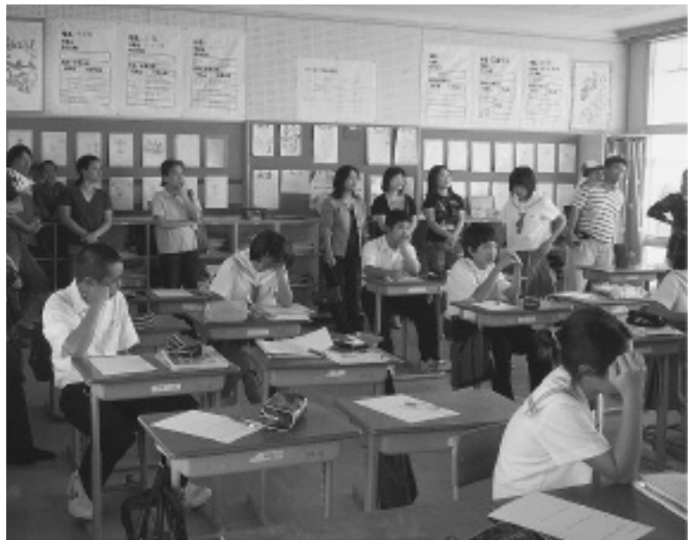
(金武中学校日曜授業参観風景)

して、夏休みのPTA研修会 (講演会や学校からの子ども の実態、そして、保護者同士のグ ループ討議等を予定)への参加 を期待しています。