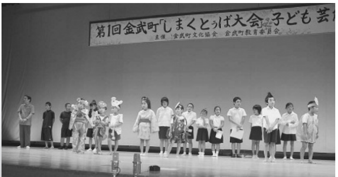
第一回「金武町しまくとぅば大会より」