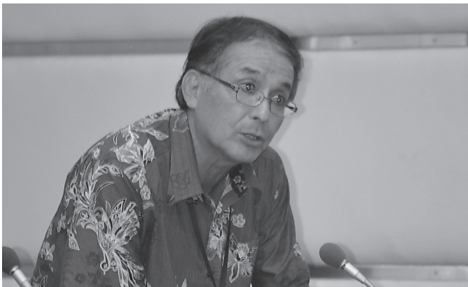
▲答弁する基地跡地推進課長

温泉施設につきましては、地下1千500mを掘削して温泉が出る予定になっております。現在、約1千300mまで掘っております。12月までには1千500mを掘って温泉が出るようになっております。さらにその温泉が出た後に、温泉の量や性質を調べて、また今後、建物の設計をして、また整備をしていくという計画があります。