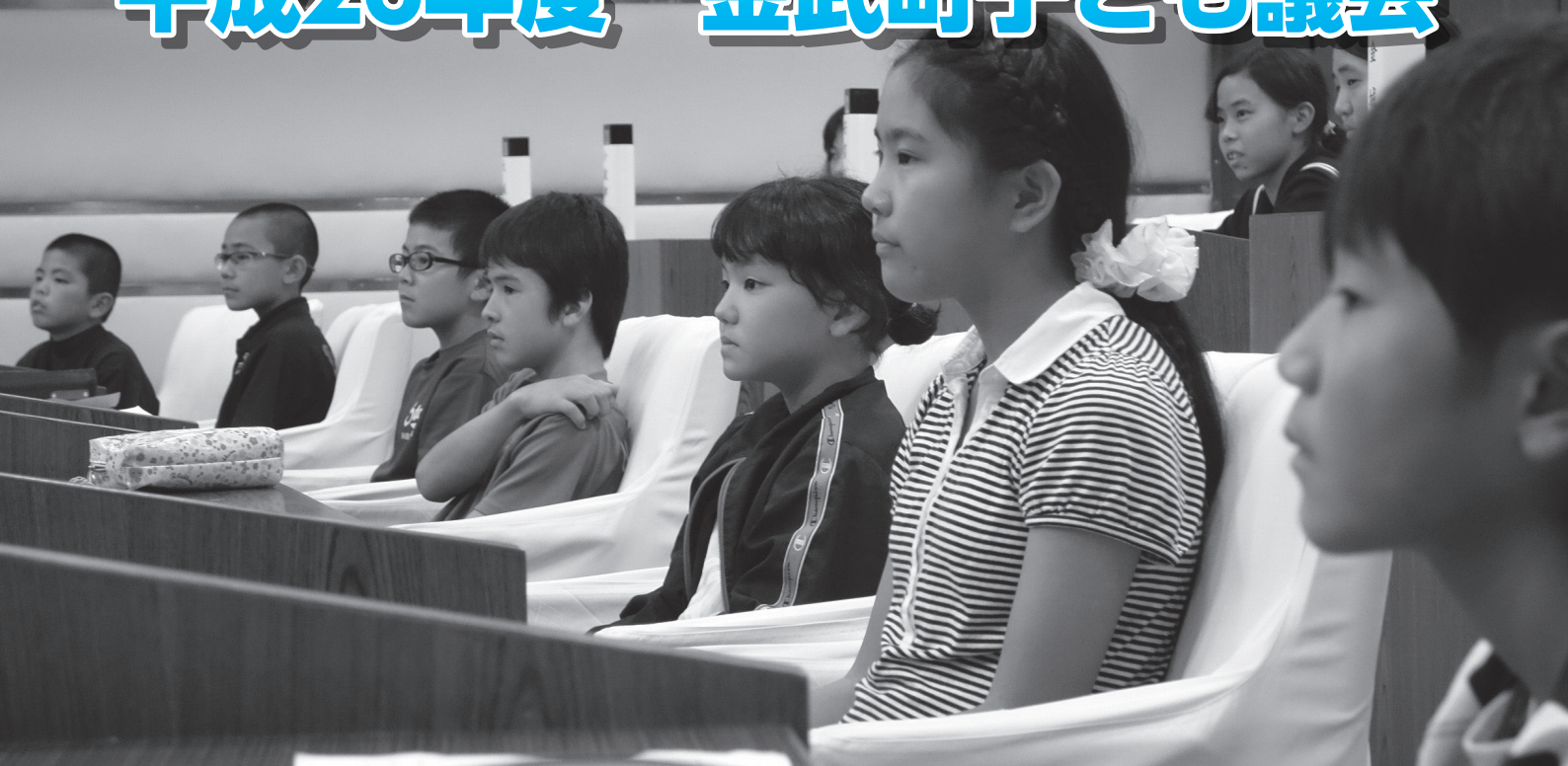
▲当選証書を交付された子ども議員の皆さん

11月28日、金武町議会議場で平成26年度金武町子ども議会が開かれました。今回は、町立各小・中学校を代表して16名が子ども議員として選出され、「街灯の設置」「公園の整備」等の町への要望や、「トイレの整備」「遊具の整備」等の学校生活に関する質問まで、多様な質問を当局に投げかけました。質問には関係する課長が答弁したほか、町長や教育長も、子ども議員の質問に丁寧に答えていました。 子ども議員たちは初めての体験に緊張しながらも、その重責を果たしました。 なお、次ページから各議員の質問の前文を掲載します。