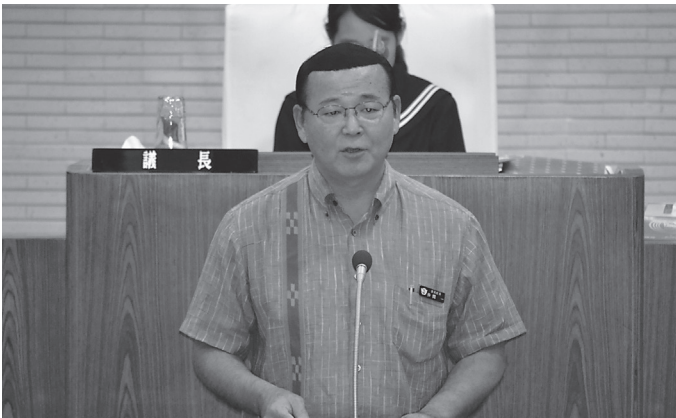
▲あいさつを述べる仲間町長

今後は、屋嘉の海で泳げる場所やネットが張れる場所を、区長さんや地域の皆さんと相談していきます。