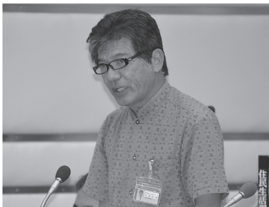
▲答弁する学校教育課長

心身ともに健全に育つこと等を目的に設置されています。 金武小学校には、以前複数の遊具が設置されていましたが、遊具で遊んでいた際にケガをするなどの事故が発生したことから、遊具を撤去しました。 しかし、その後、最近の遊具は安全性の高いしっかりした構造を有するものとなっておりますので、今後はどのような遊具がいいのか、中川小学校、嘉芸小学校も含めて、計画的に整備してまいります。