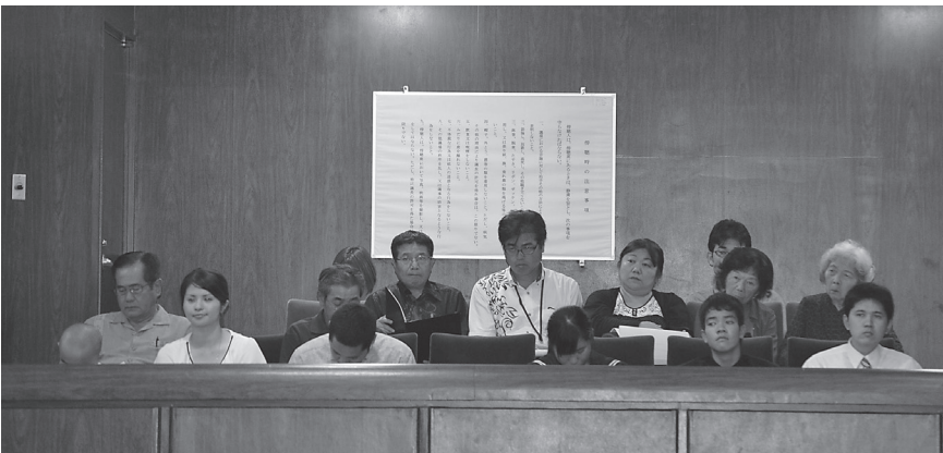
▲保護者や先生方も傍聴席で見守った

現在、金武中学校はその広いグラウンドのために、野球部とサッカー部が同時に部活動を行うことができません。とても恵まれた環境です。しかし、その反面、芝生の手入れにいつも手をこまねいている状態です。そこでトラクター型の芝刈り機が必要になっていると思います。これがあると芝生とグラウンドの維持、手入れがしやすくなると思います。いかがでしょうか。