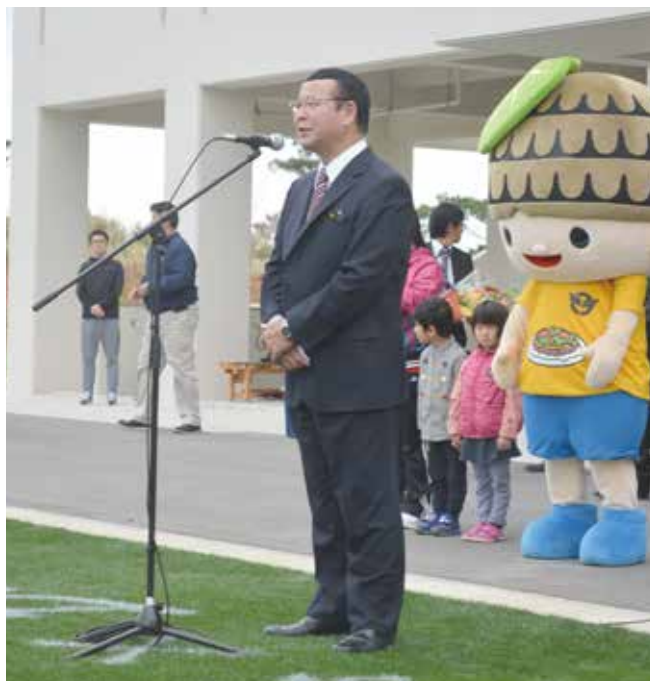
▶歓迎のあいさつを述べる仲間町長