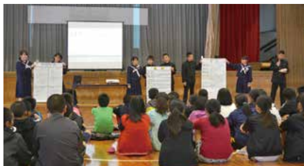
▲金武中生徒会から中学校生活の説明を受ける6年生