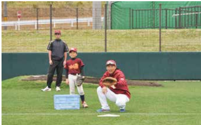
▲日本代表の嶋選手からキャッチャーの指導

2月13日から20日まで金武町ベースボールスタジアムにおいて東北楽天ゴールデンイーグルスが春季トレーニングを行いました。春季トレーニング期間中には少年野球教室や同球場を拠点に春季トレーニングを行っている韓国・起亜タイガースとの練習試合も行われ、普段テレビから流れるプロ野球選手の姿を二目見ようと、町内外から多くの観客が訪れました。