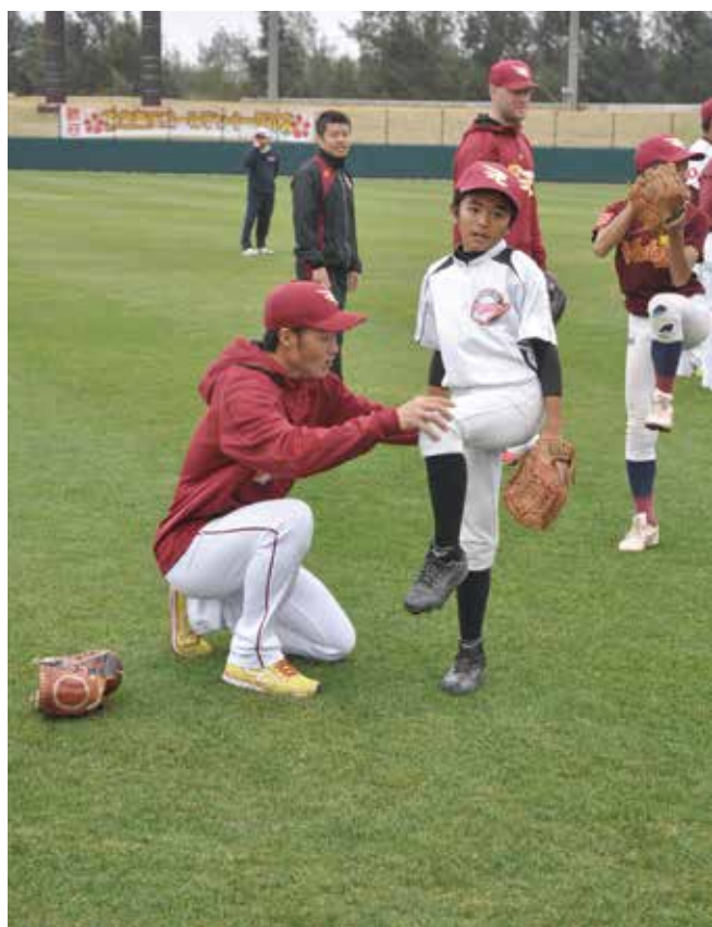
▲久保選手がマンツーマン指導