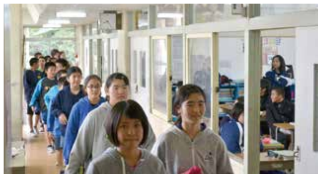
▲中学校を見学する6年生

子ども達からは、「授業が楽しそうだった」「部活動に興味がある」など期待と同時に「小学校との違いに不安もある」という声が聞かれました