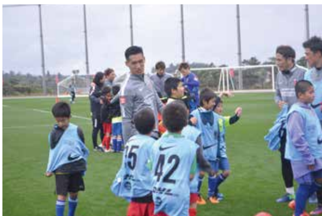
▲日本代表 まきの 楨野選手