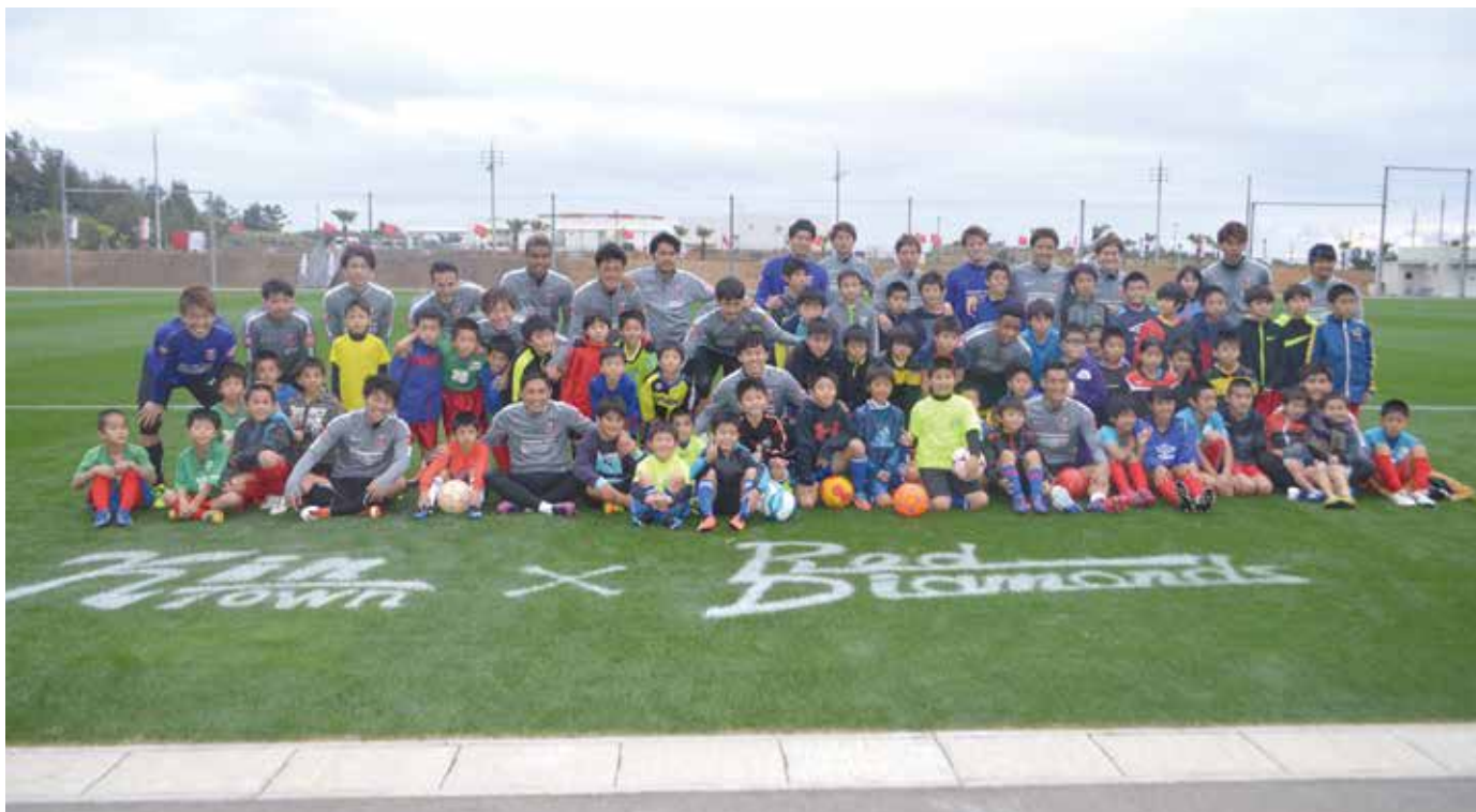
▲サッカー教室終了後町内の児童と集合写真