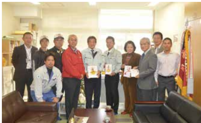
▲贈呈式の様子 寄付金贈呈者