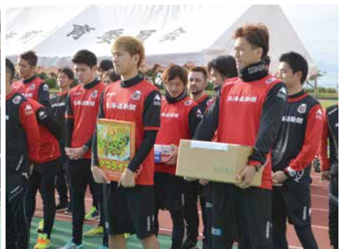
▲タコライスの寄贈