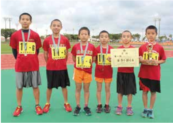
▲小学生の部優勝の金武少年イーグルスA