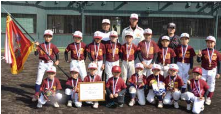
▲優勝した金武ヴィクトリーキッズ