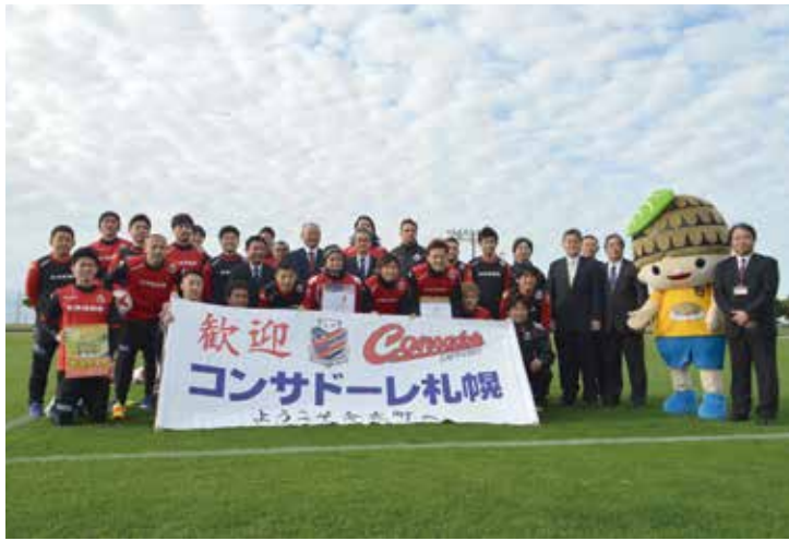
▲北海道コンサドーレ札幌の皆さん

1月16日から2月5日までの日程で、金武町陸上競技場でプロサッカーチームの北海道コンサドーレ札幌が春季練習を行いました。 同チームは2016年シーズンJ2で優勝し、今シーズンはトップチームが名を連ねるJ1の舞台でサッカーをするこ とになります。 本町で春季練習を行うのは今年で4年目。1月17日には歓迎セレモニーも開かれ、金武町のタコライスを沖縄県体育協会から陣中見舞いとして贈呈しました。