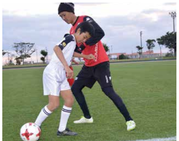
▲児童と触れ合う上原選手(沖縄県出身)