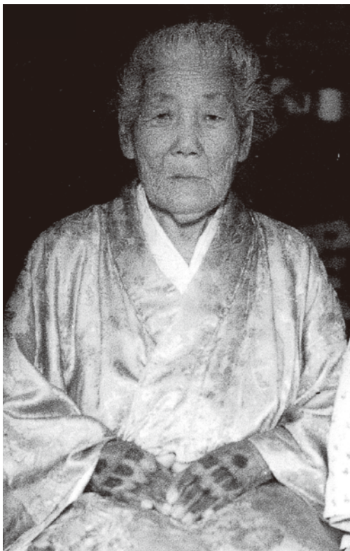
ハジチをした女性

町史編さん事業の調査等でわかった 「昔の金武町の暮らし」を ちょっと、のぞいてみませんか？