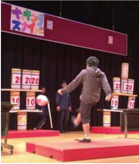
▶キッキングスナイパー

入場料100円とバザーの売上金 合計88,028円は、金武町共同募金委員会を通して、新潟県糸魚川市大規模火災へ寄付する予定です。