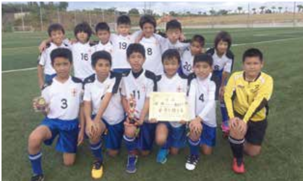
▲小学生の部優勝の金武FC・Aチーム