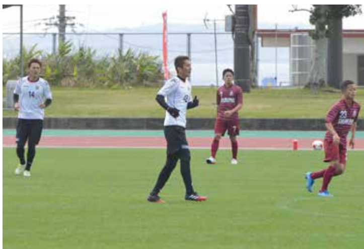
▲練習試合の様子(白:コンサドーレ札幌)