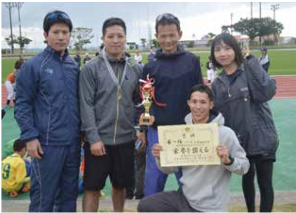
▲一般の部優勝の金武地区消防

1月15日金武町陸上競技場・金武地区公園で、第50回金武町駅伝競走大会が開催されました。一般の部12チーム、小学生の部15チームの参加者がグラウンドを駆け抜けました。