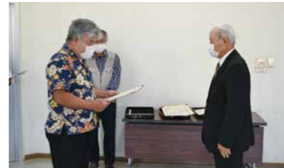
▲町文化協会会長(左)から受賞者(右)への伝達表彰の様子