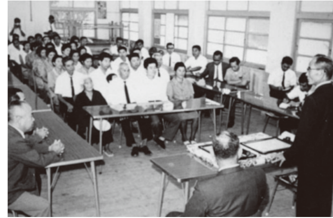
松岡政保行政主席の金武村行政視察(1965年)