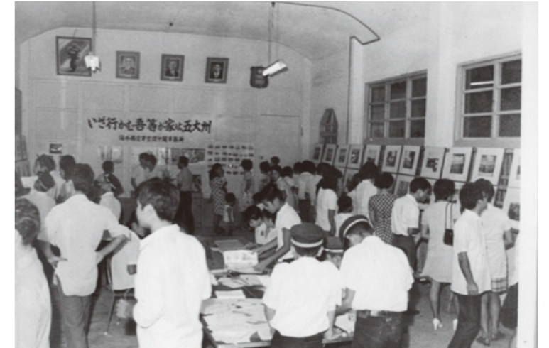
「當山久三まつり」展示風景(1974年)

文化審議会が新たに登録するよう答申した文化財は、全国で一〇四件、その中に當山記念館が含まれました。老朽化していた當山記念館は、平成二十八年に建築当時の形に改修されま