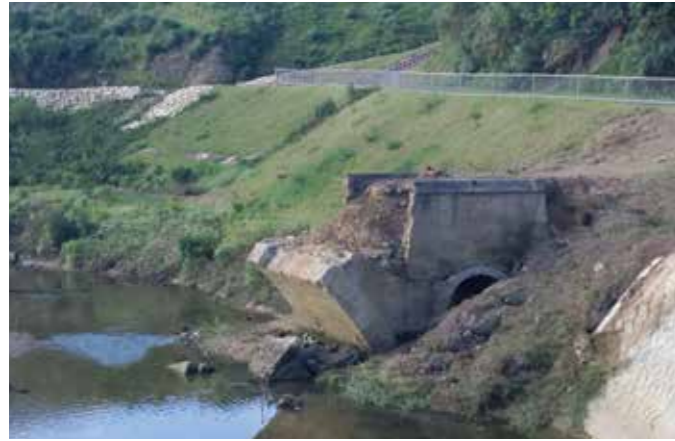
旧億首橋(字金武億首川河川地内)

金武町教育委員会が新たに指定する文化財は、「旧億首橋」と「金武村の忠魂碑」の二件で町教育委員会が町指定文化財に指定するのは二十六年ぶりとなります。