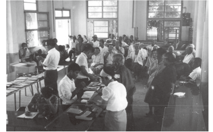
金武村役場の利用状況(1970年代)

十一月二十日、国の文化審議会は、當山記念館を国の登録有形文化財(建造物)に登録するよう文部科学大臣へ答申しました。