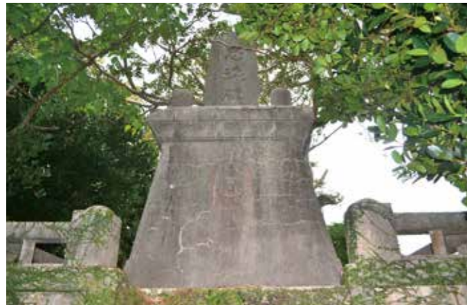
旧金武村の忠魂碑(字金武四番地)

十二月四日、金武町教育委員会は、「旧億首橋」と「金武村の忠魂碑」を一月一日付けで金武町指定文化財に指定することを決めました。