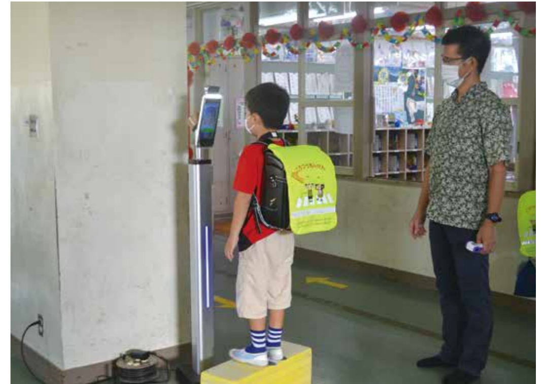
最初は固定式タイプの温度計で検温します。