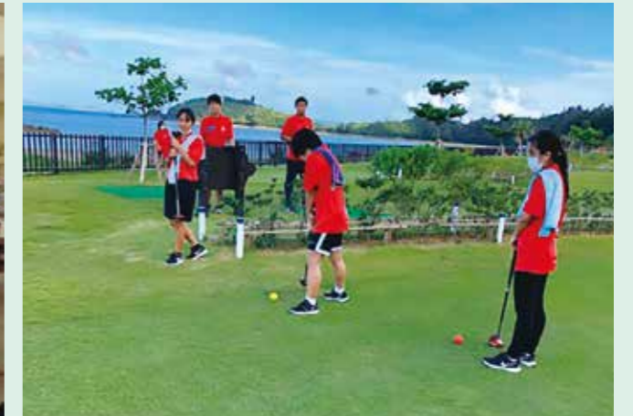
▲パークゴルフ交流会