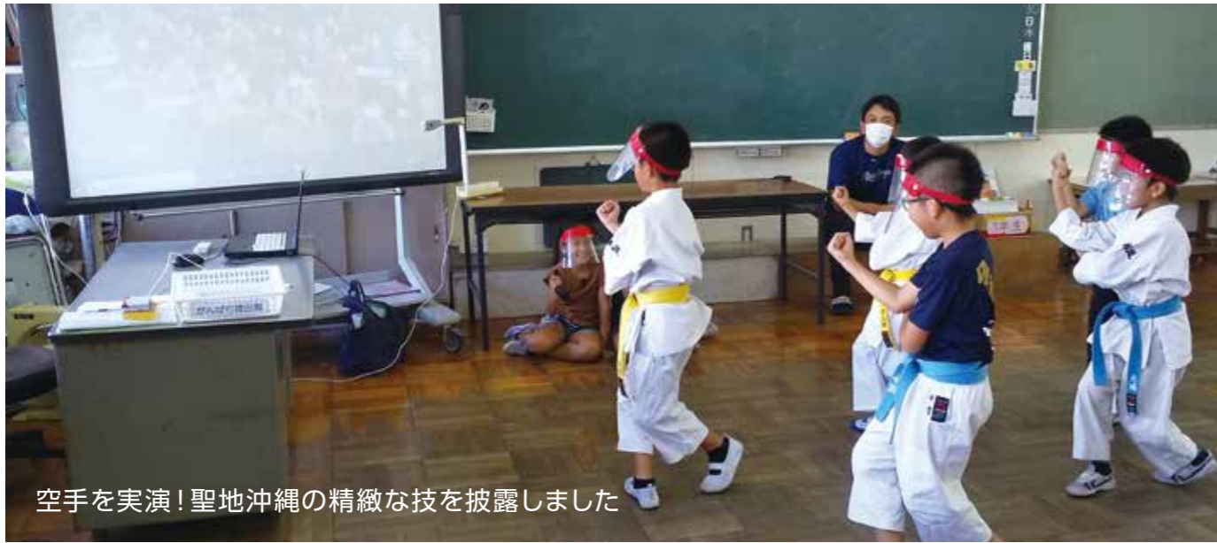
空手を実演！聖地沖縄の精緻な技を披露しました

7月30日（木）、金武小学校と埼玉県の東野小学校が初のオンライン交流事業を実施しました。本授業は地域のことを学習・発表することを目的とし、電子黒板を通して互いに地元の特産品や観光スポット等を発表し合い、自発性の高い授業を展開していました。