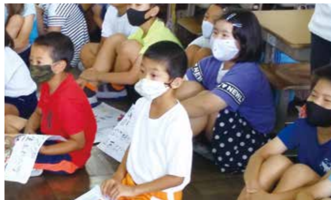
感染防止対策もしました