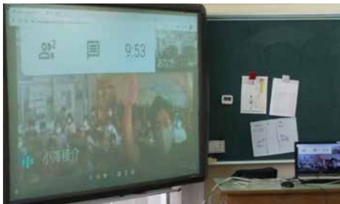
コロナ禍でも電子黒板の多様性を発揮