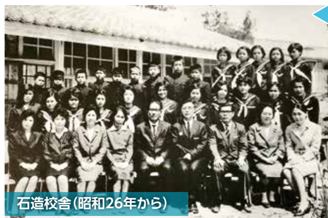
石造校舎(昭和26年から)