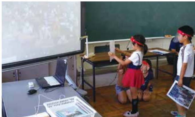
児童がピックアップした観光地、特産品等を通して交流しました

交流開始前はカメラ前の立ち位置や写り具合、声の大きさ、作品の見せ方など、児童は発表練習を入念に行い、情報機材を活用し、コミュニケーション能力をさらに高めていました。