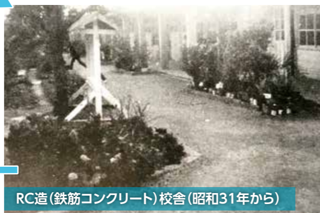
RC造(鉄筋コンクリート)校舎(昭和31年から)