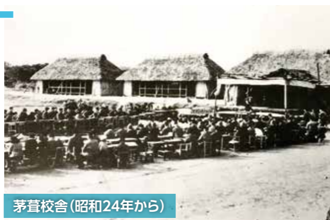
茅葺校舎(昭和24年から)