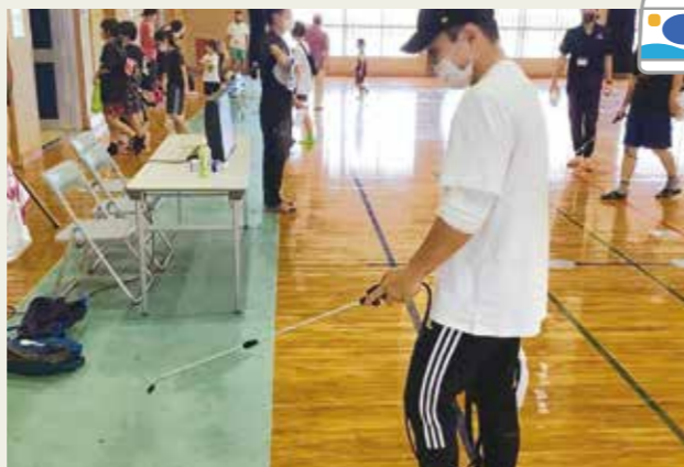
体育館アリーナを消毒