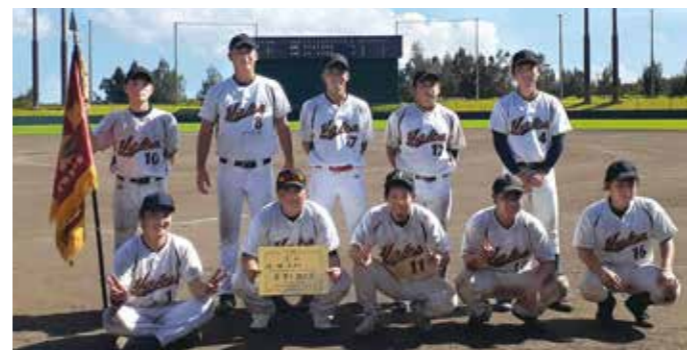
軟式野球競技優勝の屋嘉区チーム

日時 6月14日(日) 会場 金武ベースボールスタジアム他 優勝 屋嘉区 3年ぶり 10回目