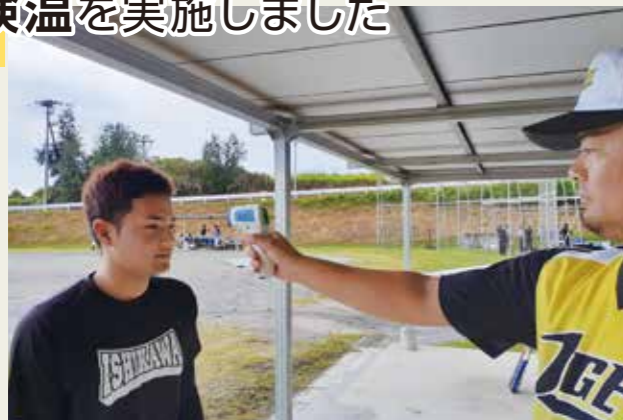
屋外競技で検温を実施