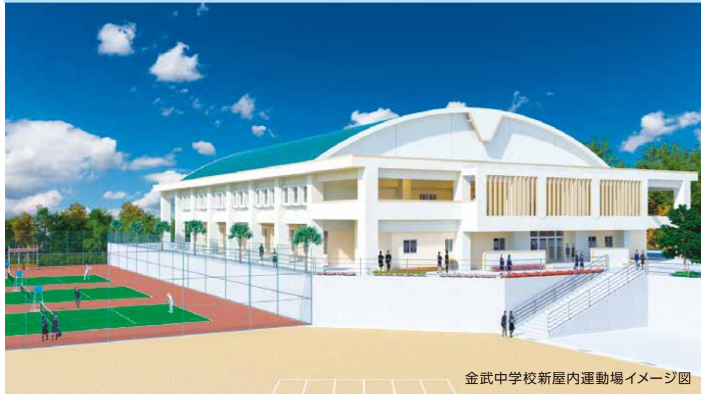
金武中学校新屋内運動場イメージ図