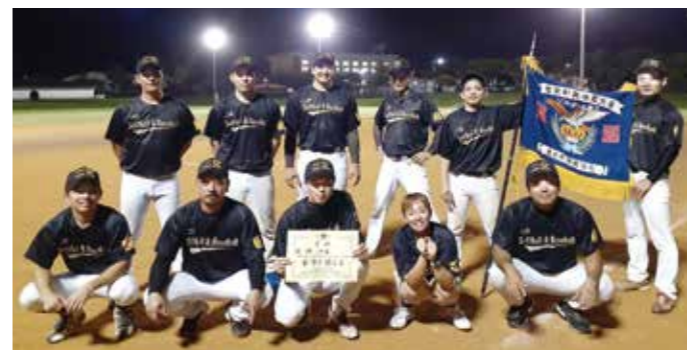
ソフトボール競技優勝の二区チーム