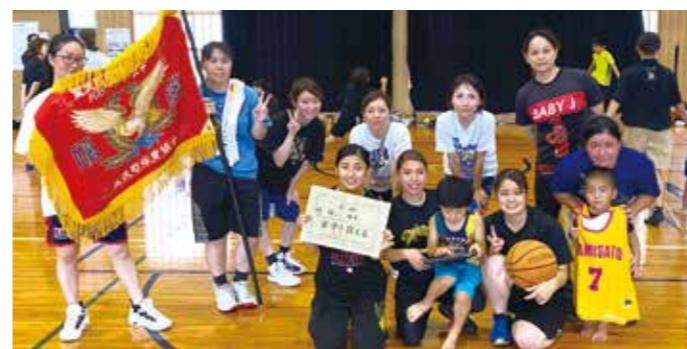
バスケットボール競技女子優勝の四区チーム