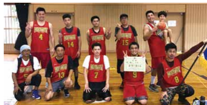
バスケットボール競技男子優勝の二区チーム