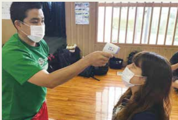
屋内競技で検温を実施