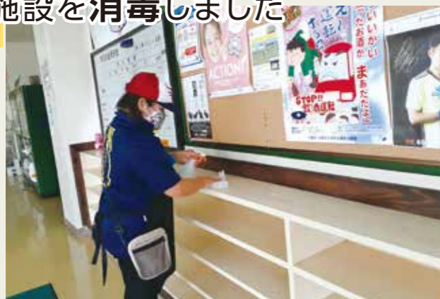
体育館靴箱付近を消毒