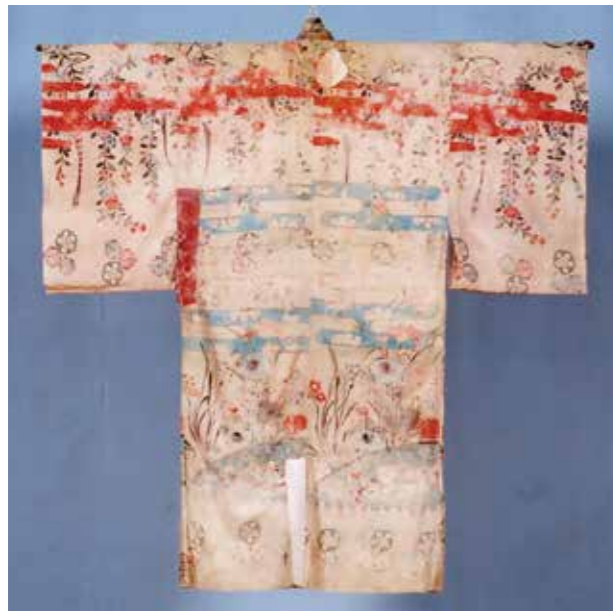
▲追加で再現制作される予定の紅型衣装 (屋嘉の芸能衣装 No.4)