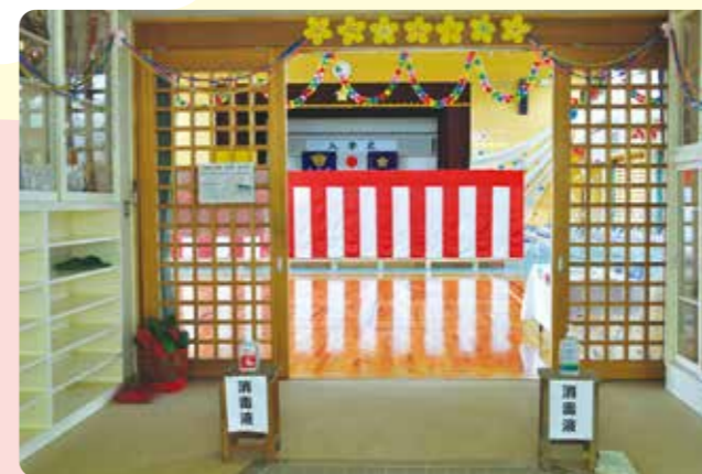
会場入口で消毒の実施