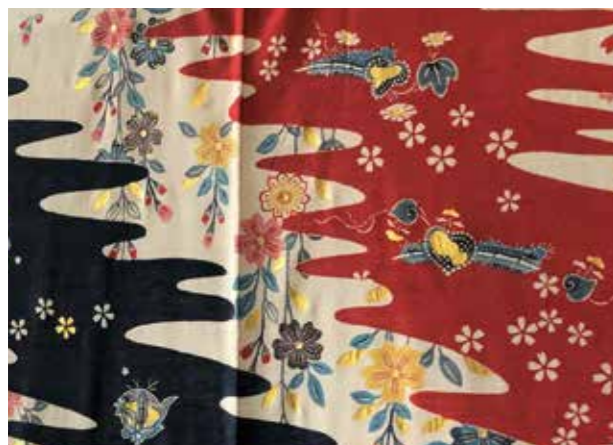
▲今回再現制作された紅型衣装の近接写真 花の模様金箔を貼り付けている