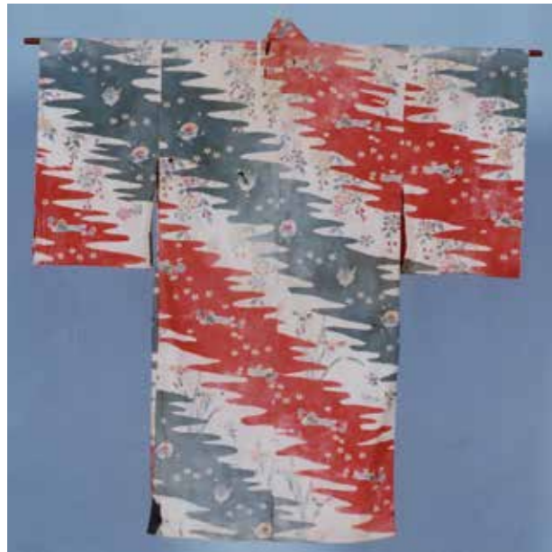
▲今回再現制作された紅型衣装の原資料 (屋嘉の芸能衣装 No.5)

また、今年度は「No.4」という管理番号が付された紅型衣装の再現制作も追加で行う予定です。