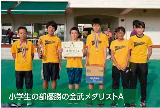
小学生の部優勝の金武メダリストA