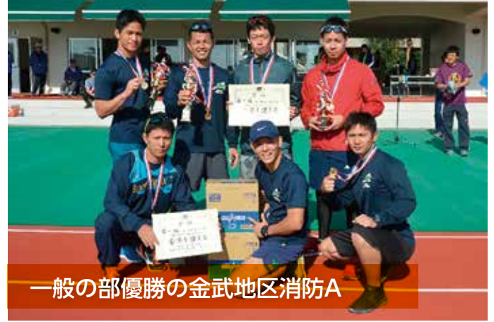
一般の部優勝の金武地区消防A

1月13日金武町陸上競技場・金武地区公園で、第52回金武町駅伝競走大会が開催されました。一般の部6チーム、小学生の部17チームの参加者がコースを駆け抜けました。