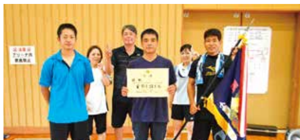
▲バドミントン競技優勝の二区チーム

6月24日(日)会場 金武町立体育館 優 勝・・二 区 (2年ぶり6回目) 準優勝・・中川区