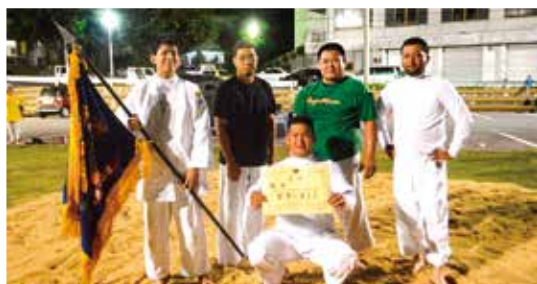
▲沖縄角力競技優勝の屋嘉区チーム

7月14日(土)会場 金武公会堂前広場 優 勝・・屋嘉区 (2年ぶり8回目) 準優勝・・四 区