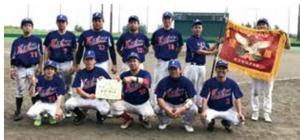
▲軟式野球競技優勝の一区チーム

6月10日(日)会場 ベースボールスタジアム 優勝・・・一区 (2年ぶり6回目) 準優勝・・・三区