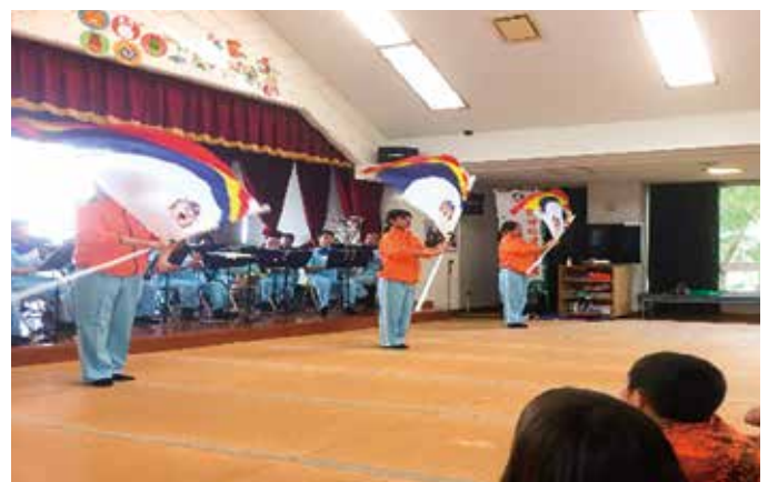
△沖縄県警察音楽隊の方々