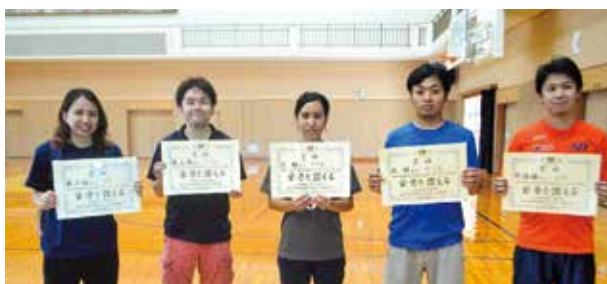
▲バレーボール競技上位入賞チーム

7月8日(日)会場 金武町立体育館 男 子 優 勝・・中川区 (12連覇) 準優勝・・三 区 女 子 優 勝・・中川区 (5連覇) 準優勝・・伊芸区