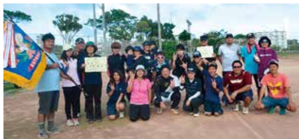
▲ソフトテニス競技優勝の四区チーム

7月15日(日)会場 金武町営庭球場 優 勝・・四 区 (3連覇) 準優勝・・中川区