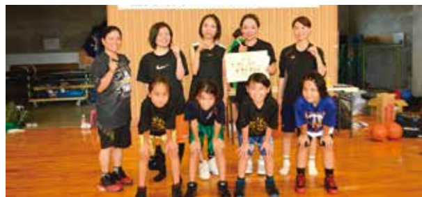
▲バスケットボール競技女子の部優勝の四区チーム

6月17日(日)会場 金武町立体育館 優勝・・・四区 (2年ぶり12回目) 準優勝・・・三区