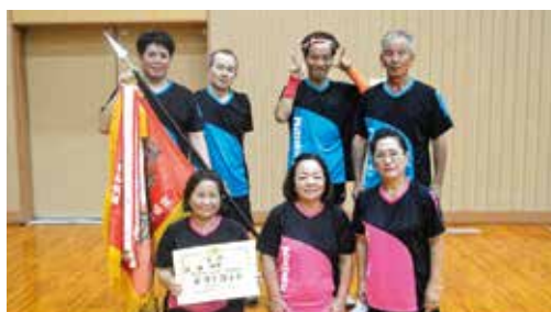
▲卓球競技優勝の四区チーム

7月12日(木)会場 金武町立体育館 優 勝・・四 区 (11連覇) 準優勝・・二 区