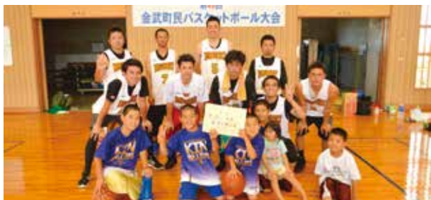
▲バスケットボール競技男子の部優勝の二区チーム

6月17日(日)会場 金武町立体育館 優勝・・・二区 (29連覇) 準優勝・・・三区