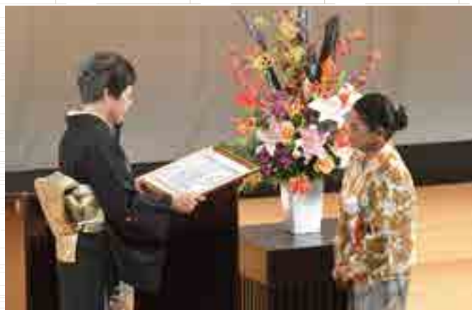
▲感謝状贈呈のようす