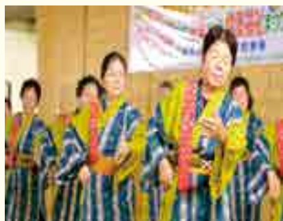
琉舞サークル ちどり