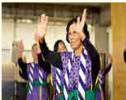
金武町踊りサークル ひまわり