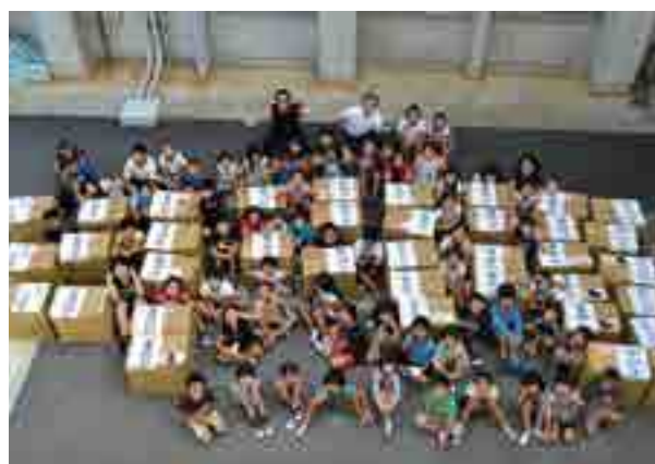
▲中川小学校の児童と先生

内容は、ユニクロ社員による出張授業を受けたのち、児童・生徒が主体となって、着なくなった子供服を回収し、本当に必要とする人々に届けます。