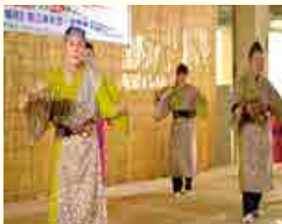
琉舞サークル 美ら舞