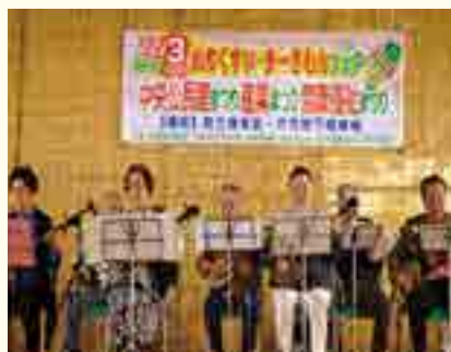
民踊サークル「ちぶみ」