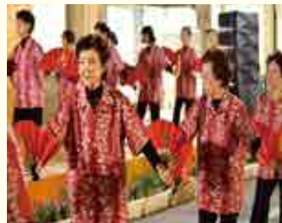
金武町民踊愛好会