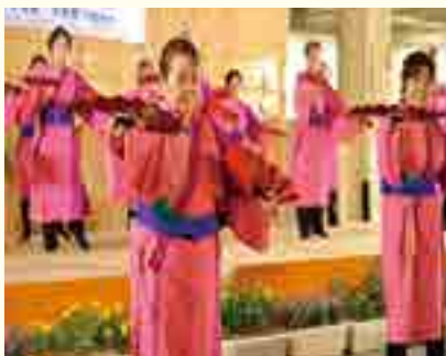
金武町いろは民踊サークル