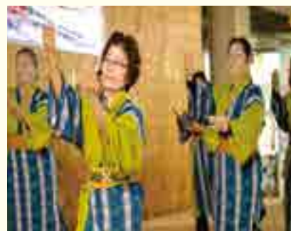
琉舞サークル 友輪