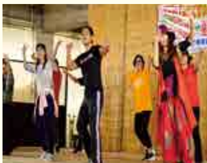
金武ラテンダンスサークル

十二月三日(日)にぬちぐすい・ま～すむんフェアの中で公民館まつりが開催されました。 町立体育館下特設ステージにおいて各サークルが日頃練習している成果を披露し、会場を大きく盛り上げていました。 また、町立体育館内では各サークルの展示・公民館講座で作成したアダン帽子などの作品が展示されました。