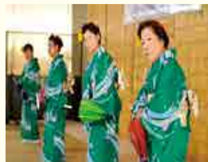
日本舞踊サークル