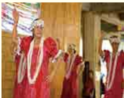
フラサークル・マヒナヒナ