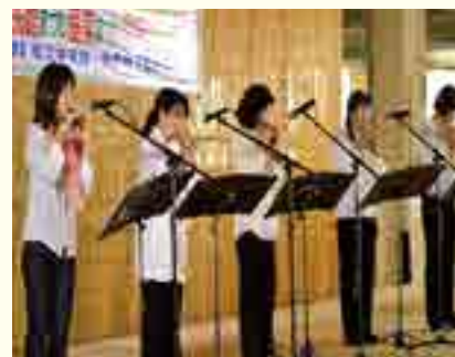
オカリナサークル 群星