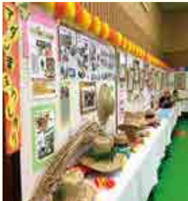
▲体育館内の展示の様子▶