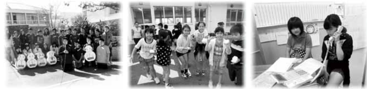
▲6年生の新潟へのメッセージ「宜しく!」(新潟のテレビで放映) ▲雪で遊ぶ子ども達・大はしゃぎ(テレビ取材を受けました) ▲FM雪国(ラジオ生放送)のインタビューも電話で受けました。

6年生は2月8日~11日、南魚沼市での六日町小学校と交流まつりで、エイサー披露、スキー体験をします。それに先立ち、雪だるまが送られてきました。