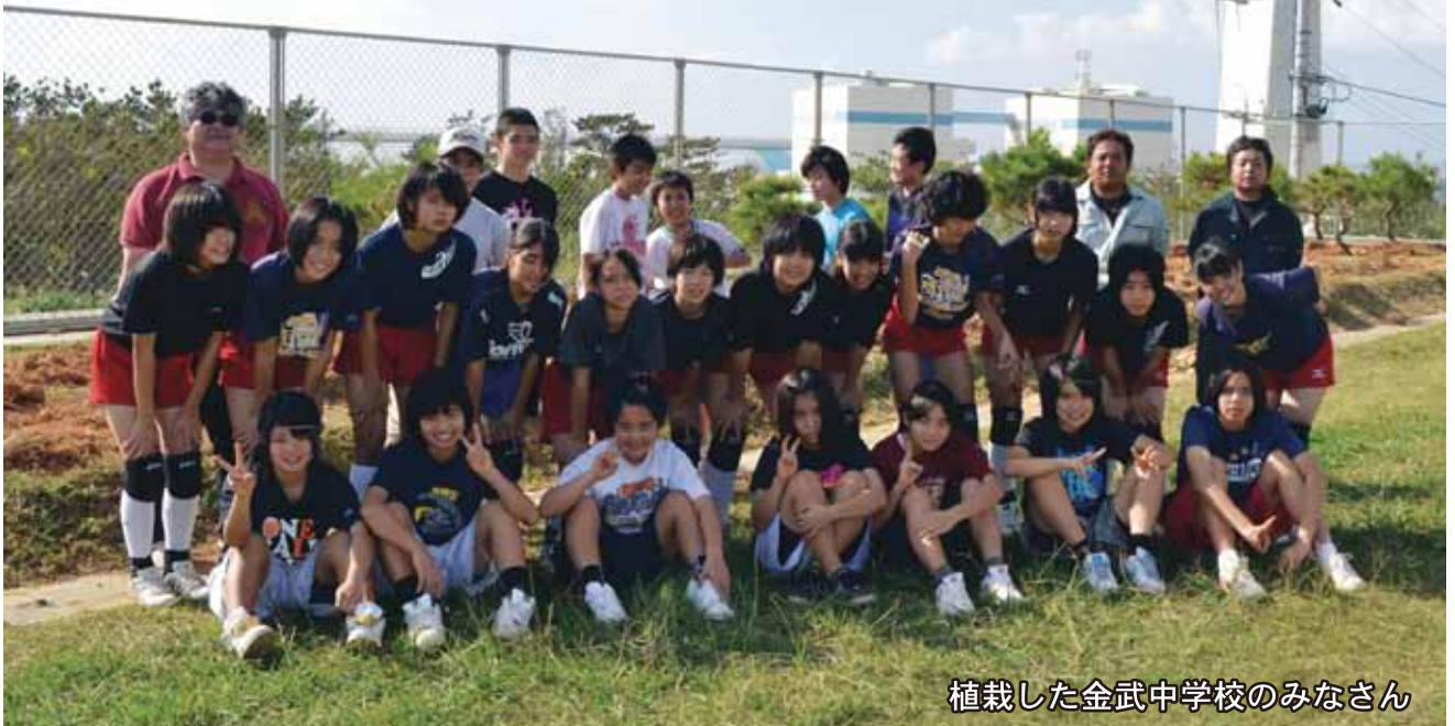
植栽した金武中学校のみなさん