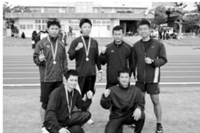
▲一般の部優勝の金武地区消防A