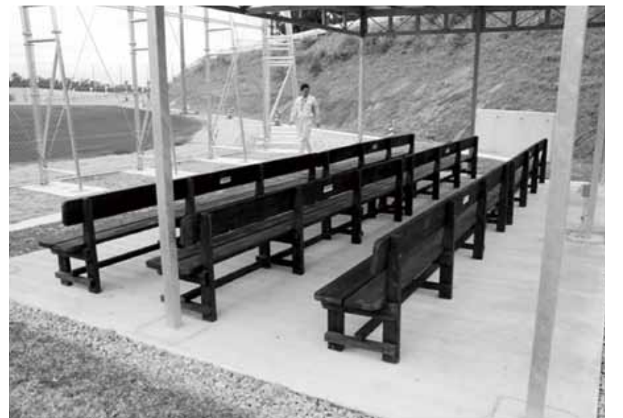
▲寄贈された木製長椅子

平成25年2月8日、株式会社丸政工務店から金武町ベースボールスタジアム多目的広場が完成したことに伴い、同広場を多くの方々にご利用されることを祈願して、丸政工務店職員の手作りによる木製長椅子6脚が寄贈されました。