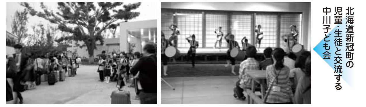
北海道新冠町の児童・生徒と交流する中川子ども会

1月8日、ネイチャーみらい館で、北海道の新冠町と中川子ども会の交流会がありました。中川子ども会は、6年生13人、5年生2人と中学1年生5人、一方、新冠町は小学生15人、中学生5人の20人での交流です。私達中川子ども会6年生は、出迎え式をした後、新冠町の小・中学生にエイサーを披露しました。その後、トランプやゲームで交流し仲良くなりました。私達中川子ども会も、北海道を知るためにも新冠町を訪問したいと思います。