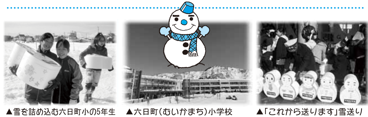
▲雪を詰め込む六日町小の5年生 ▲六日町(むいかまち)小学校 ▲「これから送ります」雪送り