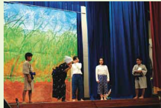
▲5・6年「さとうきびのはなゆれて」