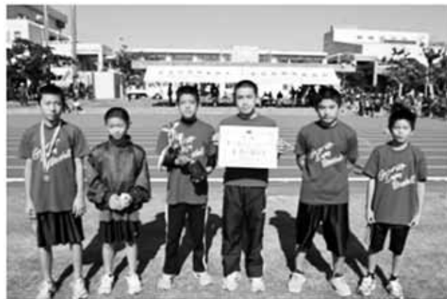
▲小学生の部優勝のヴィクトリーキッズA