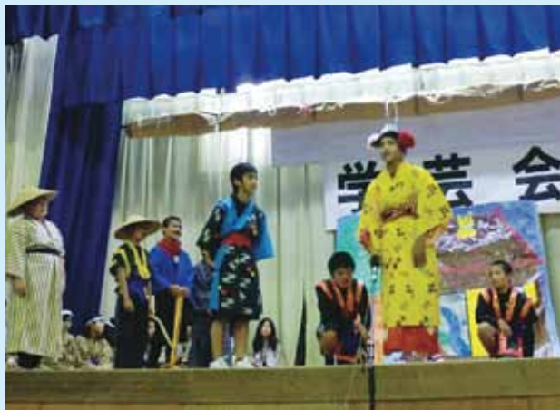
▲6年「妃と6にんのわざ師」