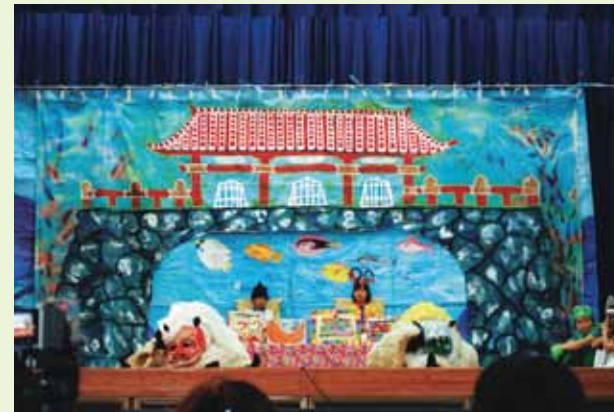
▲1・2年 うらしまたろう