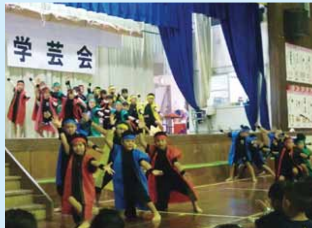
▲3年「よさこいソーラン」