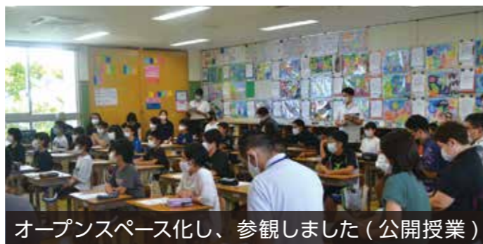
オープンスペース化し、参観しました（公開授業）