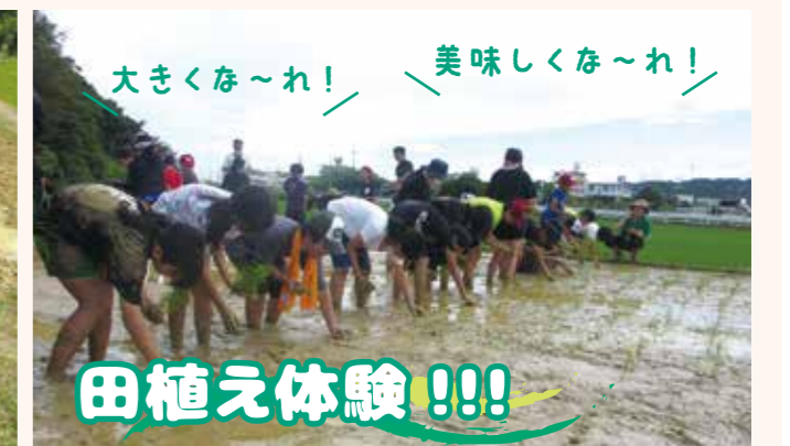
大きくな~れ! 美味しくな~れ!