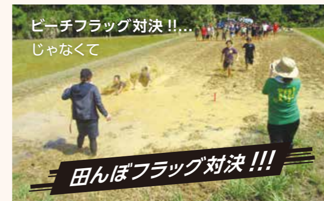
ビーチフラッグ対決!!... じゃなくて

地域の方や町農林水産課の職員の協力のもと実施し、8月14日(金)に草刈り作業、8月21日(金)にどろあそび体験、8月28日に田植え体験を行いました。