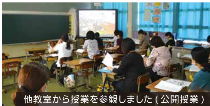
他教室から授業を参観しました（公開授業）