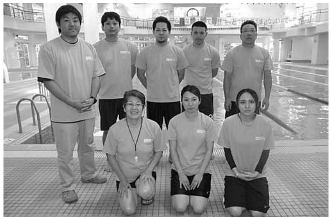
▲町営プールのスタッフのみなさん