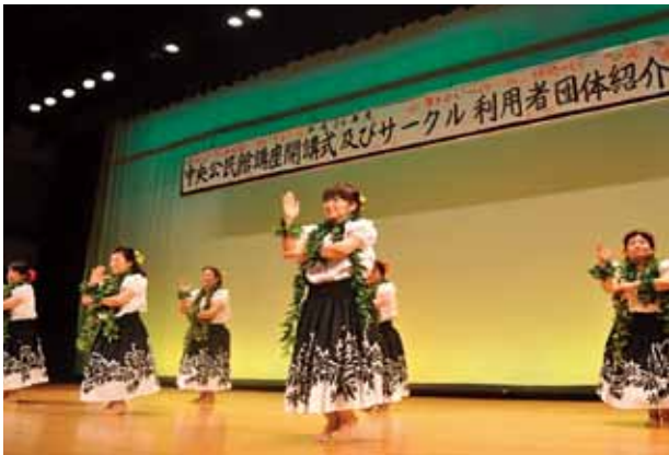
▲フラダンスサークル