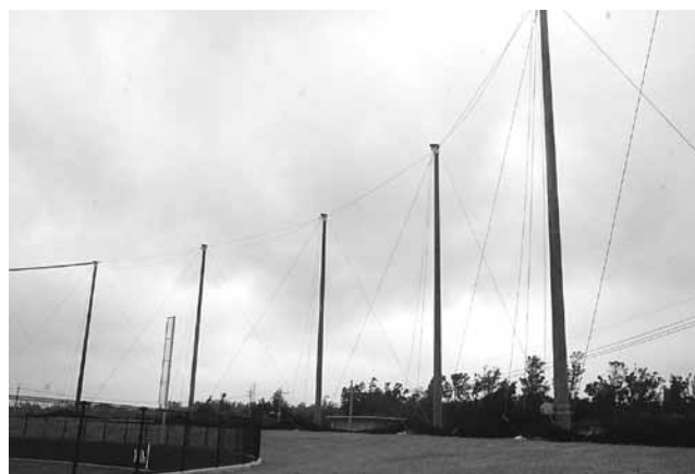
▲設置された防球ネット