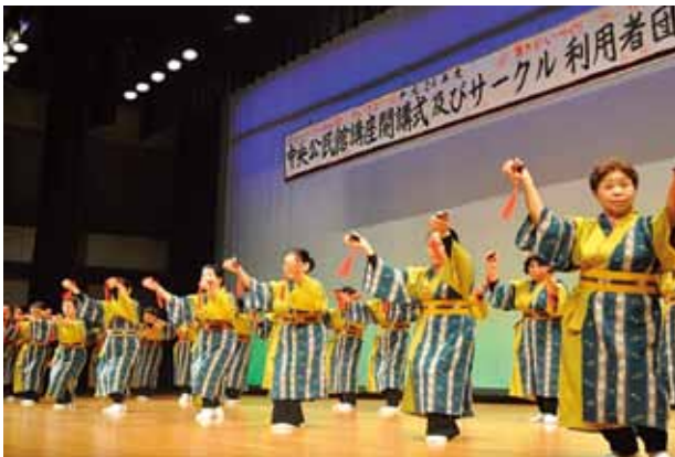
▲琉舞サークル「ちどり」と三線サークルによる共演