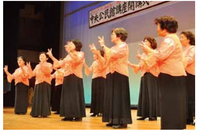
▲女声コーラス「さくら」