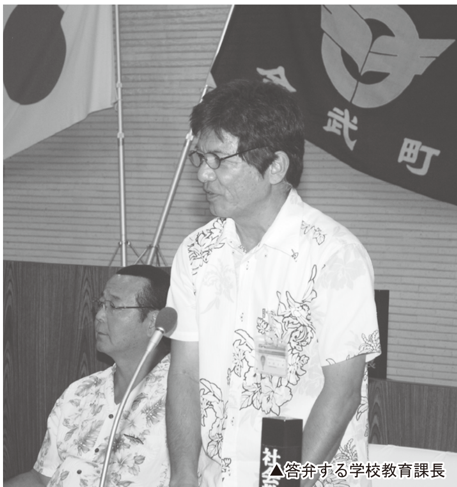
▲答弁する学校教育課長

部分の錆等の劣化が著しいため、早急に改善していきます。また、町内の学校に遊ぶ場を作ることにしても、各小学校の遊具の状況を確認し、修理が必要なのか、作り替えが必要なのかを検討し、整備すること