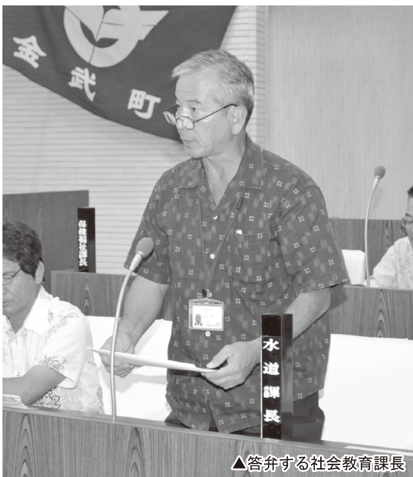
▲答弁する社会教育課長

私みたいに遠くに住んでいる人からすれば不便です。なので、私は「無料バス」や「移動図書館」があったほうがいいと思います。無料バスは、時間を決めて無料で町立図書館やプールの近くに送り迎えをするバスがあるとうれしいです。