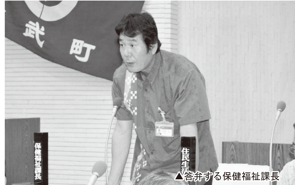
▲答弁する保健福祉課長

これは、日本政府とアメリカ政府との間で日米安全保障条約が結ばれ、その中で決められたものであります。