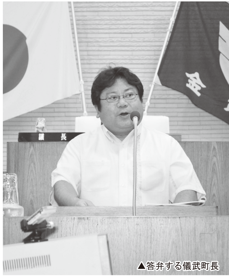
▲答弁する儀武町長