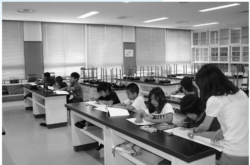
▲金武小学校での補習授業のようす

これまでの学習の定着を図るとともに、わかる喜びや達成感を味わうとともに、自らの学習課題を認識することで、夏休みの間に課題を克服し、新学期につなげていくことを目的に、今年度も町内各小・中学校で夏休み期間中に補習授業(サマースクール)が実施されました。 同授業は、学習支援員(教員免許取得者)の協力を得て、本務教員との連携を図りながら実施されたものです。児童・生徒たちは夏休み期間中にも関わらず、真剣に授業に取り組んでいました。