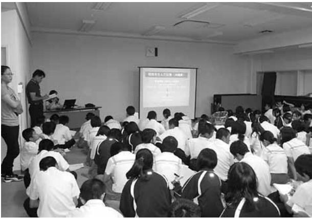
▲移民の話を書く生徒

中学三年生という今後の進路や将来の夢を胸に秘めた本町の子ども達に、郷土出身の偉人が世界を舞台に成し遂げた歴史を紹介することで、郷土への誇りそしてグローバルな視点が強く感じられた講座となったことを願います。