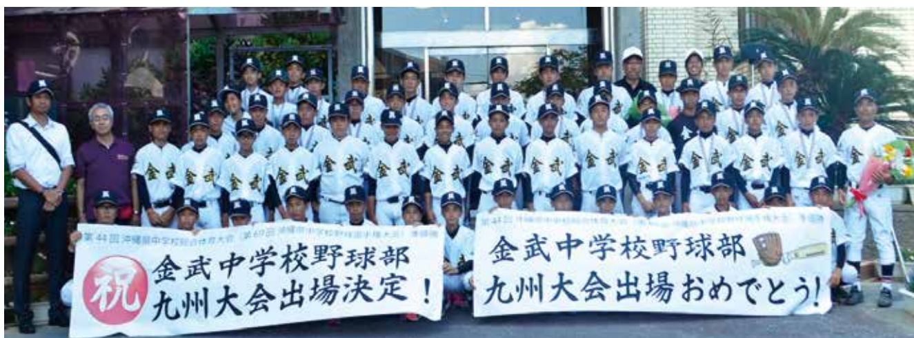
▲平成29年第69回沖縄県中学校野球選手権大会準優勝