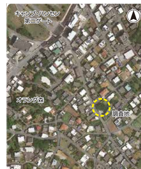
▲遺跡発見・文化財調査の場所

土器が初めてつくられた時代で、今からおよそ1万2千年ほど前から約1万年間続きました。縄文時代という名前は、縄で文様をつけた土器が多く見つかったことから名付けられました。