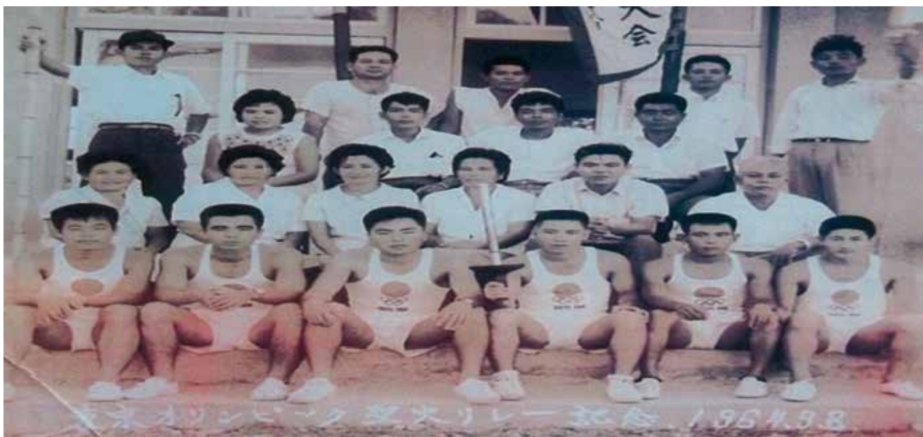
▲1964年9月8日 東京オリンピック聖火リレー記念