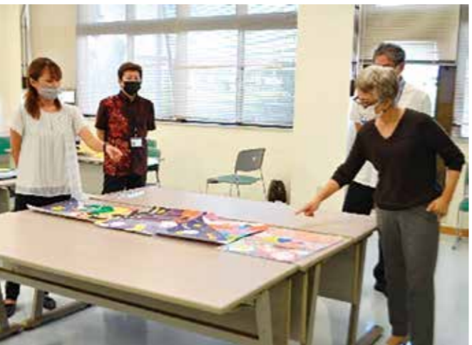
▲ポスターの部を審査する様子

参加型の大会に代わって、自粛中の児童生徒が家庭で取り組むことができ、大会の趣旨を伝えられるよう、作文・ポスター金武町大会を実施し、その作品を展示することとしました。